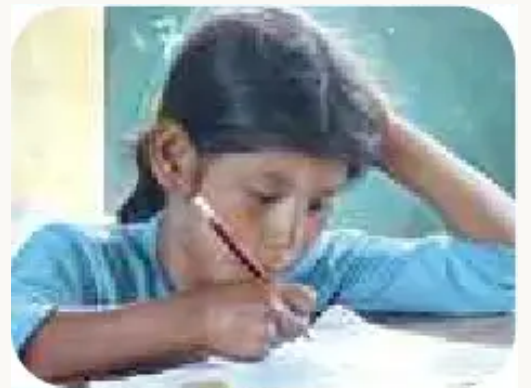
Unidad Educativa Colorado: "Estoy resolviendo ejercicios de matemáticas, para eso tenemos que concentrarnos mucho". Ayopaya.

"SOMOS NIÑOS QUE ESTAMOS PARTICIPANDO EN LA OCTAVA MARCHA DEFENDIENDO EL TIPNIS. SALUDAMOS A TODOS LOS QUE LEEN ESTA REVISTA "AÑASKITU" CHAU"