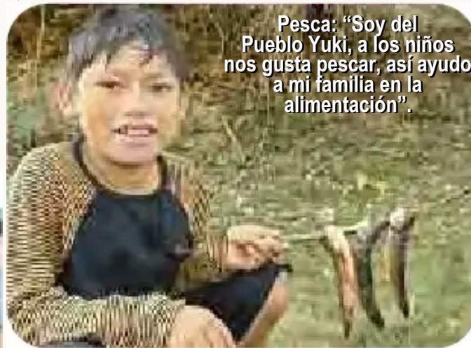
Pesca: "Soy del Pueblo Yuki, a los niños nos gusta pescar, así ayudo a mi familia en la alimentación".

"SOMOS NIÑOS QUE ESTAMOS PARTICIPANDO EN LA OCTAVA MARCHA DEFENDIENDO EL TIPNIS. SALUDAMOS A TODOS LOS QUE LEEN ESTA REVISTA "AÑASKITU" CHAU"