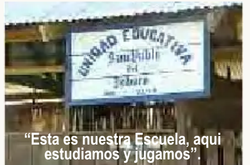
"Esta es nuestra Escuela, aquí estudiamos y jugamos".