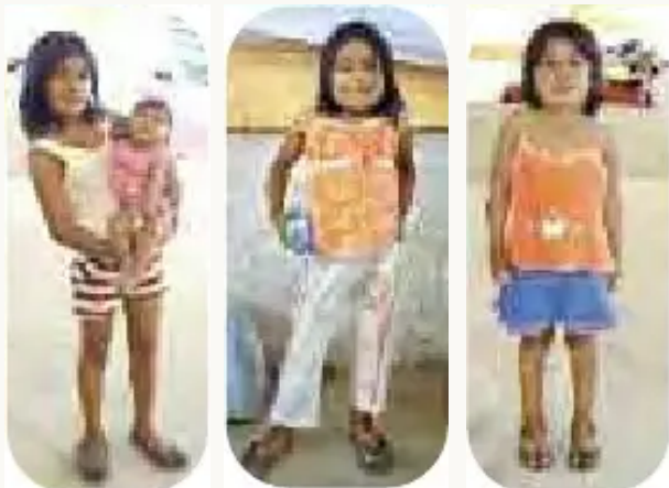
"Nosotras también estamos marchando junto a nuestras familias, defendiendo el TIPNIS".