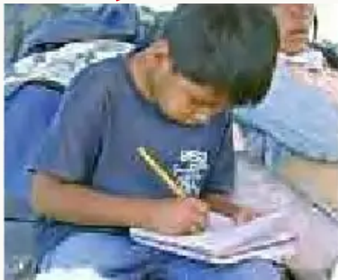
"Estoy haciendo mis tareas, mientras viajamos en la chata por el río Isiboro".