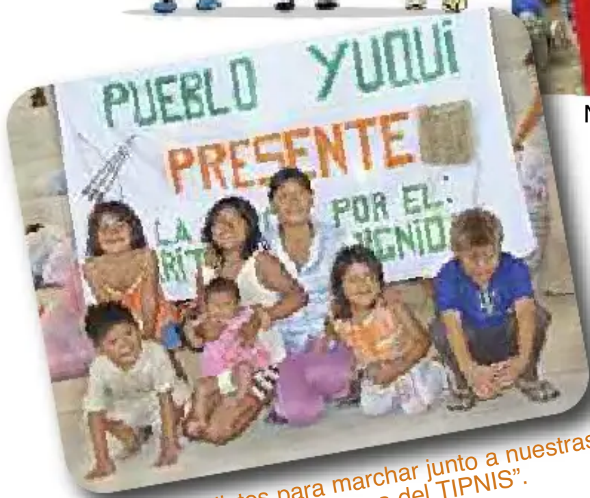
“Estamos listos para marchar junto a nuestras familias en defensa del TIPNIS”. (Trinidad 14 de agosto 2011)