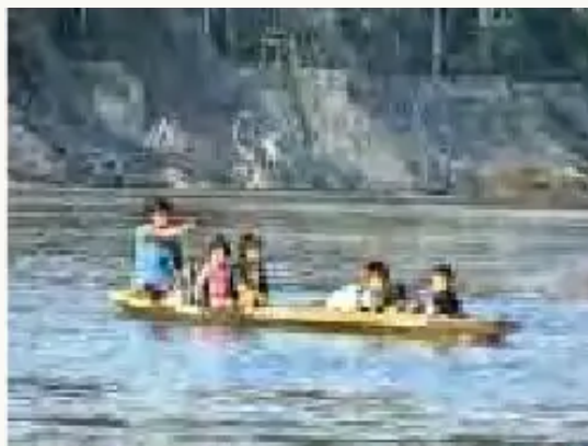
"Las familias en el TIPNIS viajamos por los ríos, estos ríos grandes y largos son nuestra carretera".