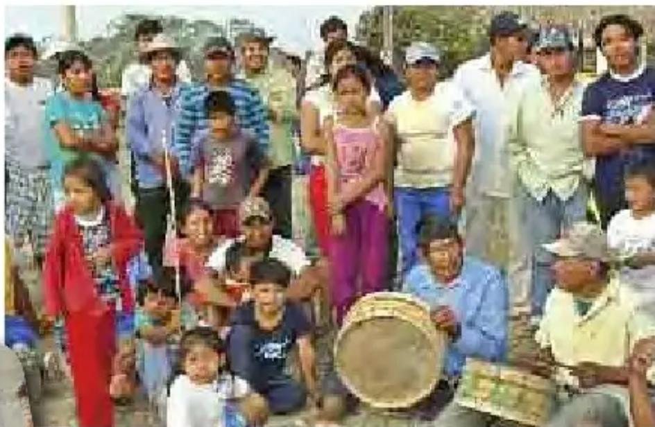
Niños junto a sus familias se alegran con su música, mientras descansan. (Puerto San Borja-Beni 23 de agosto 2011)