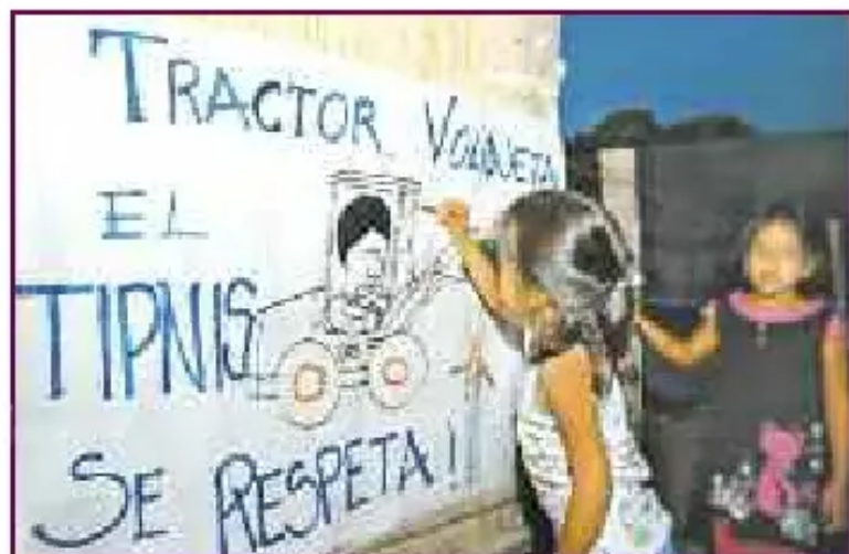
Totaizal: Una niña pinta el dibujo de una pancarta en la que se rechaza la construcción de un camino por el TIPNIS. (28 agosto 2011)