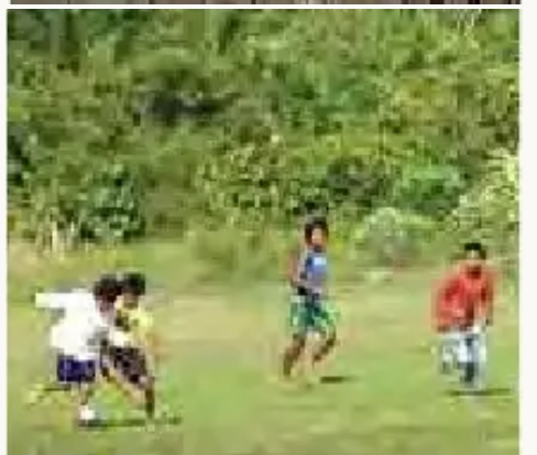
"Estamos jugando un partido de fútbol, somos de la comunidad San Pablo del TIPNIS".