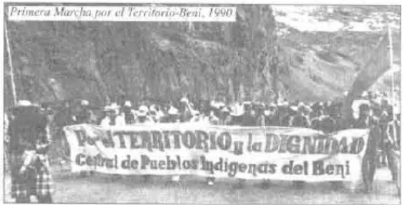
Primera Marcha por el Territorio-Beni, 1990

Tenemos procesos de trámite de TCOs que indudablemente son importantes extensiones aunque sean áridas. Esta es una propuesta que haremos respetar en este Congreso. A nuestra Región no llegó la Reforma Agraria del '52, por lo tanto no tenemos Títulos Ejecutoriales, pero dar un paso es la seguridad jurídica hacia el territorio son las Tierras Comunitarias de Origen."