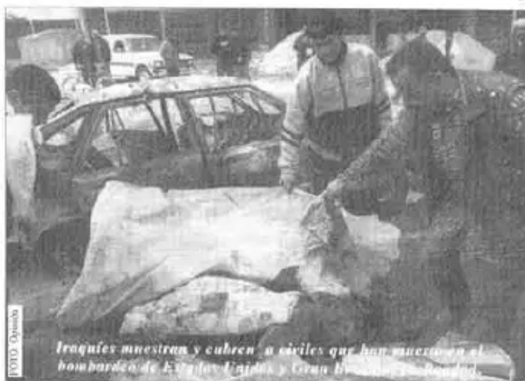
Iraquíes muestran y cubren a civiles que han muerto en el bombardeo de Estados Unidos y Gran Bretaña en Bagdad.

Lunes, 24 de marzo.- Los aliados lanzan un ataque a Nasiriya.