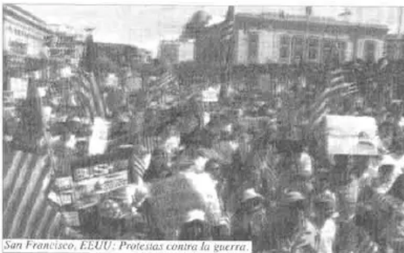
San Francisco, EEUU: Protestas contra la guerra.

Los inversionistas abiertamente predicen que una vez que la privatización se enmace en Irak, otros países como Irán, Arabia Saudita y Kuwait se verán forzados a privatizar su petróleo para poder competir.