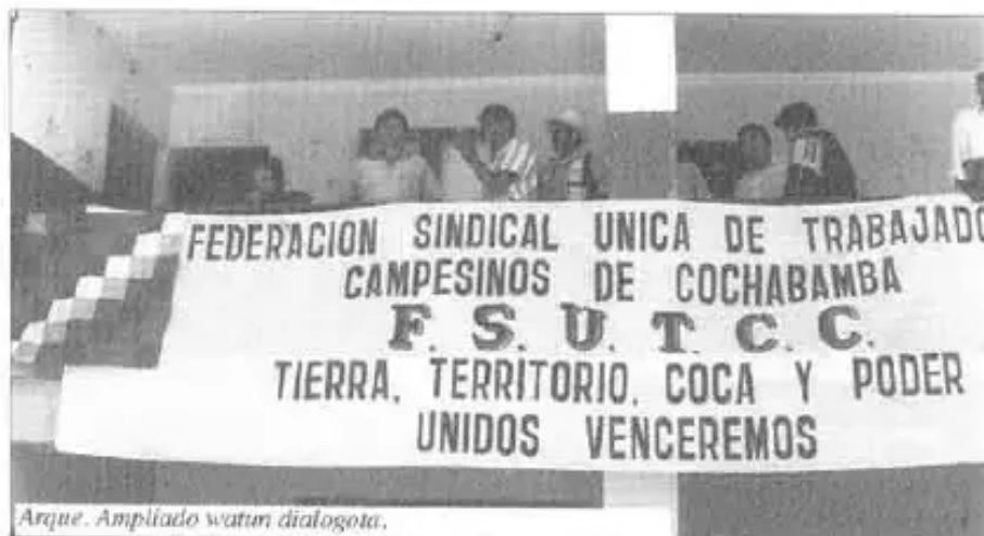
Arque. Ampliado watin dialogota.

F. Vegamonte nillaraqataq, “700 mil hectáreasta jaywachkanku chayratu Asociación de Sociedades Locales (ASLs) nisqaman; campesinospaq, indígenaspaqtaq mana kanchu”.