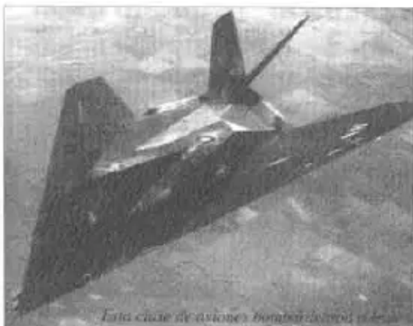
Esta ciudad de asirios bombardeada por EEUU.