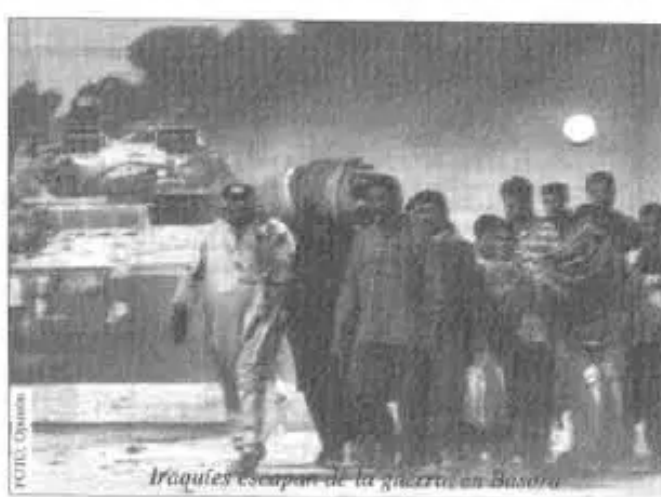
Iraquíes escapan de la guerra en Basora.