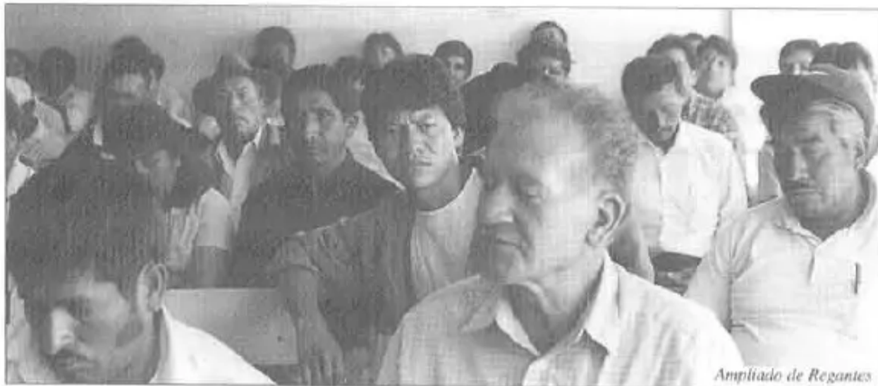
Ampliado de Regantes