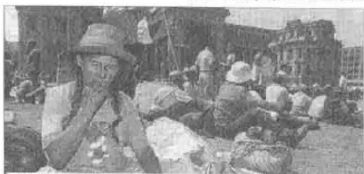
Productores de coca en Lima exigen respeto a la Hoja de Coca