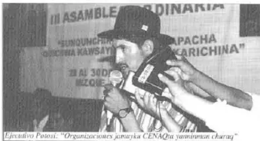
Ejecutivo Potosí: “Organizaciones jamuyka CENAQta yanninman churayq”

AMPLIADO EDUCATIVO DEL NUCLEO BETA RAQAYPANPA-COCHABAMBA