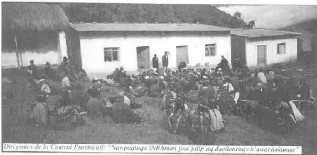
Dirigentes de la Central Provincial: “Nawpaqtaq INRAMan jina jallp’aq dueñonraq ch’uwachakunqa”

Por último, adjunto de dicho document conformidad, firmat