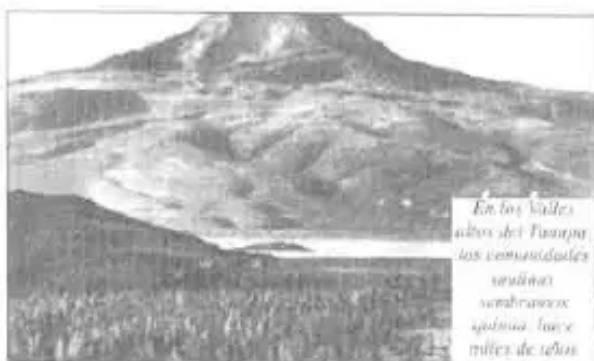
En los valles altos del Tiwanaku las comunidades campesinas sembraron quinua hace miles de años.