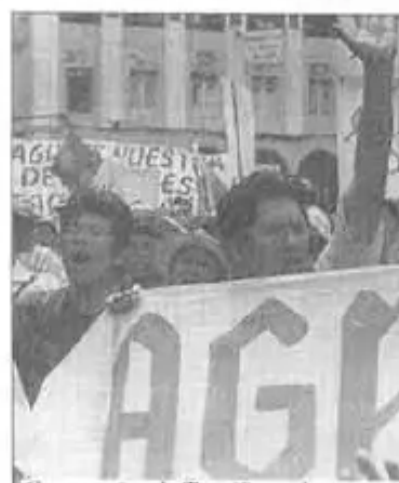
Comunarios de Taquiña reclaman por agua y tierras

tiene planta de tratamiento de aguas servidas, nos larga aguas contaminadas a nuestros cultivos. Hemos pedido, denunciado a la Prefectura, pero no dice nada. Por todo eso se ha levantado la comunidad, los dueños, los propietarios legítimos, reclamando sus derechos sobre las aguas y sus derechos de las tierras colectivas fueron dotadas de reforma Agraria".