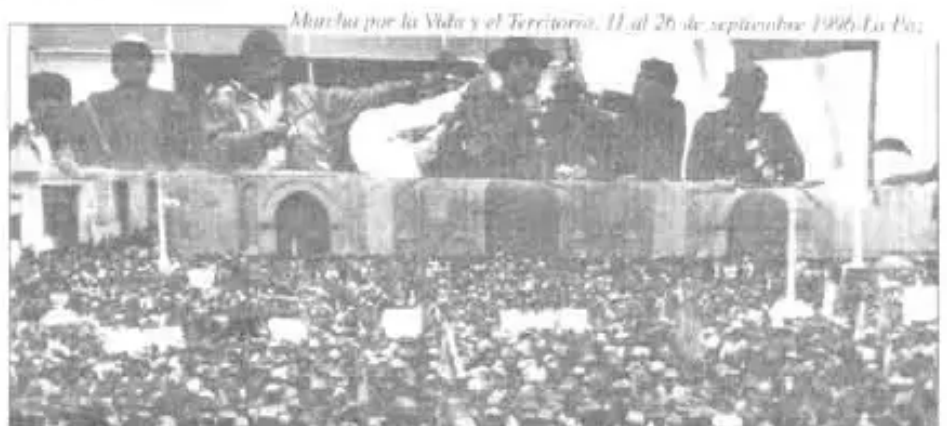
Marcha por la Vida y el Territorio, 11 al 26 de septiembre 1996-La Paz