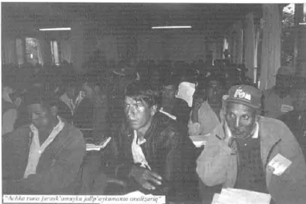
"Achka runa jurayk'umayka jallp'aykunanta analizariq"

Villa Vintopi, marzo (4 p'anchaypi) Central Regional Altamachipi uk ampliado rawakuspa kallarpataq, chayman chimpaykuspa karqanku iskay pachaq delegados, achkha subcentrales, warmi organizaciones, alcaldes comunales, corregidores, agentes municipales, invitados, institución CENDA, CETEFOR, CIDEDER; Concejales municipales ima.