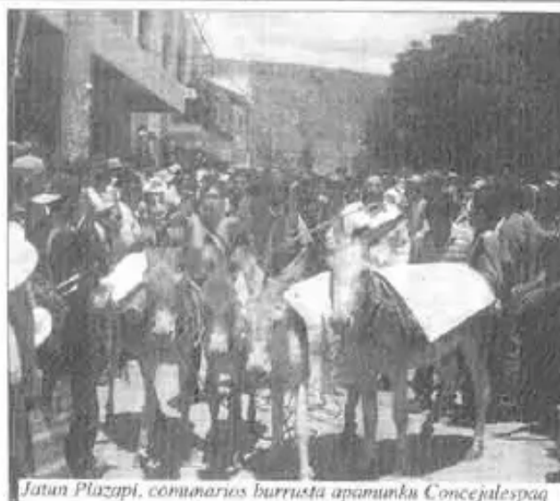
Jatun Plazapi, comunarios burrasta apamunku Concejalespaq