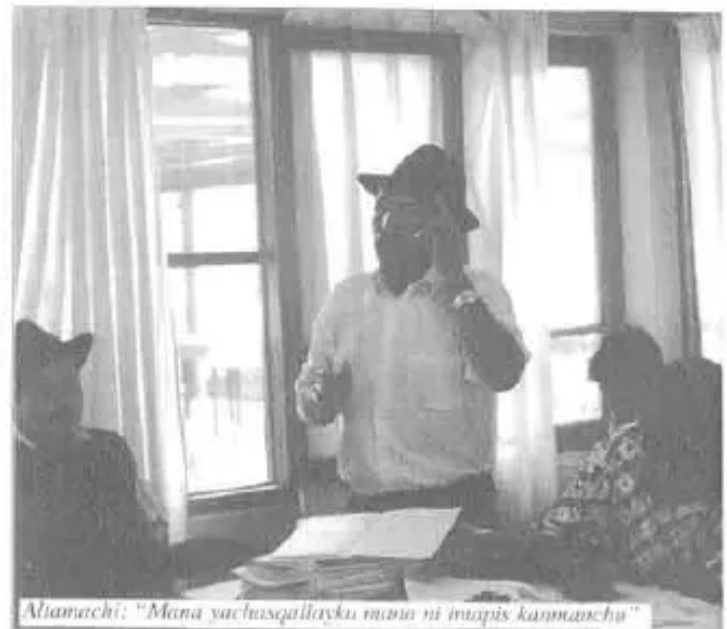
Altamachi: “Mana yachusqallayku mana ni inapís kanmanchu”

Nillantaq: -orden cumplichinankupaq kanqa