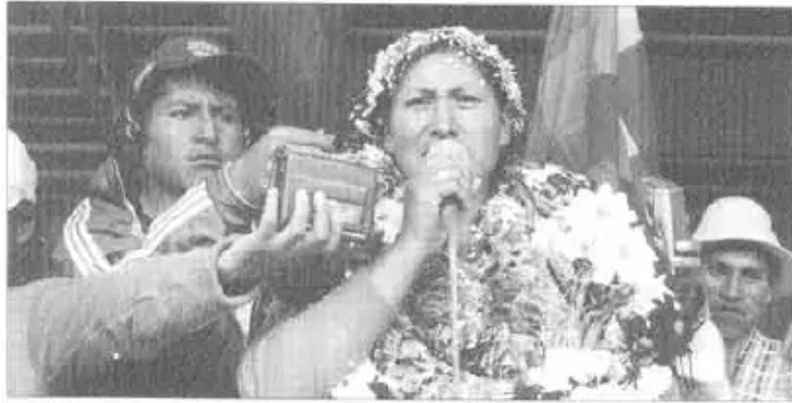
Isabel Domínguez nin: “Ministra Moira Paz, jallp’amanta sut’inchayta mana munanchu”

18, 19 marzo 2003 p’unchaykuna Santa Cruz Ilaqtapi uk tantakuy ruwakuspa karqa, Moira Paz Ministra de Desarrollo Sostenible y Planificaciónmanta, Estado Mayor del Pueblo nisqakunawan ima, jallp’amanta parlanapaq. Pasaq gobierno uk decretopi nirqa, 3.8 millones hectáreas Estadoqta jallp’a tiyan, kaytaq llulla kasqa, ‘pasaq gobiernoga manchayllawan firmarqa’ nisqanku. Phisqa pachaq waranqa hectáreas jallp’allaña kanman kasqa.