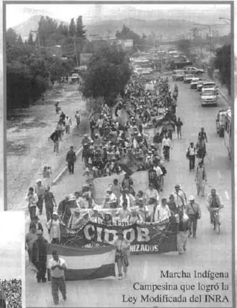
Marcha Indígena Campesina que logró la Ley Modificada del INRA

"Empezaron con lo de los dos tercios, ahora con autonomía de facto. En un Estado de derecho no hay autonomía de facto. Quieren crear un gobierno autónomo de facto y aplastar al gobierno de Evo, crear un gobierno paralelo en Santa Cruz, trasladar la capital del país a Santa Cruz como lo planearon cuando cayó el Goni en octubre del 2003. La Asamblea Constituyente ya incorporó como comisión a las autonomías, y eso significa incorporar dentro del tratamiento la propuesta de los cuatro departamentos que propusieron el Sí. No tienen excusas ni argumentos para hacer su huelga de hambre y para conspirar contra el proceso constituyente", dijo un constituyente.