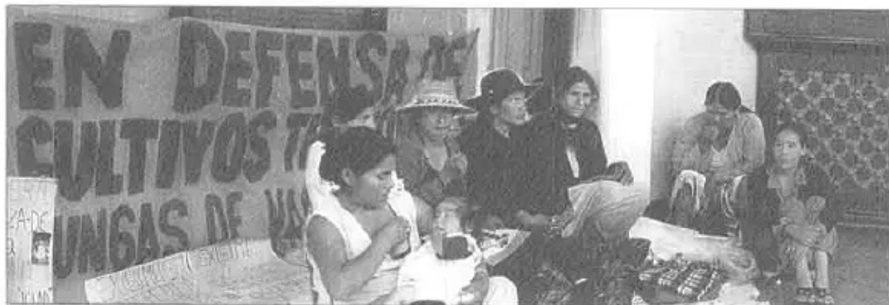
Línea, 23 de octubre de 2006