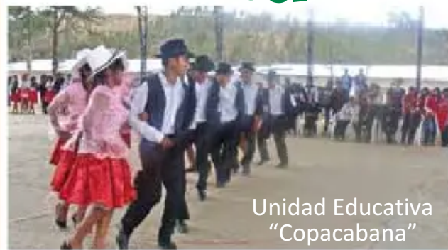
Unidad Educativa "Copacabana"