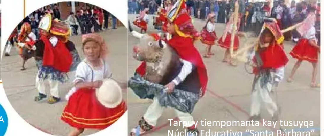
Tarpy tiempomanta kay tusuyqa Núcleo Educativo "Santa Bárbara"