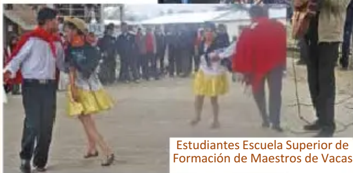
Estudiantes Escuela Superior de Formación de Maestros de Vacas