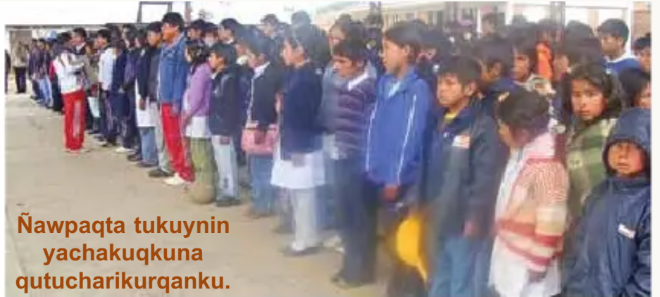
Ñawpaqta tukuynin yachakuqkuna qutucharikurqanku.

Núcleo Challacava chiqaman rirqani, Festival karqa, may jinata tusurikurqanku. Tukuynin Distritosmanta chinparimurqanku. Pachi nina yachachiqkunata. Mikhurikunaykama, qhawarikyichik.