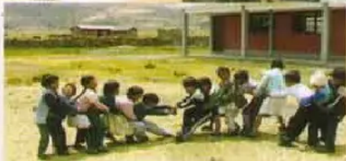
"Qullpa Qucha-Vacas comunidadapi wawakuna sik'i, sik'i puqllarichkanku"