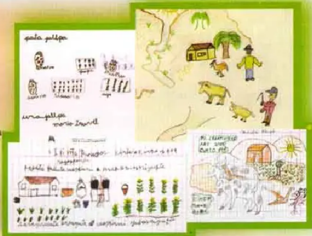
"Añaskitu" p'anqata wawakuna, yachachiqninwan Central Regional Coloradopi ñawichkanku.

Wawapis wawa kayninwan riqsinan tiyan, imaynataq kawsaynin, yachayninta pataman uqharinan tiyan, ima ch'ampaykunataq kachkan, ima llakiykunataq jamuchkan, chay tukuyta qhawarinan tiyan.