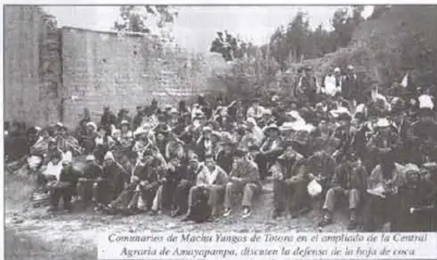
Comunarios de Machu Yungas de Totora en el ampliado de la Central Agraria de Amayapampa, discuten la defensa de la hoja de coca

Los cocaleros del país determinaron iniciar una Campaña de Revalorización en base a argumentos científicos, sociopolíticos y jurídicos para asegurar el retiro de la coca de la lista de la Convención Única de Estupefacientes. Bajo ese criterio exigirán la publicación de los resultados de un estudio realizado por la OMS acerca de la coca. Así como pedir el retiro del nombre de la firma Coca Cola, la respuesta que pueda dar esta multinacional será clave para el reclamo ante la ONU, aseguraron.