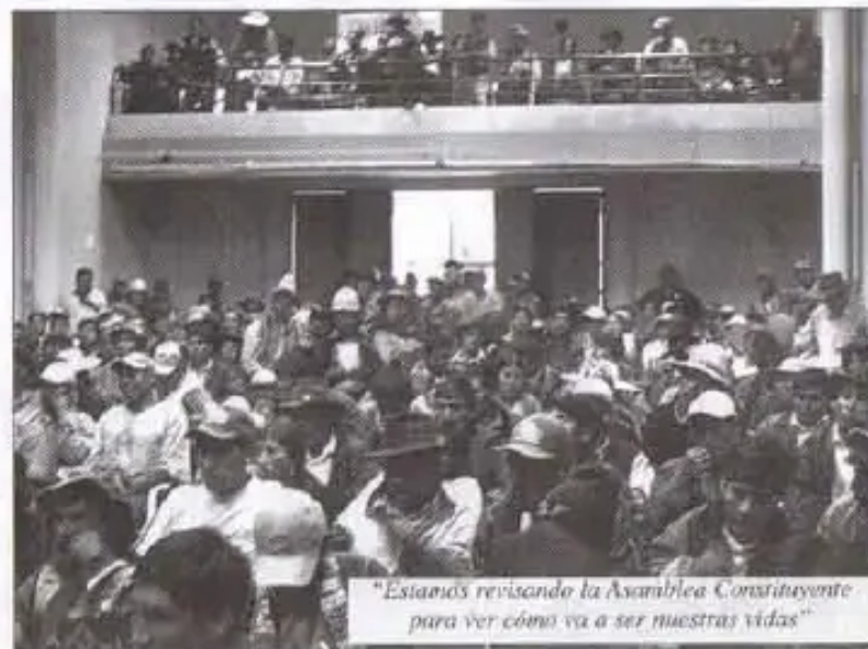
"Estamos revisando la Asamblea Constituyente para ver cómo va a ser nuestras vidas"

"Las autonomías vienen desde la comunidad, desde la practica misma que ejercen. Y la Constitución Política del Estado actual no respeta ni valora".