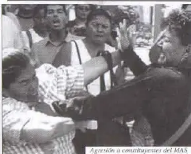
Agresión a constituyentes del MAS