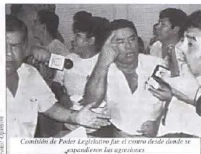
Comisión de Poder Legislativo fue el centro desde donde se expandieron las agresiones

"Las agresiones están demás, si pidieron propuestas eso tenía que haber pasado, no entiendo por qué dejaron que pase eso, yo creo eso está mal de parte de la gente."