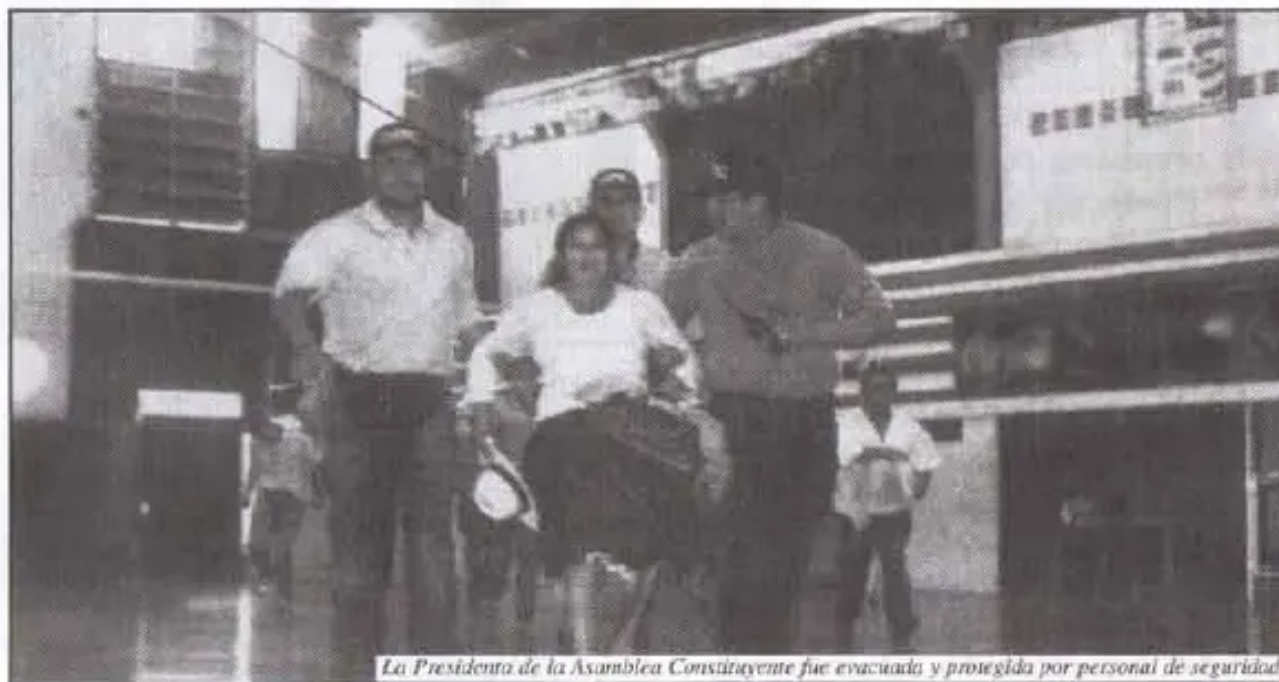
La Presidenta de la Asamblea Constituyente fue evacuada y protegida por personal de seguridad

"Lamentamos mucho la intolerancia que realmente tienen ciertos grupos de poder en Santa Cruz. Denunciamos de manera categórica, con todas nuestras fuerzas y repudiamos esta actitud cobarde de los señores del Comité Cívico Pro Santa Cruz con su brazo operativo, la Unión Juvenil Cruceñista han instado a la violencia. Con solamente nosotros participar como pueblos indígenas y demostrar que tenemos Propuesta al País. No podemos tolerar esta situación de discriminación racial. Por el hecho de vestir nuestra propia vestimenta nos están discriminando, eso no puede permitirse ni aquí ni en ningún lugar del mundo".