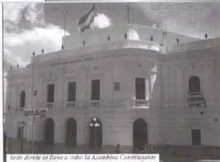
Sede donde se lleva a cabo la Asamblea Constituyente

(Pablo Ortiz, Santa Cruz, El Deber, 8 de abril 2007)