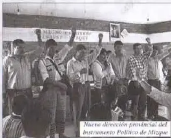
Nueva dirección provincial del Instrumento Político de Mizque

Subcentral Tin Tinpi seminario INRA departamentalwan ruwakunan kasqa, INRA mana chayasqachu, uk 200 participantes suyasqanku. Seminario periódico “Conosur Nawpaqman” karqa, (kay jallp’asta, ima laya saneamiento ruwaykuman? nispa tapukurqanku. Tapuykuna: “Central Regional jina saneamiento TCO atiykumanchu ruwayta? • Saneamiento TCOpi derechoyku, usos y costumbres respetasqachu kanqa, manachu? • “Saneamiento individualwan derecho pastoreo kapuwaykumanchu manachu? • Manachu montesninchikta Parques nispa declarayta atinkuman? • Título TCOwan nuqanchik dueñollapuni kasun? • Wawasninchik herencia jap’iyta atillanqapunchu?”