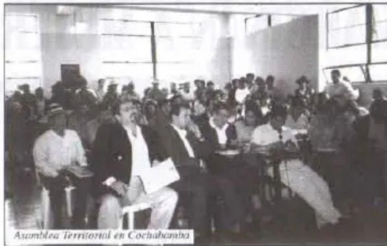
Asamblea Territorial en Cochabamba

• Todos los recursos naturales renovables y no renovables son de propiedad del Estado Plurinacional. Garantizar, regular y proteger el uso sostenible de los recursos naturales renovables y no renovables, a los pueblos originarios, indígenas y campesinos.