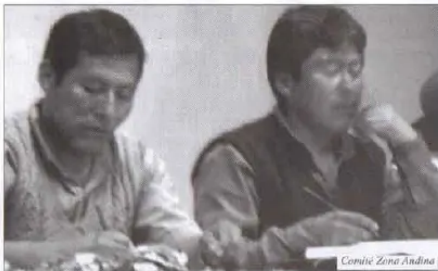
Comité Zona Andina