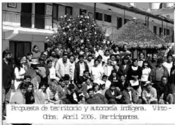
Propuesta de territorio y autonomía indígena. Virto - Cba, Abril 2006. Participantes.

"Al CEFOPA los jóvenes son enviados de sus sindicatos, sindicatos bajo compromiso con las organizaciones sindicales. Cuando egresan bachilleres vuelven a sus comunidades para ser líderes y ayudar a sus dirigentes. También son parte del equipo técnico del futuro Municipio Indígena, para no depender de técnicos externos que no conocen nuestra cultura".