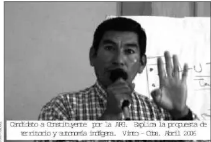
Crédito a Constituyente por la AIG. Réplica la propuesta de territorio y autonomía indígena. Virto - Cba, Abril 2006

• Tienen derecho a las tierras y al territorio que ocupan históricamente, entendiendo el territorio como la totalidad del hábitat y de los recursos naturales renovables y no renovables.