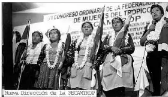
Nueva Dirección de La FECAMTROP

• Se pide licencias de comercialización: 2 por sindicato, uno para mujer y otro para el hombre.