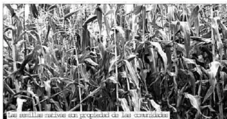
Las semillas nativas son propiedad de las comunidades

En octubre de 2005 organizaciones de la sociedad civil se dirigieron a la Ministra para recomendar que: La región andina en su conjunto, es centro de diversidad de este cultivo; incluso para algunos investigadores, el centro de origen sería la zona chaqueña de Bolivia-Paraguay, por la presencia de maíces tunizados.