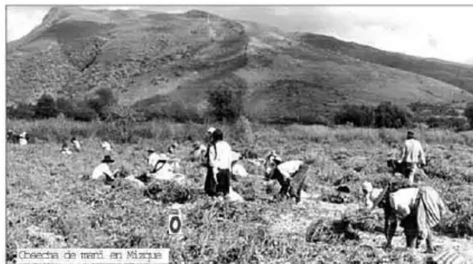
Cosecha de mani en Mizque