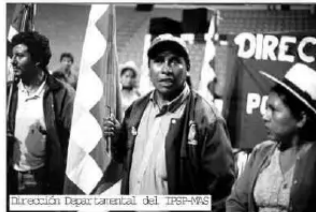
Dirección Departamental del IPSP-MAS

"Chapaq runaswan manaña humillachikusunmanchu, nuchichikpatapis tiyan derechonchik orientaran yaykunapaq. Chay chapaq runakuna nichkanku pasaportewan yaykunachikta, q'uffi t'anata jina suyekuchunku".