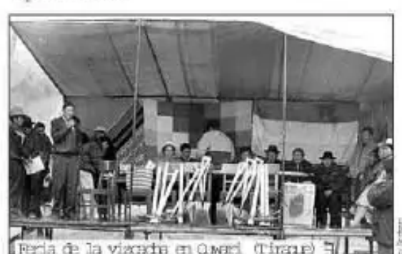
Feria de la vizcacha en Quwari (Tiraque)

Papa q'umirllaraq kachkan, ñapis qhuru papaman yaykupunña, mufata churayku, q'apaynin khunta kanunchan, manapuni sayachiptin sik'imirata apayku wayaspi, chayta kachaykuyku, q'alitu khurichustaga mikhekupun, ajinata campipi nuwayku, puquniyku aswan sumaq kanapay".