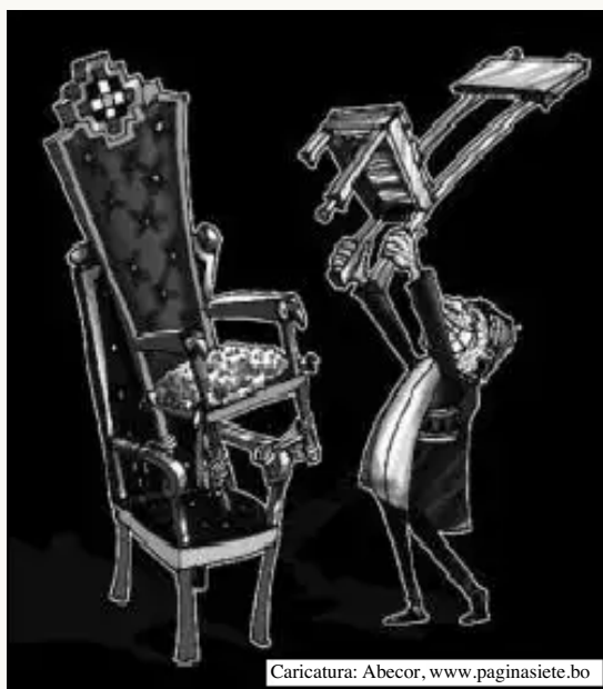
Caricatura: Abecor, www.paginasiete.bo

El pasado 15 de mayo, la Cámara de Diputados aprobó, por mayoría simple, la Ley de Aplicación Normativa. El lunes 20 de mayo, el presidente en