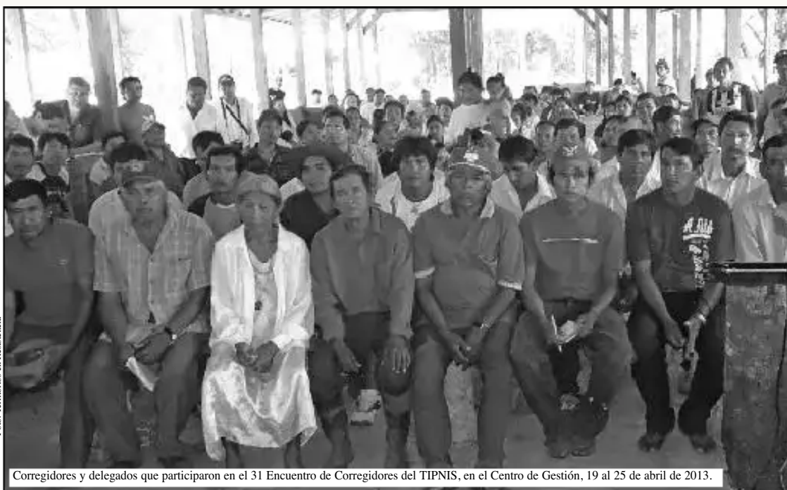
Corregidores y delegados que participaron en el 31 Encuentro de Corregidores del TIPNIS, en el Centro de Gestión, 19 al 25 de abril de 2013.

Dirigentes y comunarios de base del TIPNIS decidieron realizar una marcha internacional para hacer conocer su rechazo a la construcción de la carretera por medio de su territorio y la vulneración de sus derechos. Esta fue una de las conclusiones a las que llegó el 31 Encuentro Ordinario de Corregidores del Territorio Indígena Parque Nacional Isiboro Sécore (TIPNIS), realizado en el Centro de Gestión, del 19 al 25 de abril del presente año.