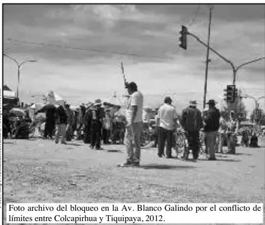
Foto archivo del bloqueo en la Av. Blanco Galindo por el conflicto de límites entre Colcapirhua y Tiquipaya, 2012.

Proceso Judicial, los acuerdos alcanzados en la conciliación interdepartamental dan lugar a la demarcación definitiva de límites. Pero en caso de existir tramos no conciliados, el ministerio emite resolución de áreas en conflicto, enviando al Tribunal Supremo de Justicia para que esta instancia judicial conozca y resuelva el área de conflicto (Arts. 46,47, 50 y 52 LDUT).