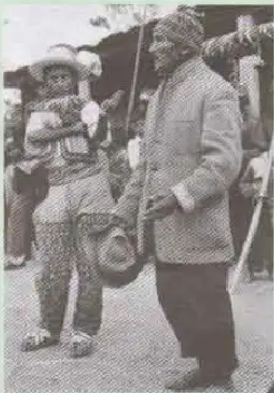
Jatun machu runa yachayninta wawaman willarichkan