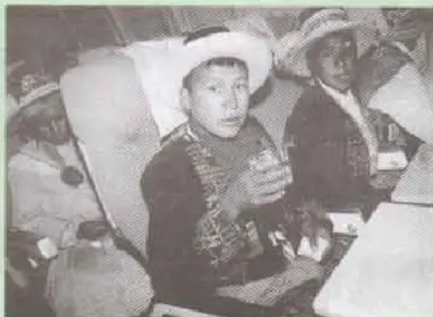
Avionpi mana qunqanapaq jina phawayku