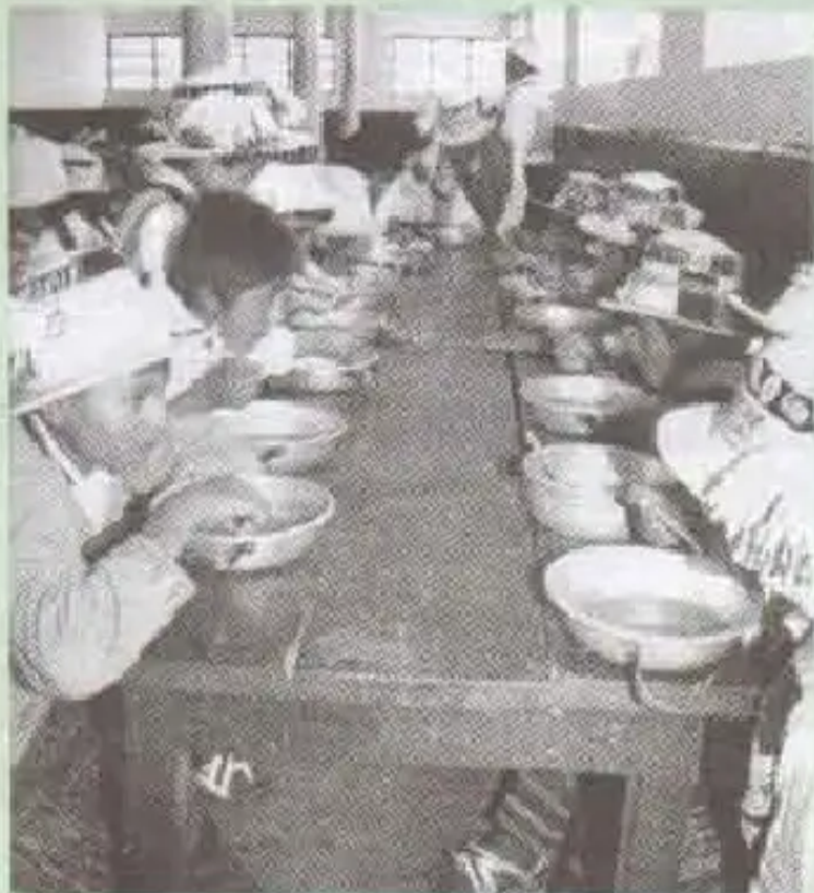
Uk p'unchay cuarte CITEpi soldaduswan khuchka mikhuraoyku

Comandante CITEman, militares ima slichita yanapawarqanchik. Chaypi sapa ch'isi puñukurqanchik. Comunidad campesinata allin sunquwan jap'irqanchik.