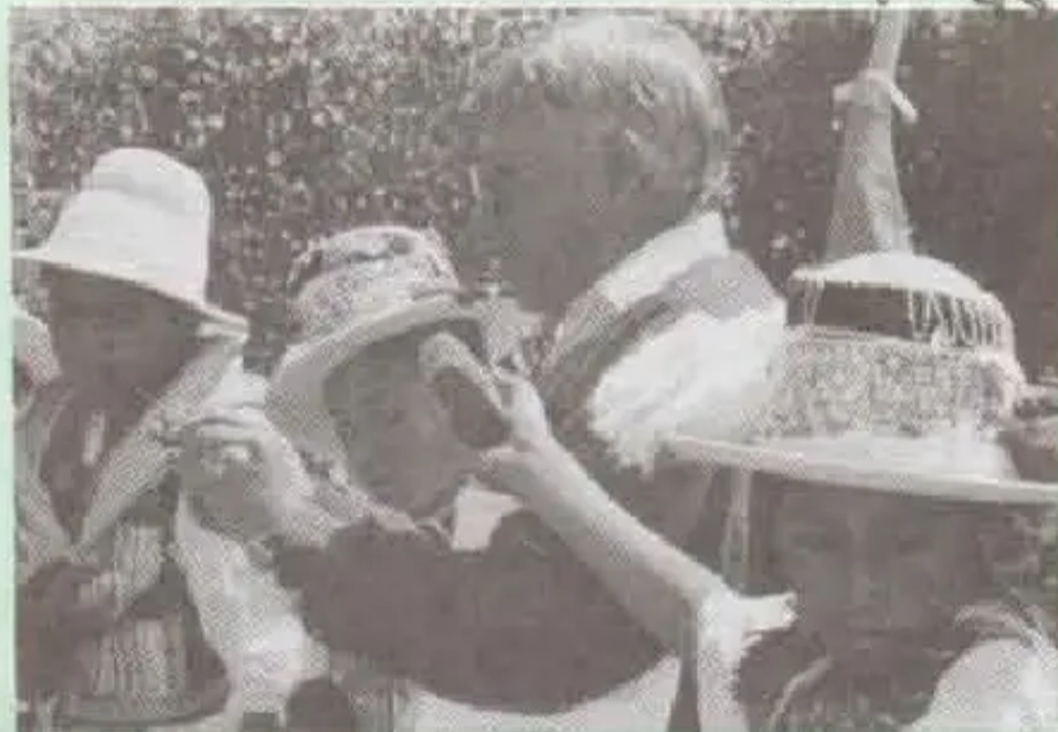
Escuela Técnica de Forestación (ETSFOR) askha uña sachakunata churaq kachka

Universidadmanta ¿Imatawanraq yachankiri?