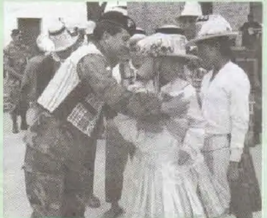
Segundo Comandante man Raqaypampa Raqaypampa culturata saqirqanku

Viernes p'unchaypi mayku, Oaxapampa cuartel CITEman, chaypi yacharichimuyku porocac dista platayemomanta phall'omuyta amana kuyku.