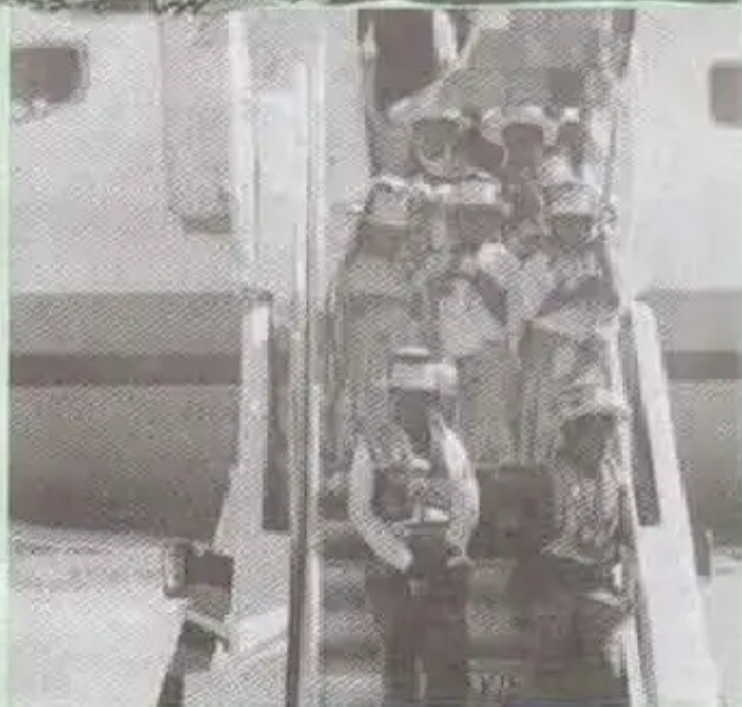
Wiphala ucharisqa, avionmanta urayk' amuyku. Puriyniykupi ahapariyku "Iqhallala Raqaypanpai, Iqhallala Lloyd Aero Boliviano! nispa"

Sucreman 36 minutospi chayayku. Chaypi talasniyku aeropuerto Adela Zamudiopi kachkasqanku, chay manta Casa Libertad man riyku. Chay manta riku riyku biblioteca casta. Chay guerra de la Independencia pi, pis kurachus tinkurganku, chonta pikunachus gillgarganku. May Jatun wasi kasqa. Silla pi may k'achilu kasqa, ñawpaq chukunas kaykunasa.