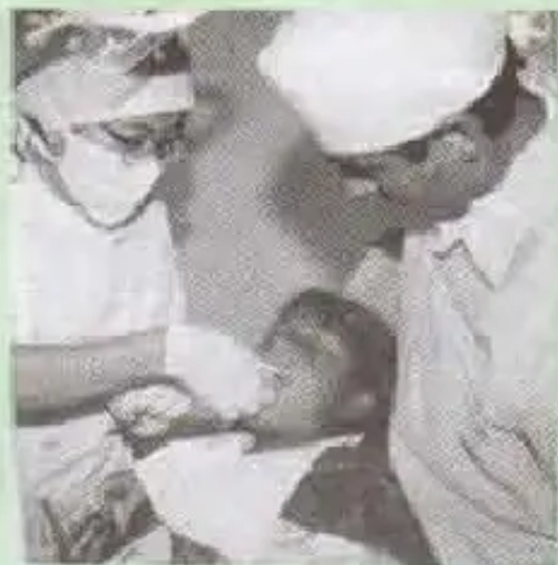
Kirukuna jampiytawan, kiru maylakunapda jampita auwarqayku