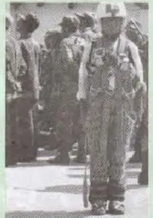
Wowakuna paracaidaspi totremanta pacha ch'uqakamurqanku

Humap's mama aympachi p'ampay kangandak ichhumaanta kamastata chaypi p'ampomku hu.