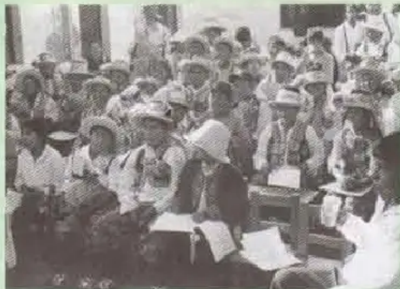
Viernes 4 de septiembre, p'unchay DNIwan karqanchik.

¡Astawan kay kawsaymanta ch'aqwarispa qillqarimuy! ¡Añaskitumantaq riqsiqhimuy!