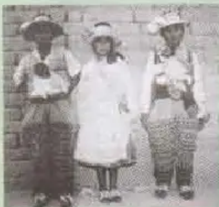
Escuela Runi Muqumanta

"Jinapuni p'achayku, kawsayniyku. Mana jamunallapaqchu churakuyku"