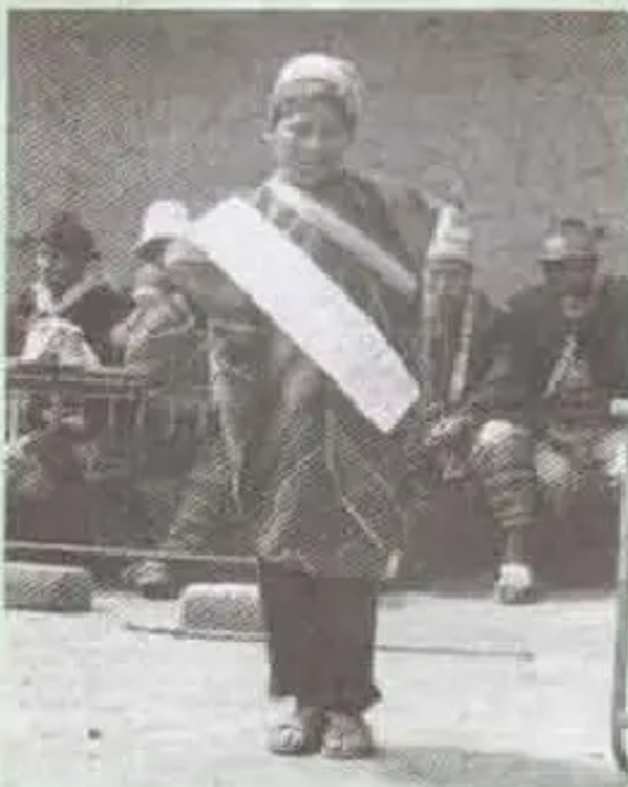
Kuyupayapi wawakuna jatun tantayta apaykachanku

Pugllaris pataq goma chikurqayku 2-1 ampa tarqay- ku, ur-ma mana walerqachu.