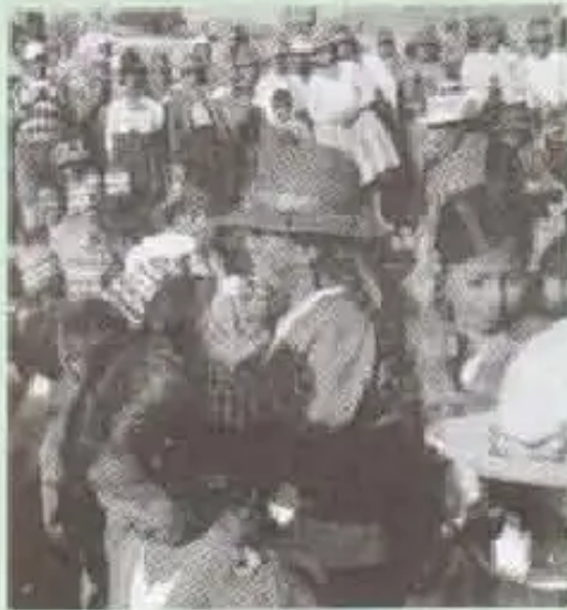
Puqykenasta chhalakupl jina jaywanakuraqayku