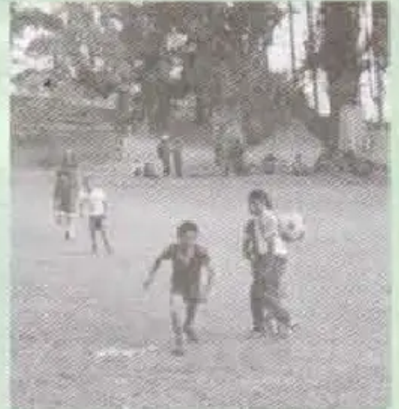
Sanipayamanta kookuna Raqaypampasta atipanku 1-0