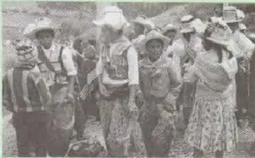
Yanpi, kuyupaya wawakuna jatun raymipi suyawayku

q'ayantin Kuyupayaman tiyku chaypiga wawas pura, machuspura ch'agwariyku, chaymanta pelotata Jay tariyku.