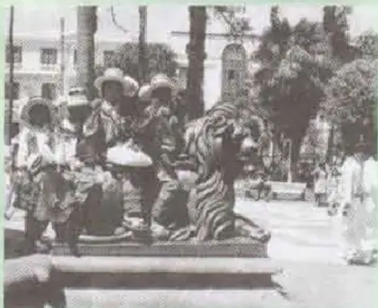
Sucre Ilaqta yuraqlla kasqa. Plazanpi jatun