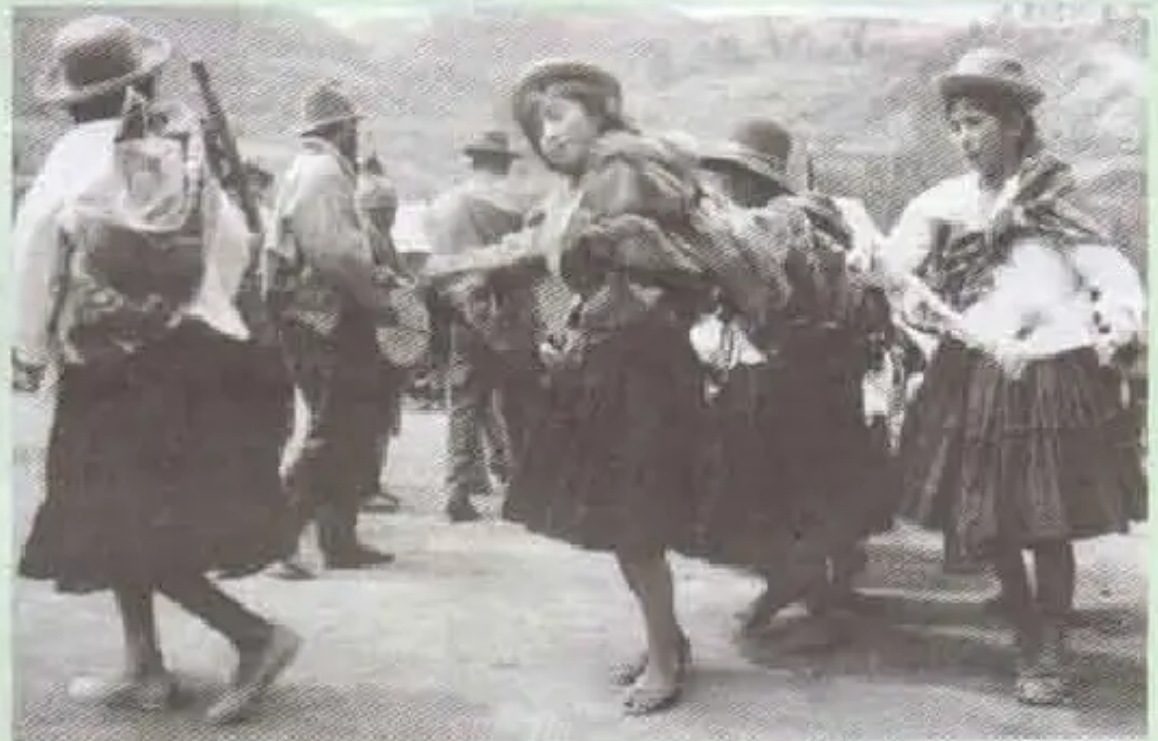
Kuyupaya cultura tusuyhinkupi rikisichinku.

Chay tusuyta waso cancha pi, Intee- cambio de productos cambiarirqayku pasqui chisqant'ara, saras, papas, frigos.