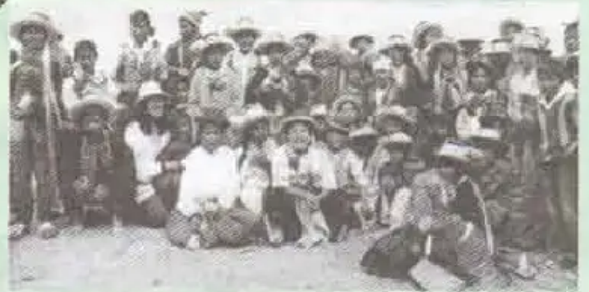
Kuyupamanta p'ochashinta churakuytawan ch'agwariyku