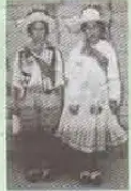
Escuela Mizque Pomocá