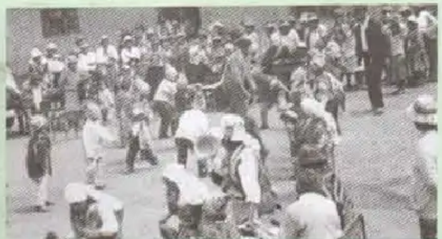
Añaskitu Kuyupaya wawakunawan khushka rinkuta tusuchinku

Chay manta plaza man riyku, hasta Independencia man riyku.