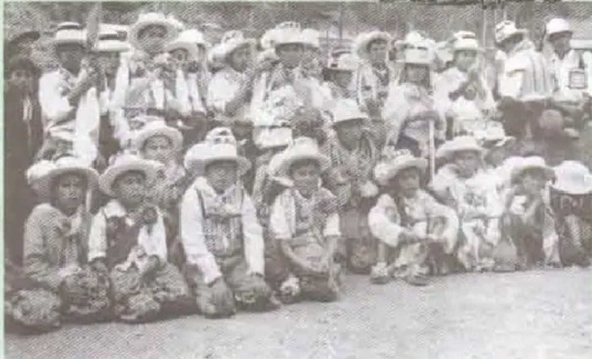
Sanipayaman yaykusapa qatuchakuraqanku