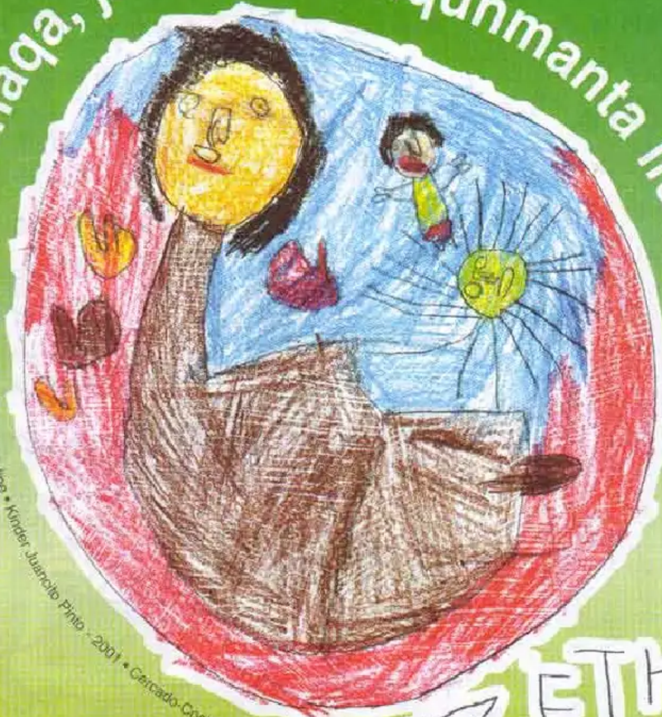
Dibujos de Lizet Feilbe • Kinder Juancito Pinto - 2001 • Cercado-Cochabamba

Wawakunaga, jallp'aq sunqunmanta lluskiyku