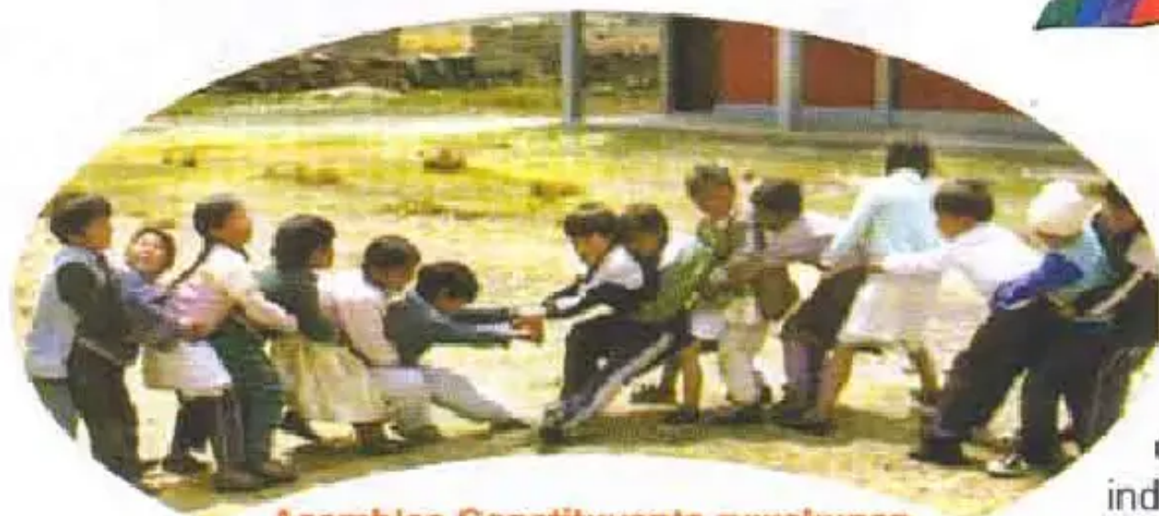
Asamblea Constituyente ruwakunan tiyan, mana atipachikusunmanchu

Pueblos Originarios, Indígenas, Campesinos imaraykutaq Asamblea Constituyente ruwakunanta munayku.