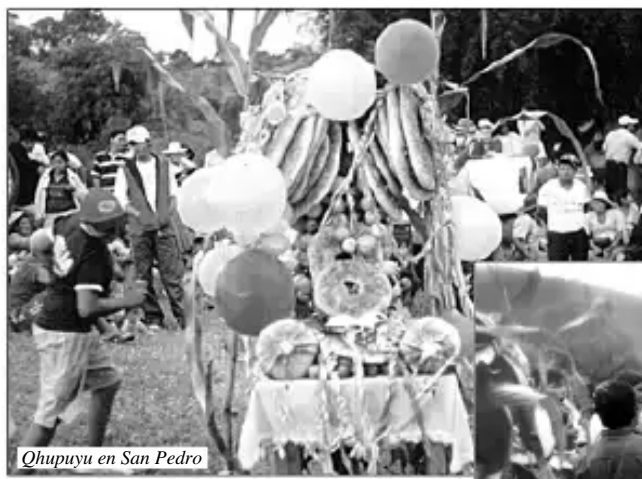
Qhupuyu en San Pedro

Willariwanchik, Nicómedes Pardo: “Qhupuyuqa costumbre, cultura mesaman pachamama puquchisqanta churayku, warapu runaman jaywarinapaq, mana pisinanchu tiyan, qhupuyumanqa comparsas chaymunku, paykunamanpis waraputa jaywarina. Mayqinchá kay qhupuyuta phaskanqa tukuyninta apakapunqa, watapaq payñaataq churamullanqataq”