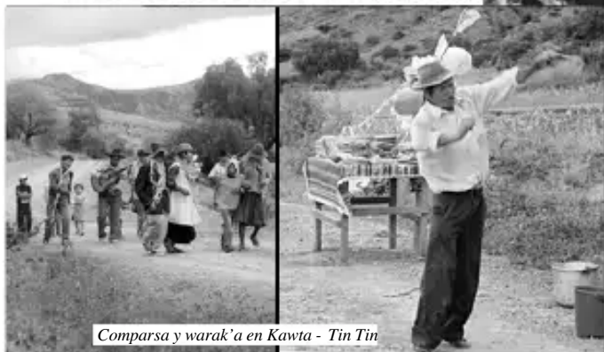
Comparsa y warak'a en Kawta - Tin Tin