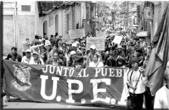
LA PAZ: Estudiantes de la UPE se unen al pueblo (Febrero 2008)

La propiedad de los recursos naturales es del Pueblo Boliviano y no solo del Estado o los indígenas (art. 349), los recursos básicos como la electricidad, agua, comunicación son reconocidos como un derecho humano. (NCPE)