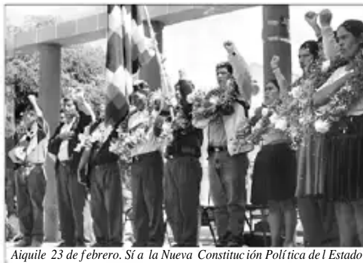
Aiquile 23 de febrero. Sí a la Nueva Constitución Política del Estado