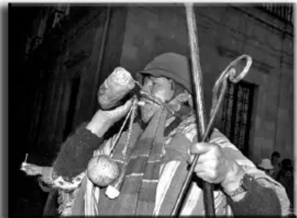
LA PAZ: Sectores sociales celebran la aprobación de la NCPE. (Febrero 2008)