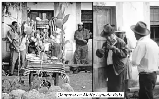
Qhupuyu en Molle Aguada Baja

Jaku, jaku nillawanki Duraznales, manzanales Mayllamantaq pusawanki Ay watakama carnavales.