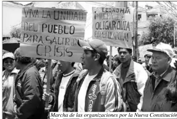
Marcha de las organizaciones por la Nueva Constitución

• A pesar de esto, se trata de un triunfo político de las organizaciones sociales, pues el texto constitucional se