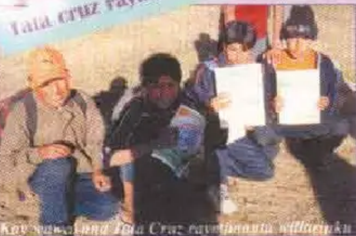
Kay wawakuna Tata Cruz raymimanta willariwanku.