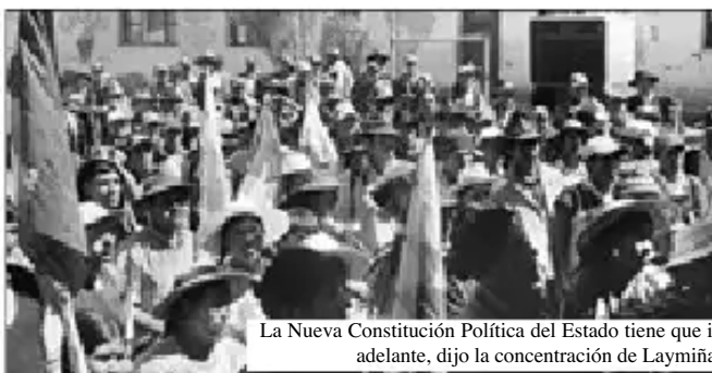
La Nueva Constitución Política del Estado tiene que ir adelante, dijo la concentración de Laymiña

• Instrumento Políticota uk runa iskay brazoyukta jina qhawani. Ukninbrazo partido político nuqanchikpaq partidonchik, colorniyuk, uk siglawan. Uknin brazontaq instrumento político , mayqinchus trabajo de base ruwachkanchik, concientización a nivel político, económico, social.... Jinamanta uk p'unchay nuqanchikpaq yuyayninchikwan gobiernoman chayanakama. (Román Loayza).