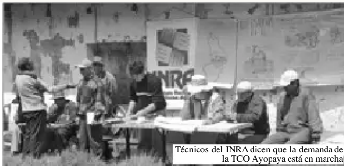
Técnicos del INRA dicen que la demanda de la TCO Ayopaya está en marcha