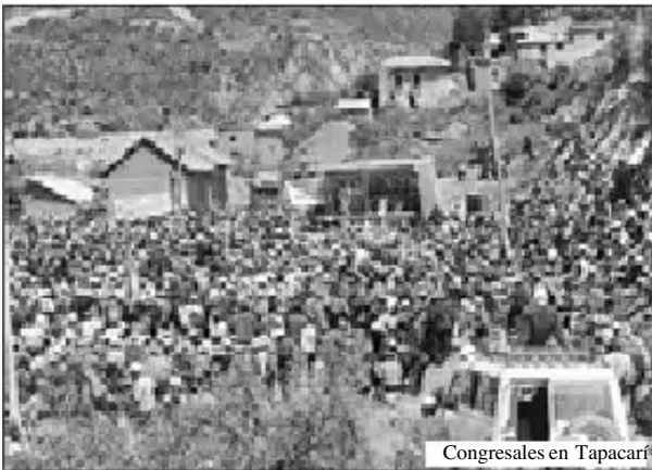
Congresales en Tapacari

Kay puntupi sut'ichana tiyan imaynapi mana churakurqachu TCO ruwakumanta provinciaspi?. Karqa Resolución XI° congresopi, Sacaba chiqapi ruwakusaptin. Kunallan Tarijapi Confederación Únicaq Congreson resolucioni nillantaq, gobierno TCOta usqayllata apananta tukuchaspa. Musuq Constituciónpi nisallantaq