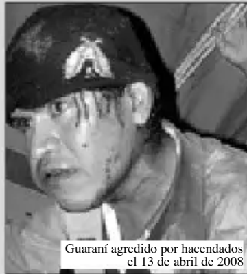
Guaraní agredido por hacendados el 13 de abril de 2008

Estas tierras fueron "dotadas" de manera ilegal, como favor político, durante alguna de las dictaduras. Los LARSEN tienen muy buenas relaciones con Branco Marincovik, Rubén Costas y con Gabriel Dabdoub, la trica de terratenientes usurpadores de territorio indígena, dirigentes cívicos, dirigentes empresariales.