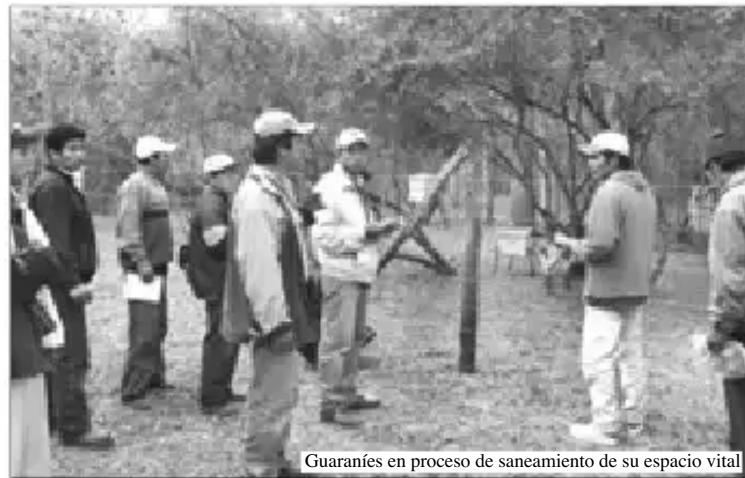
Guaraníes en proceso de saneamiento de su espacio vital