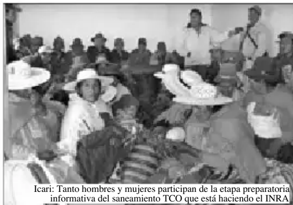
Icarí: Tanto hombres y mujeres participan de la etapa preparatoria informativa del saneamiento TCO que está haciendo el INRA

En los talleres de difusión hecho por los funcionarios del INRA en cada subcentral de las Centrales Regionales de Icarí, Altamachi, Choro, Cocapata, Calientes, las bases hicieron conocer sus dudas y han hecho preguntas como: ¿Quiénes son los terceros?, ¿a nombre de quién sale el Título?, ¿se entregarán títulos a cada afiliado?, ¿los títulos antiguos seguirán teniendo valor? y otros; concluido el taller firmaron Actas donde las bases de cada subcentral RATIFICARON SU VOLUNTAD DE HACER EL SANEAMIENTO DE TCO EN AYOPAYA.