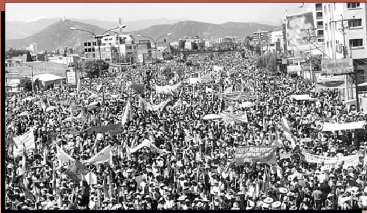
4 de Mayo, Cochabamba.

Concentración de medio millón de personas exigen el cumplimiento de la agenda 2003, mayo - junio 2005 y 18 de diciembre 2005: