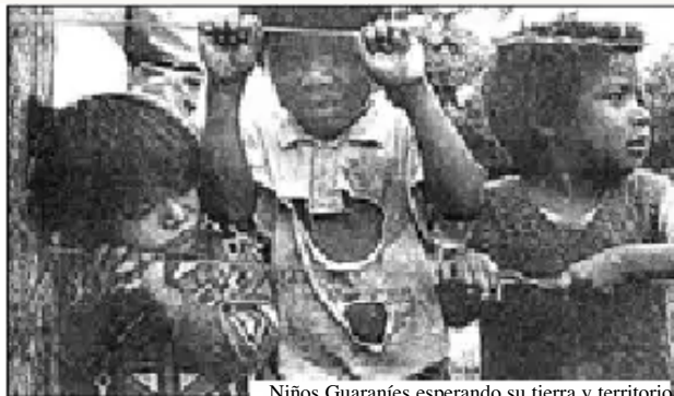
Niños Guaraníes esperando su tierra y territorio

Cuando los Larsen, a punta de pistola, secuestran al viceministro Almaraz en febrero, o cuando los ganaderos del Chaco atacan a la comitiva de guaraníes que acompañan a los técnicos del INRA, ahí el gobierno tenía la posibilidad de derrotar de manera significativa a los logieros del