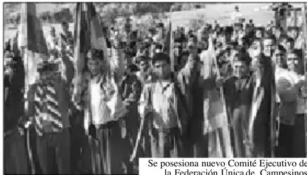
Se posesiona nuevo Comité Ejecutivo de la Federación Única de Campesinos