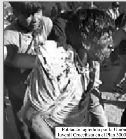
Población agredida por la Unión Juvenil Cruceñista en el Plan 3000

Firman más de 30 instituciones, fundaciones, medios de comunicación, centros de estudios, e iglesias evangélicas (3 de mayo 2008).