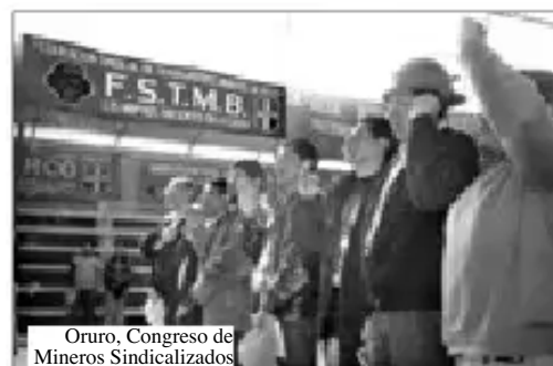
Oruro, Congreso de Mineros Sindicalizados

transnacionales y de empresarios locales de la minería se apoderaron en beneficio propio de más de cuatro mil millones de dólares, dejando socavones vacíos, mucha miseria en los pueblos del altiplano y sólo 90 millones de dólares en impuestos y regalías para el Estado.