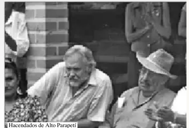
Hacendados de Alto Parapetí