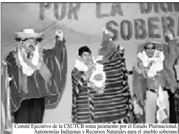
Comité Ejecutivo de la CSUTCB toma juramento por el Estado Plurinacional, Autonomías Indígenas y Recursos Naturales para el pueblo soberano