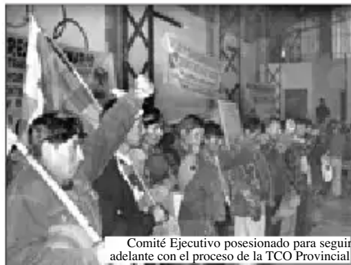
Comité Ejecutivo posesionado para seguir adelante con el proceso de la TCO Provincial