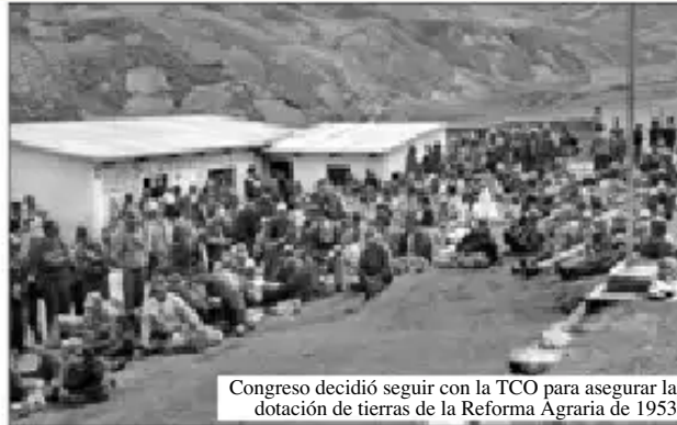
Congreso decidió seguir con la TCO para asegurar la dotación de tierras de la Reforma Agraria de 1953

• Las vicuñas que existen en el lugar deben ser protegidos por los comunarios del lugar para su posterior uso "racional" en beneficio de la Región.