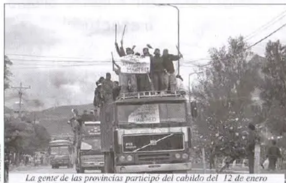
La gente de las provincias participó del cabildo del 12 de enero

Asamblea Permanente de Derechos Humanos de Cochabamba APDDHHOC Centro de Comunicación y Desarrollo Audiovisual CENDA Centro de Documentación e Información Bolivia CEDEB Centro Gandhi CEPRONI INCCA