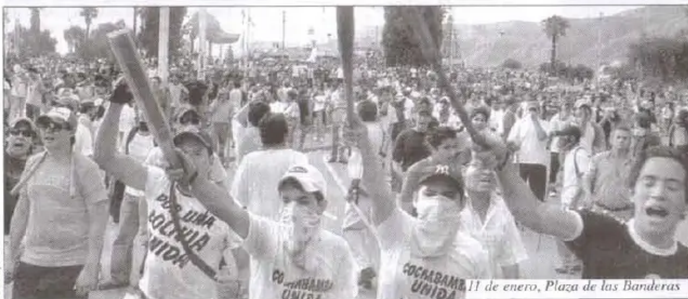
11 de enero, Plaza de las Banderas

La "marcha por la paz" con pañuelos blancos, banderas nacionales y armados de escudos, fierros, cadenas, palos en cuyas puntas habían fijado alambre de púas, cuchillos, clavos, y también armas de fuego, rompieron una débil barrera policial, y corrieron gritando hasta tomar el puente de Cala Cala, donde estaban unos 1.000 cocaleros que retrocedieron. Luego ingresaron al prado donde estaban los movimientos sociales la mayoría cocaleros y campesinos, ancianos, mujeres y niños.