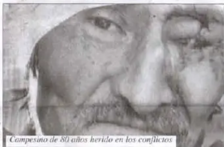
Campesino de 80 años herido en los conflictos