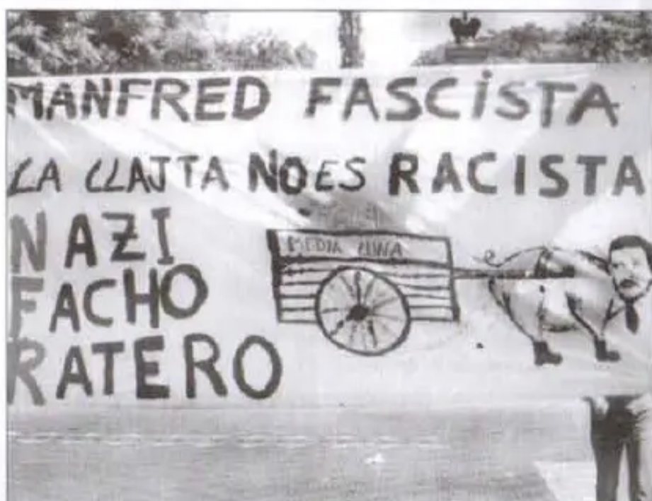
Uno de los cartelones que portaba la gente movilizada frente a la violencia racista sucedida en los primeros días de conflicto prefectural en enero

El original conserva las firmas y sellos.