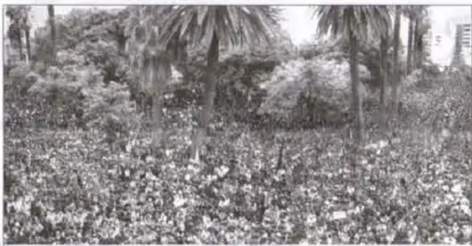
Masiva concentración de la gente que desconocía al Prefecto por completo después de los hechos trágicos del 11 de enero

Representante de la FUL: "Los universitarios hemos estado en todas las movilizaciones, todas las organizaciones quieren una sola cosa concreta, se han movilizadado 3 semanas para sacar a Manfred Reyes Villa y elegir un nuevo gobierno departamental a la cabeza de todas las organizaciones sociales, es lo único que piden. Punto concreto es: • Que se vaya Manfred Reyes Villa y que se conforme un nuevo cuerpo prefectural, no sólo de una persona, sino a la cabeza de todas las organizaciones".