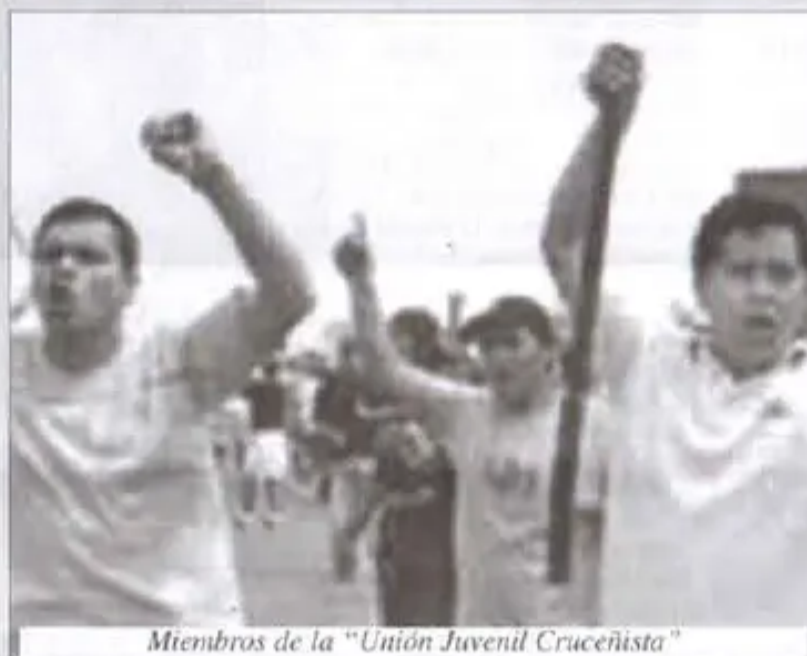
Miembros de la “Unión Juvenil Cruceña”

Las agresiones del 15 de diciembre, son una más que sufre nuestro pueblo, solo que en esta ocasión se está utilizando el argumento de “autonomía al andar”, que en realidad, es una anonimía para pisotear los derechos de los pueblos indígenas.