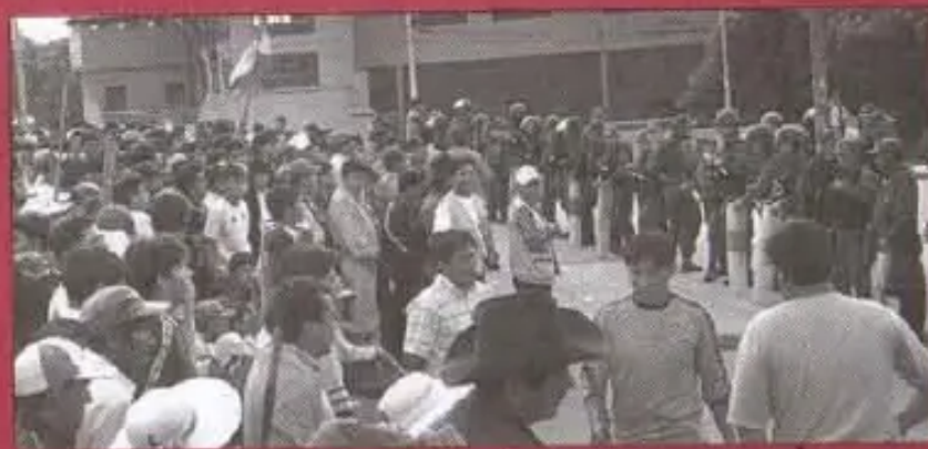
Plaza de las Banderas: Organizaciones sociales antes de ser apaleadas el 11 de Enero