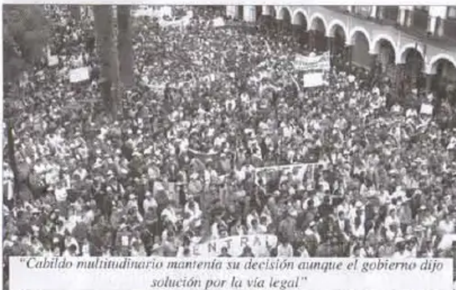
“Cabildo multitudinario mantenía su decisión aunque el gobierno dijo solución por la vía legal”

Otro manifestante: “En primer lugar el Cabildo ha desconocido a Manfred Reyes Villa como prefecto de Cochabamba; en segundo lugar aquí estamos decidiendo constituir nuestro propio gobierno prefectural en Cochabamba, que pueda tener el formato de un comando revolucionario político con todos los sectores movilizados a su cabeza”.