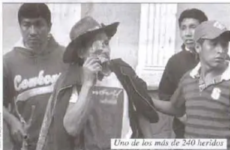
Uno de los más de 240 heridos