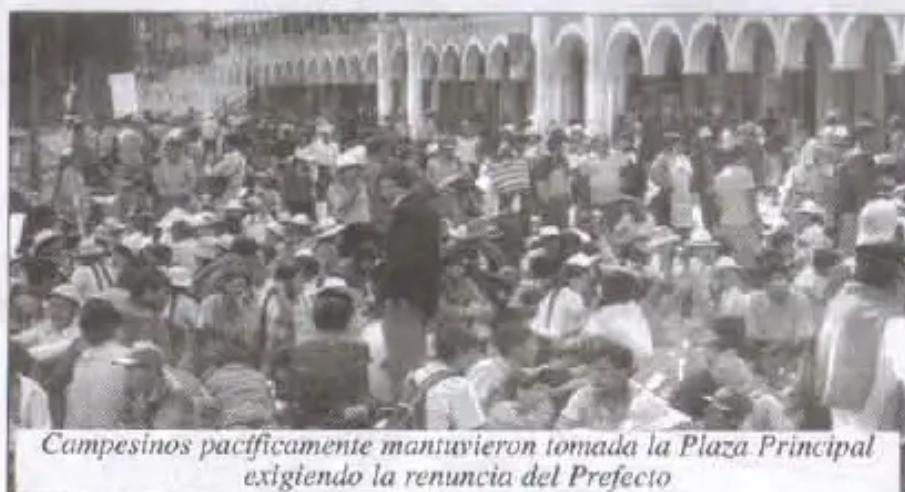
Campesinos pacíficamente mantuvieron tomada la Plaza Principal exigiendo la renuncia del Prefecto

En esta concentración Reyes Villa dijo “adelante Santa Cruz y su independencia”. La “Media Luna” conformada por los grupos de la oligarquía boliviana, en los hechos ya ha formado un gobierno paralelo al de Evo Morales, la Junta Autonómica Nacional en una clara actitud sediciosa en contra de la Constitución Política y las Leyes del país.