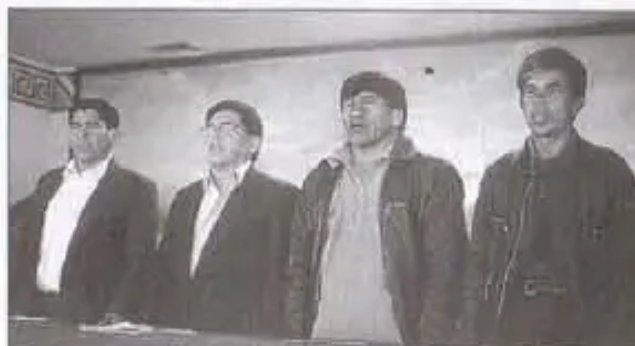
Directivos del Instituto Normal Superior de Vacas

El rector de la Normal de Vacas dijo: "Cochabamba ocupa el 2º lugar de maestros sin título académico, hay unos 1800 maestros interinos. Estamos arrancando con apenas 400. Los maestros