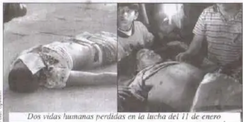
Dos vidas humanas perdidas en la lucha del 11 de enero