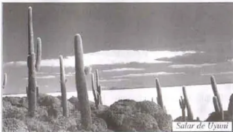
Salar de Uyuni