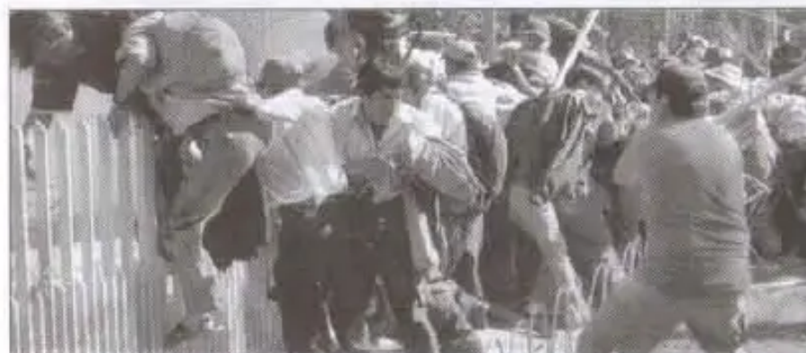
Campesinas y sectores sociales tuvieron que escapar por donde pudieron frente a la brutal golpiza de los "Jóvenes por la democracia" y vecinos de la zona norte

Temprano, cientos de cocaleros y campesinos tomaron la Plaza de las Banderas. El comité cívico suspende su movilización y declaran paro cívico indefinido. Pero, vecinos de la zona norte y jóvenes llevaron a cabo una marcha y dieron plazo hasta el medio día del jueves 11, para que las organizaciones sociales levanten sus movilizaciones y amenazaron con sacarles por la fuerza.