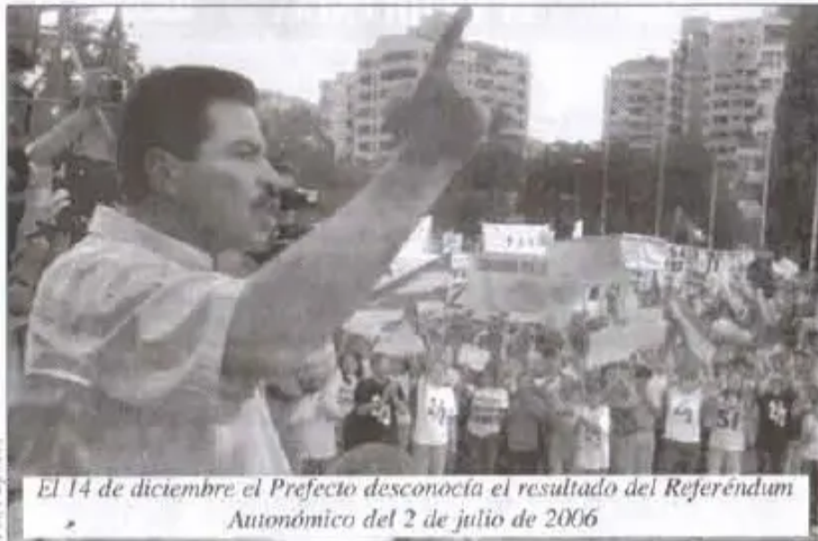
El 14 de diciembre el Prefecto desconoció el resultado del Referéndum Autonómico del 2 de julio de 2006