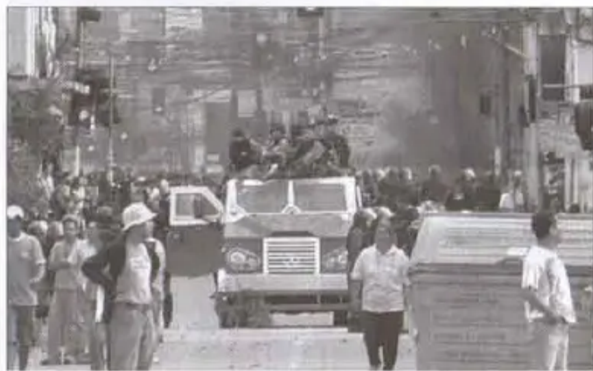
La policía casi no hizo nada para evitar el enfrentamiento