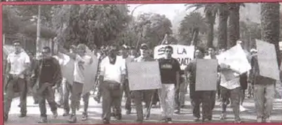
"Juventud por la Democracia": Dejaron marcha pacífica y actuaron con violencia racista

(Las Resoluciones del III Ampliado en Pag.12)