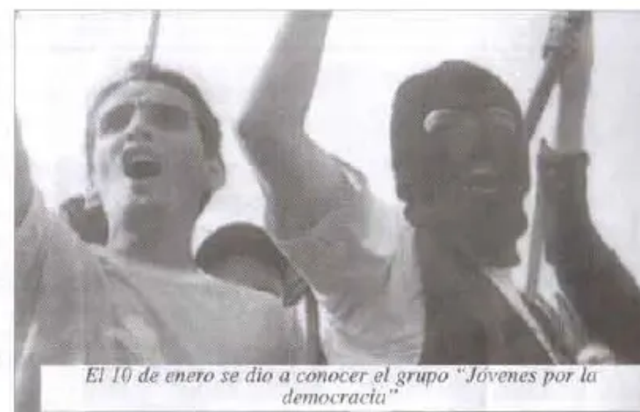
El 10 de enero se dio a conocer el grupo "Jóvenes por la democracia"