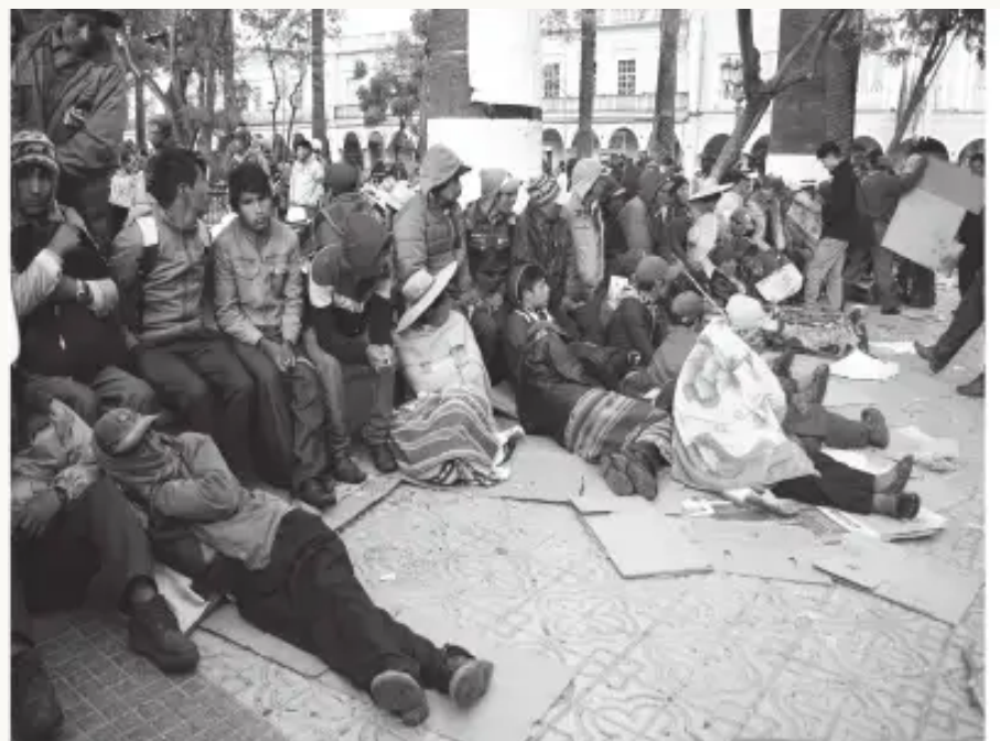
Vigilia de las bases de la provincia Ayopaya en la Plaza 14 de Septiembre.

Cámara de diputados uqhupi uk leywan chay anulakunantiyan nin, mana convienesan chu basesman, chayrarku analizakunqa”