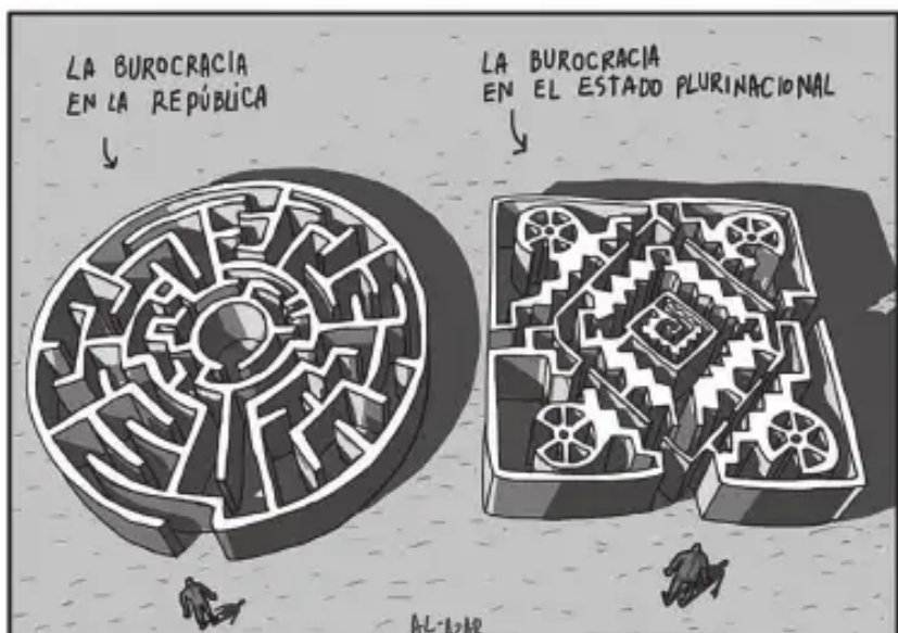
Gráfico: La Razón