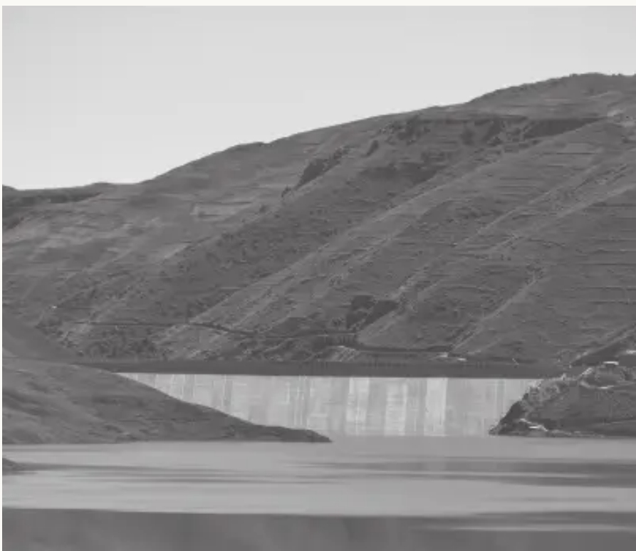
El Parque Tunari garantiza agua para Misicuni

Runas sapa delegaciónpi analizarqanku, imaraykuchus dirigentes firmaspa karqanku uk docuemnto ruwasqata reunionpi, mana consultaspa basesta, pikunachus suyaspa kachkarqanku mana mikhuspa, sayk’usqas plaza principal uqhupi. Ni pi conformechu karqa kay docu mento firmasqawan.