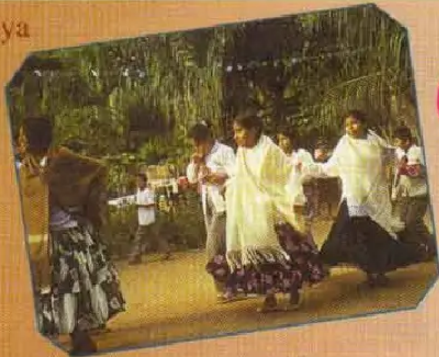
Comunidad Gualberto Villarroelqa, Central Regional Colorado jap'iyi kachkan, Cantón Cocapata Sección Municipal Morochata ukhupi.

Kay jina kusiqa kay wawakuna tusiruchkanku ima raymi karqari, qan yachankichu?