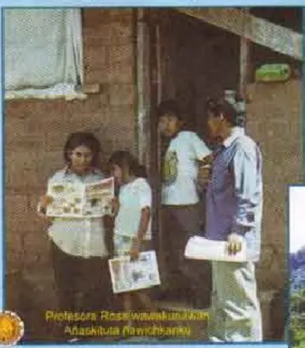
Profesora Rosa wawakunáwan Añaskituta ñawichkanu

qhawaspaqa mana k'utulechu kayku kuanari may chhika empresarios junt'aykamunku, gobierno chay jallp'ata consejionpi qusqa, chay pepelwanitaq jamuytawan sach'ataqa may chhikataña k'uturichkanku. Jatuchiq camionespi aparichkanku, pitaq chay chhika qullqivan qhapaqyachkan?