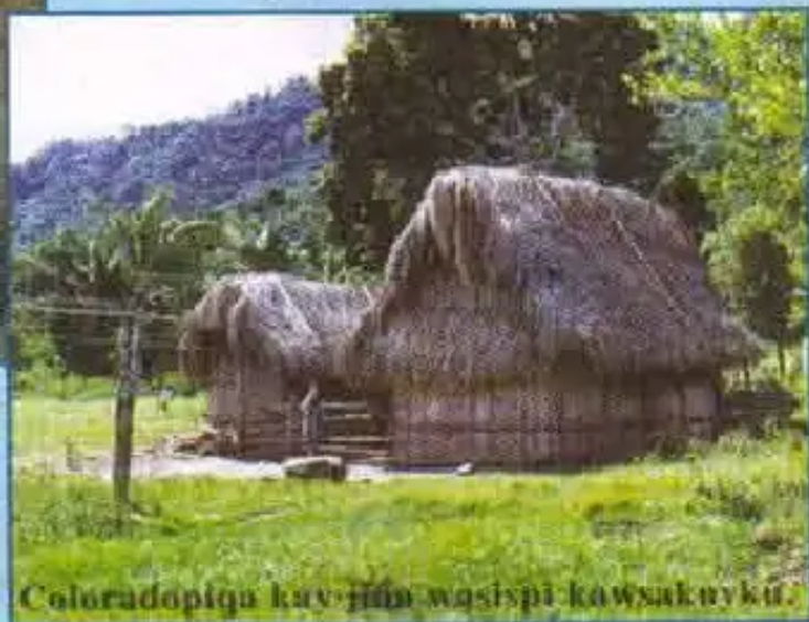
Coloradopiqa kay jipi wasispi kawsakuyku.

"Añaskitun" rukuy niqta phawaykachurispá wawakunawan, tatakunawan parlarimun.