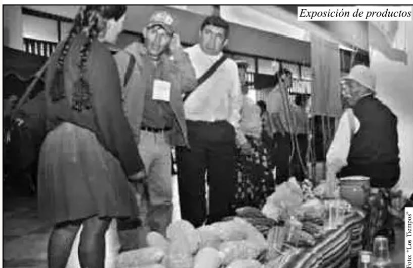
Exposición de productos

Un compañero, propuso: “La propuesta sería que como ya se ha firmado este convenio con la Federación, entonces el SEPA de Cochabamba tendría que tener una coordinación permanente con la Federación Única, y así todos los dirigentes de las Centrales provinciales en base a eso avanzar, haber cuánto de producción hay en cada provincia, en cada región, y bueno de esa manera avanzar en el tema de producción de papa” (12/10/10).