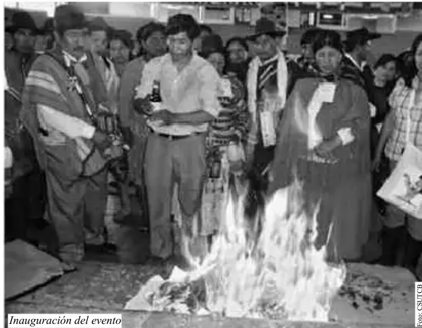
Inauguración del evento