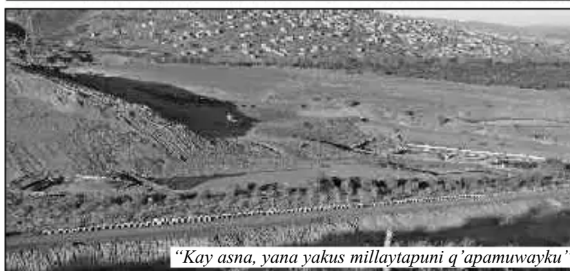
“Kay asna, yana yakus millaytapuni q’apamuwayku”