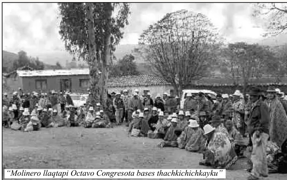
“Molinero llaqtapi Octavo Congresota bases thachkichichkayku”