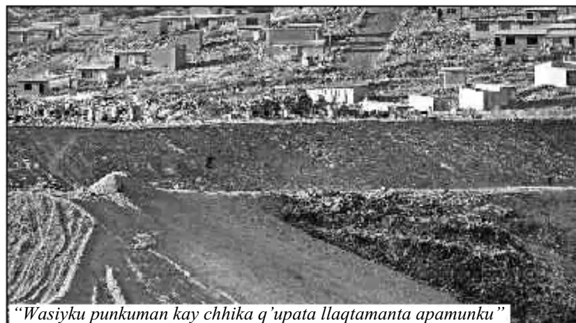
“Wasiyku punkuman kay chhika q’upata llaqtamanta apamunku”

“Kaypi wasis tawa wata jinaña junt’aykun. Paykuna niyta munanku, alrededor de la basura, pretextos mask’anku, niwayku, ‘imapaq qankuna wasista ruwakurqankichis yachasapa’, jinapis paykuna ñawpaqmantapacha mana saqinankuchu karqa wasi ruwakuqtaqa, chanta kay lotesta rantikuyku”.