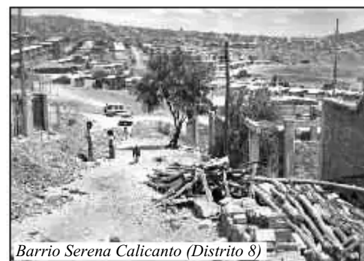
Barrio Serena Calicanto (Distrito 8)

Desde la Ley de Participación Popular (1994), los barrios periurbanos se han organizado también para introducir sus