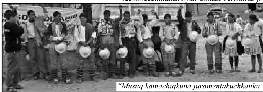
“Musuq kamachiqkuna juramentakuchkanku”

“Orgánicamente ancha karunchasqa kasanchis educaciónmanta, ukchakuna tiyan, qhuskamanta llank’ana tiyan. Comité ejecutivowan CREAMan ukchakunanku tiyan, reunión regionalpi punto educación manaña parlakunñachu, saqipullankuña, ajinata punto educaciónta saqipuktinku nuqa uk Congreso Ordinario Educativo wakichisaq, mana ampliadoschu ruwasasq”.