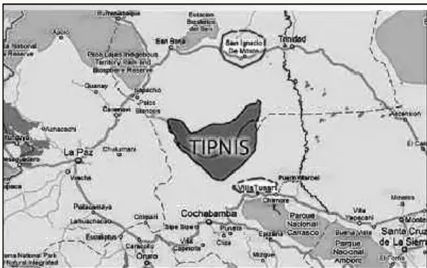
El Territorio Indígena Parque Nacional Isiboro Sécore (TIPNIS) se encuentra entre los departamentos del Beni y Cochabamba.

"La construcción de la carretera contribuirá a la fractura y fragmentación de los hábitats, cuando una carretera pasa por el medio normalmente lo que va hacer es afectar a todas las poblaciones que están dentro; lo que va hacer es que las enfermedades vayan emergiendo mucho más hacia las poblaciones y haya nuevos casos de fiebre amarilla, casos de dengue, principalmente. No quisiéramos que suceda el caso de la peste o los arena virus, anta virus que son muy fatales" finalizó Huaranca