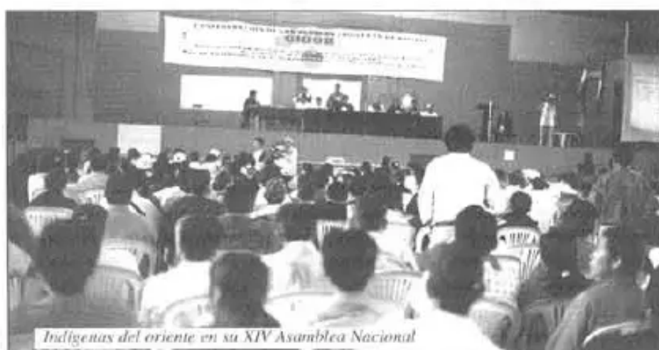
Indígenas del oriente en su XIV Asamblea Nacional