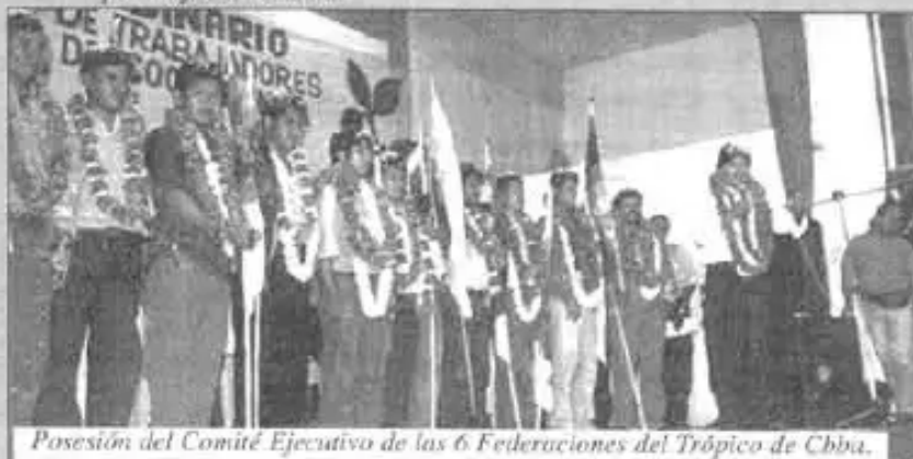
Posesión del Comité Ejecutivo de las 6 Federaciones del Trópico de Cbba.

• Apoyo al Instrumento Político para defender una Asamblea Originaria sobre todos los poderes y la votación por mayoría absoluta.