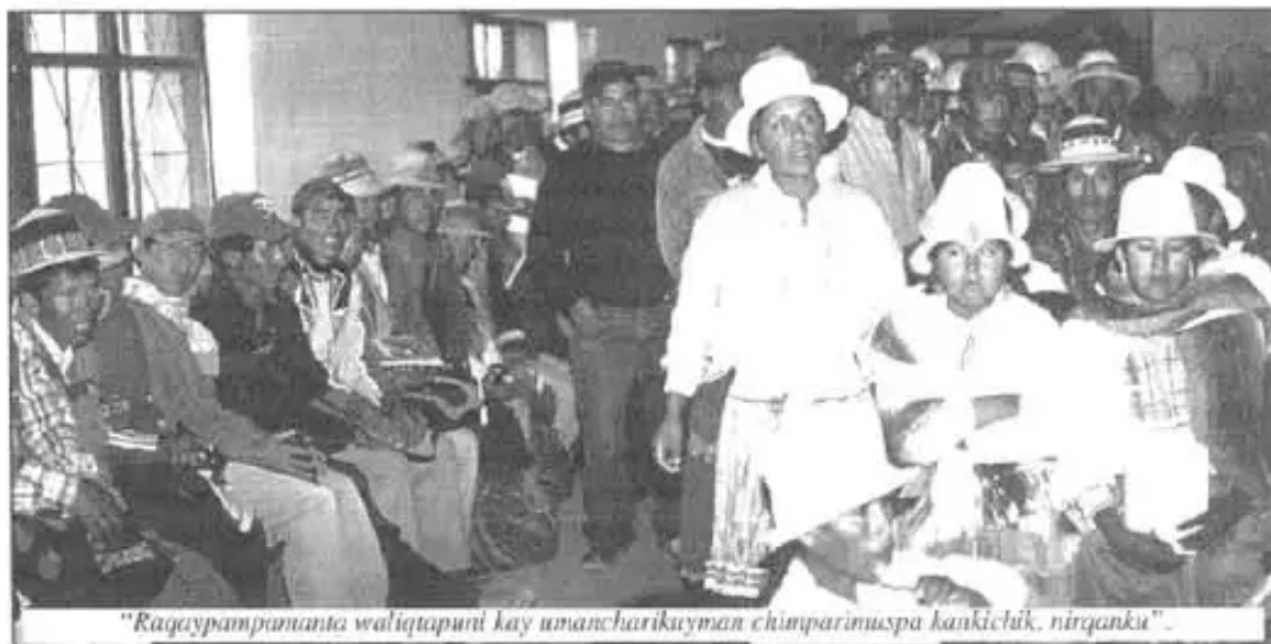
“Raqaypampamanta waliqtapuni kay umacharikuyman chimpanimuspa kankichik, nirqanku”.

Warmikuna Bolívarmanta nirqanku: “Qallarichkaqtiyku ni ima karkqachu, ni sello, ni acta; kuantri tukuy imawan junt'achkayku, organizacionniyku sumaq kallpachasqa kachkan, thurukuna tiyan, warmikunaqa qutuchakuyman rinapuni uyariq, wasi k'uchullapi kaspá mana ima yachanchikchu, mana umalliriytapis atinchiqchu”