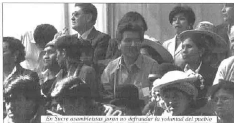
En Sucre asambleístas juran no defraudar la voluntad del pueblo

“La Asamblea Constituyente no es para someter a nadie, solo queremos igualdad en nuestros derechos, dignidad, libertad para todos los Bolivianos. El movimiento indígena originario jamás a sometido a nadie, aunque hemos sido sometidos, jamás ha discriminado a nadie, aunque hemos sido discriminados, el movimiento indígena originario jamás ha explotado, aunque hemos sido explotados. Pero bienvenido, todos ahora a postar por ese profundo cambio que esta buscando el pueblo Boliviano”. Concluyó Morales