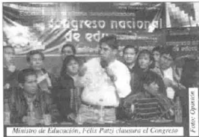
Ministro de Educación, Félix Pati clausura el Congreso