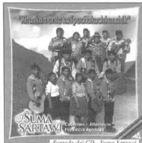
Portada del CD - Suma Sartawi

"Sunqukunata misk'icharinapaq Suma Sartawi centropi yachakuqkunaqa, takiyninkuta grabarinkuñan CD nisqapi, "Khuskamanta Kallpachakuchikankichik" sutiyuqta. Kay takiykunaqa paykuna umachakusqankumanta llusqin indígenas, originarios, campesinos manaña qunqasqa kanankupaq".