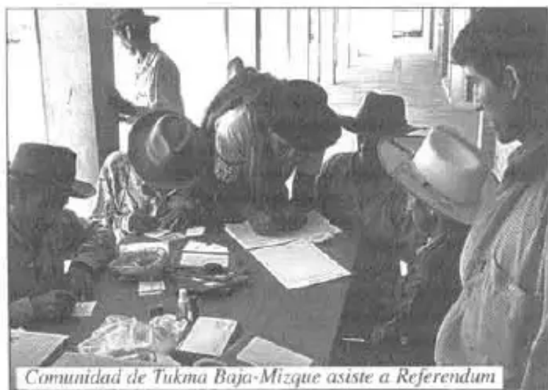
Comunidad de Tukma Baja-Mizque asiste a Referendum

Los datos de la Corte Nacional Electoral, muestran que el "NO" a las autonomías departamentales se impuso a nivel nacional, obteniendo 1.680.017 votos que es el 57,59%, el "SI" ganó en Santa Cruz, Beni, Pando y Tarija con 1.237.312 votos, que es el 42,4%, haciendo un total de 2.917.329 votos válidos.