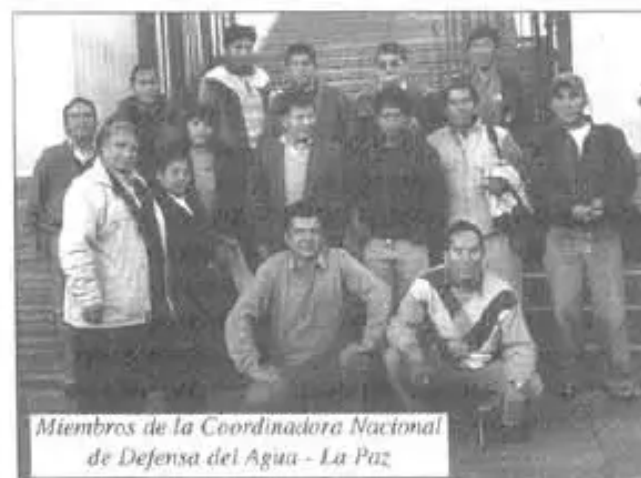
Miembros de la Coordinadora Nacional de Defensa del Agua - La Paz

El Plan de acción para la cooperación, lanzado por el Ministro de Asuntos Exteriores de Noruega en junio de este año, dice: "trabajaremos para asegurar el derecho al agua para todos y promover la idea del agua como un bien común." La plataforma política del gobierno, conocida como la Declaración Soria-Moria, también dice claramente que no se proveerá ninguna ayuda o alivio de la deuda que imponga como condición la privatización.