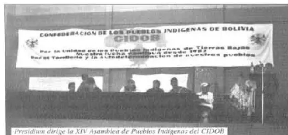
Presidium dirige la XIV Asamblea de Pueblos Indígenas del CIDOB