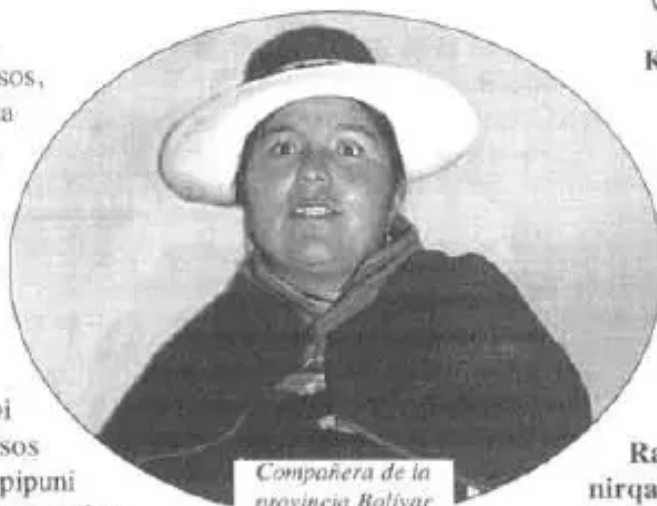
Compañera de la provincia Bolívar

Organizaciones warmikunamanta ñaraq Raqaypampa, Bolívar intercambio de experienciasta ruwariranku, Bolívar llaqtapi, ripuq 15, 16 p'unchaykuna julio killapi. Central Sindical Única Trabajadores Campesinos Provincia Bolívarmanta kimsa pachaq warmi wawas jina karqanku, Raqaypampamantataq kimsa chunka warmi wawakuna rirqanku.