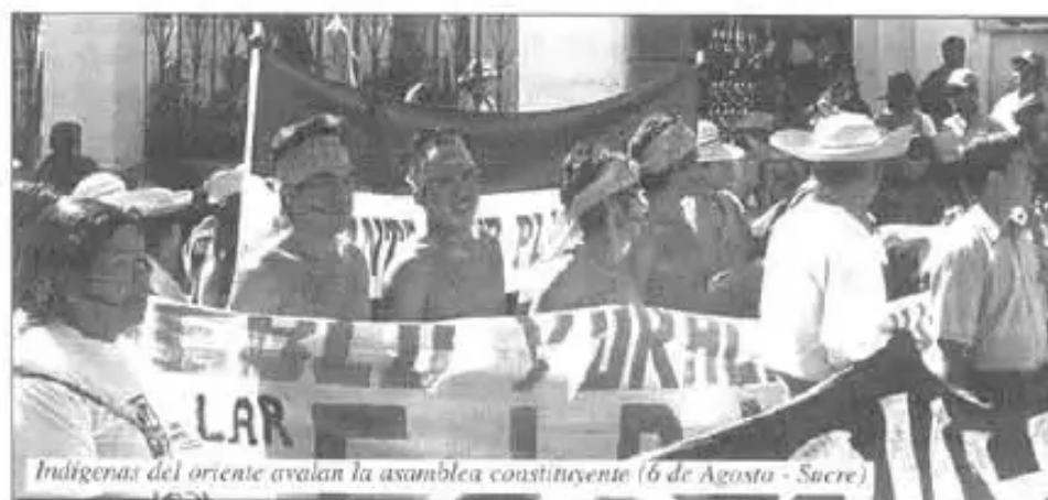
Indígenas del oriente avalan la asamblea constituyente (6 de Agosto - Sucre)

Esta forma de organización social también conocida como LIBERALISMO , se sujeta en 2 pilares o brazos: