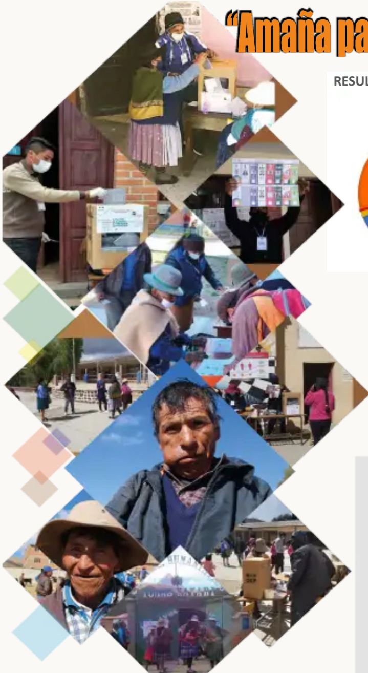
RESULTADOS ELECCIONES NACIONALES AL 100%