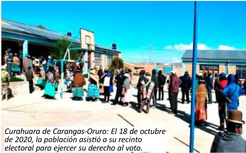
Curahuara de Carangas-Oruro: El 18 de octubre de 2020, la población asistió a su recinto electoral para ejercer su derecho al voto.