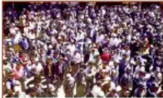
1 de marzo, la Resolución Prefectural Nº 054/2005 anula el Parque.

“Entre toda la organización tenemos que saber qué vamos a hacer con los ríos, el agua, los ruidos, la tierra y otros recursos, ya que si no utilizamos bien, planificando cuidadosamente, seremos responsables del daño de nuestra tierra y otros recursos que nos quedan”.