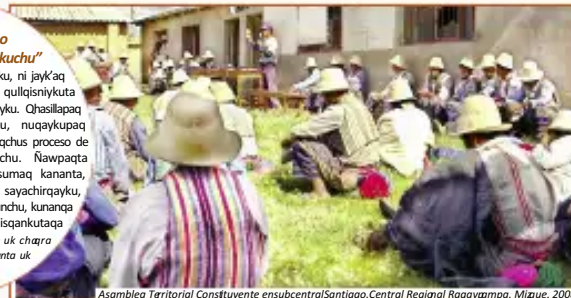
Asamblea Territorial Constituyente en subcentral Santiago, Central Regional Raqaypampa, Mizque, 2008

CENDA durante el proceso constituyente boliviano trabajó estrechamente con el movimiento de las organizaciones campesinas originarias, en Mizque con la Central Regional Sindical Única de Campesinos Indígenas de Raqaypampa (CRSUCIR), y en Ayopaya con la Central Sindical Única de Trabajadores Campesinos Originarios de la Provincia Ayopaya (CSUTCOA). Con ambas organizaciones impulsó procesos sociales, educativos, productivos y territoriales, para reforzar las estrategias de vida propias de las comunidades.