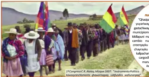
1º Congreso C.R. Alalay, Mizque 2007: "Instrumento Político kawayinchismanta qhawarinaqqa. Latifundios wafuñanaqqa"