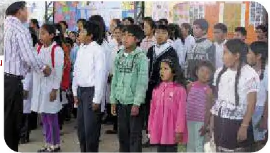
Yachakuqkuna Himno Nacionalta takirichkayku