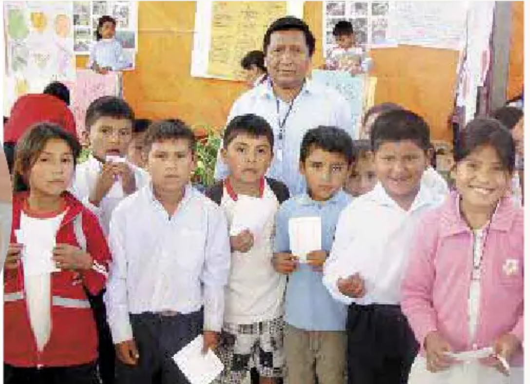
Totora Ilaqta: Feriaman mamaywan jamuni. Trigota vendenapaq apamuyku. Añaskituspaq napaykuyta apachimuni.