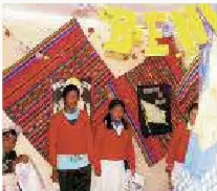
También somos del Colegio Juan Lechín Oquendo, 3º B Secundaria, nosotros estamos presentando al departamento del Beni.