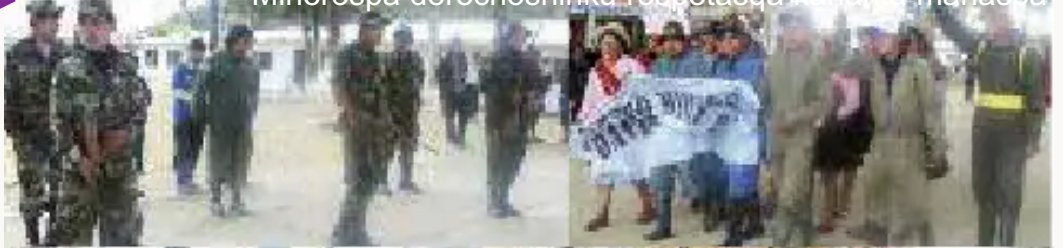
Uk minerota apakapuchkanku

Minerospa derechosninku respetasqa kashan, mañasha