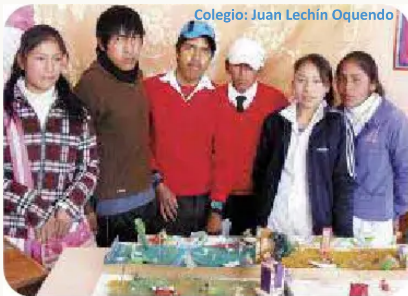
Colegio: Juan Lechín Oquendo