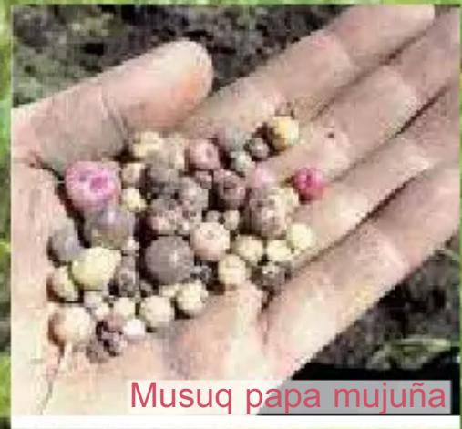
Musuq papa mujuña