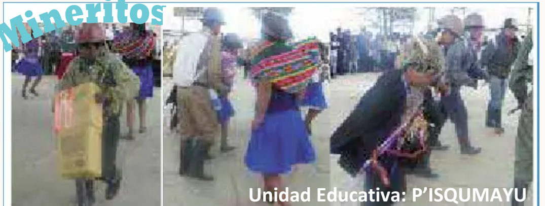
Unidad Educativa: P'ISQUMAYU