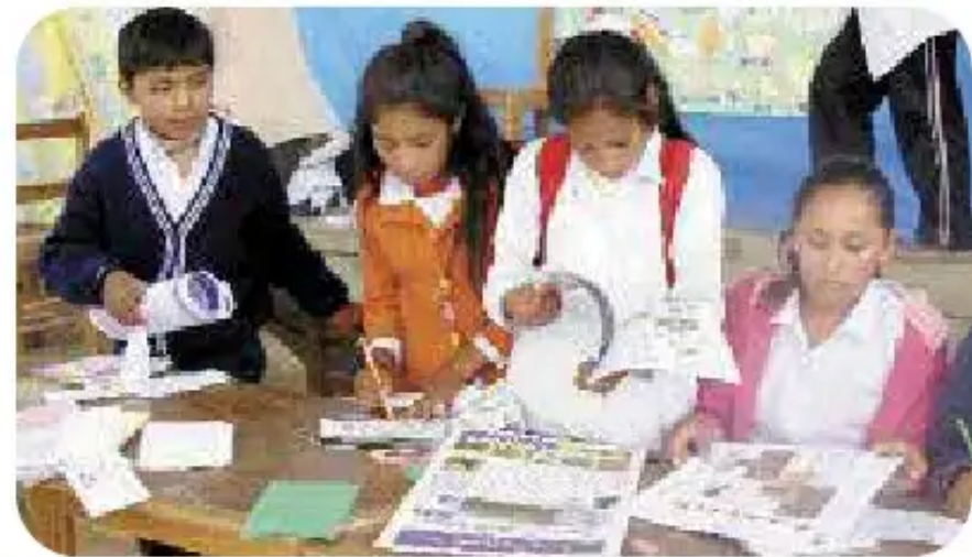
“Añaskitu” p’anqa, feriaykuman waturikuq jamuriwayku