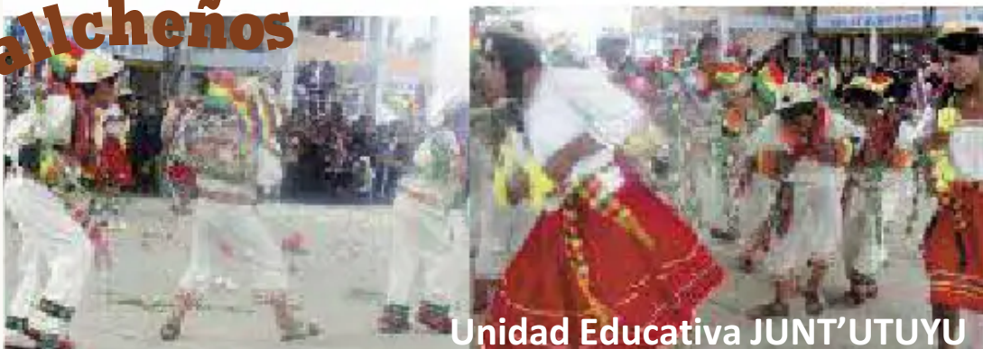
Unidad Educativa JUNT'UTUYU