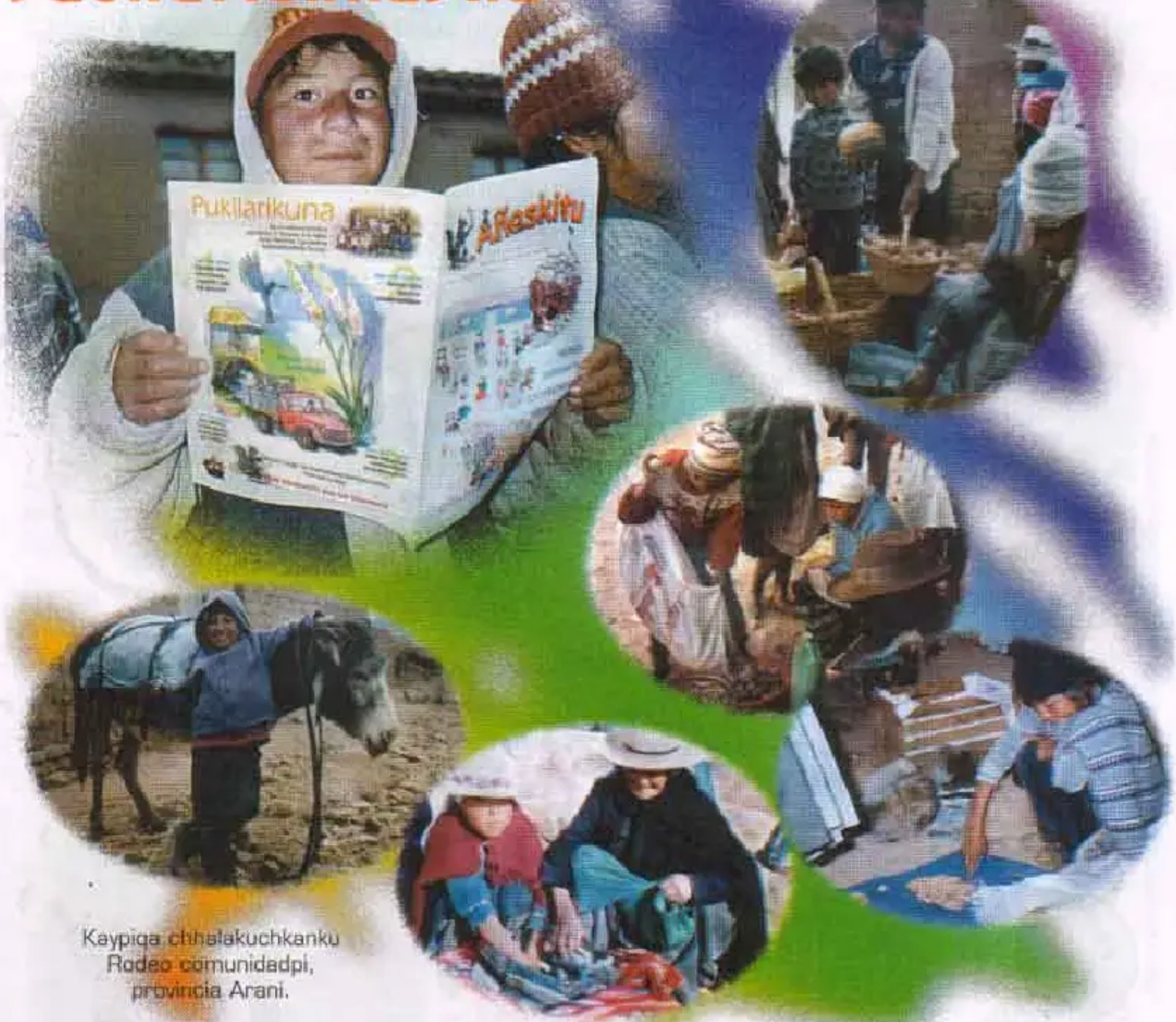
Kaypiqa chhalakuchkanku Rodeo comunidadpi, provincia Arani.