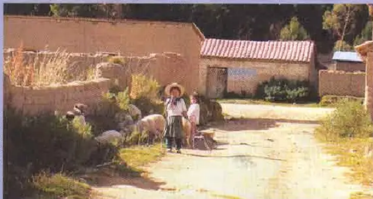
Vacas chiqapi iskay warmiwawakuna uwijakunanta quchaman yaku ujjakunanpaq apachkanku.

Qankunanapis apachimuwaychik, tukuy wawakuna yachanankupaq aylluykimanta, kawsayniykimanta