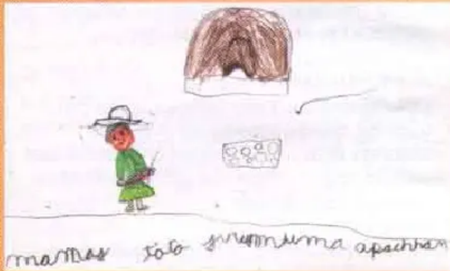
Félix Ricaldes R. Primer Curso