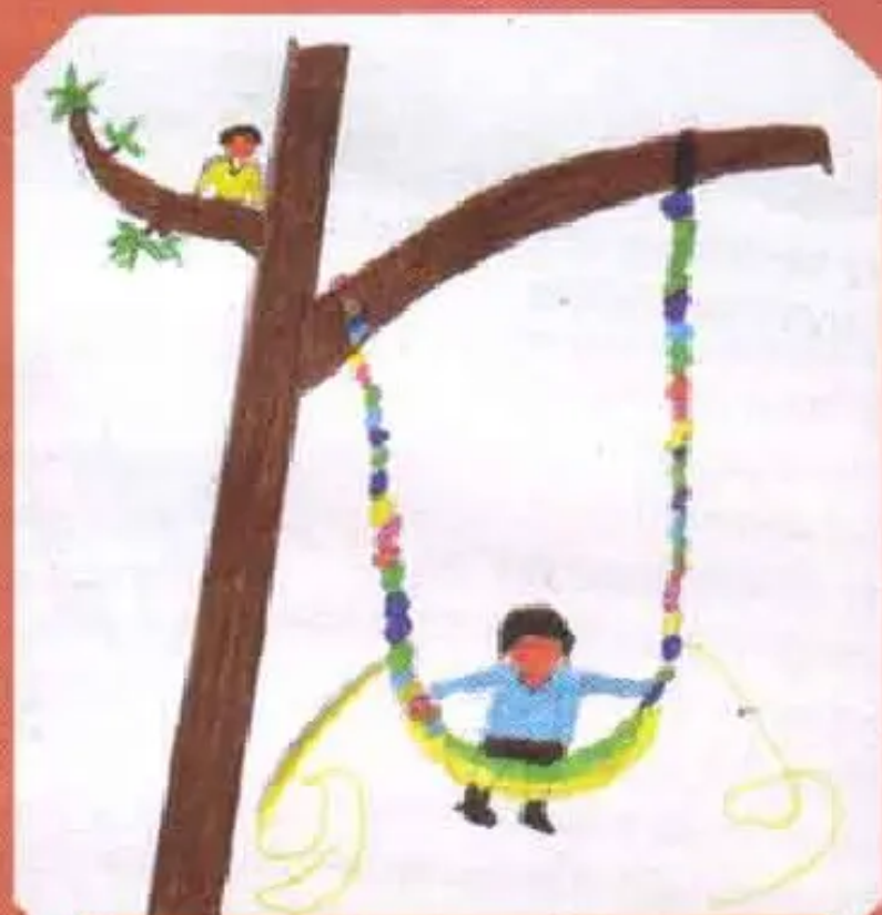
Wawa Fernando Fernández, Todosantos raymimanta, Taracollo Yachay-Wesipi siq'ispa ruwasqankuta riqsichimuwachkanchiq