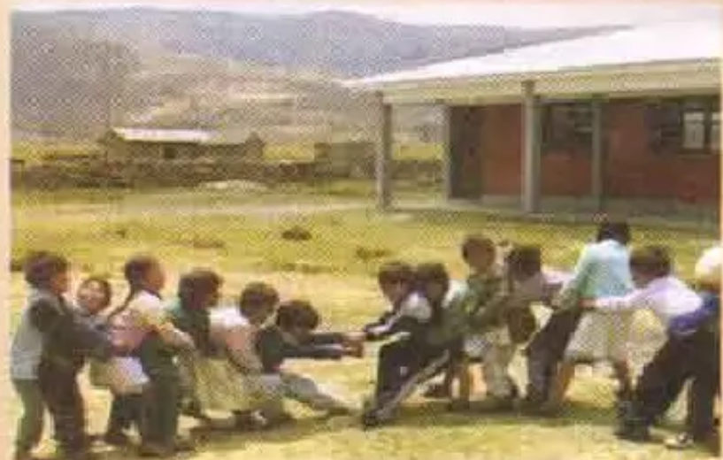
"Chay marquitapaqqa K'aspisitusta, ichhusta, rumista, k'urpitasta, churarimuyku"

Ñawpaqtaqa iskay wawakuna, willanakamunchiq, naranja qan kanki, nuqa plátano nispa. Chanta wawakuna uk filapi takispa jamunku. Ukta qhipachiyku, chanta tapuriyku "ima frutataq kanki" nispa tapurinchiq. Naranja ninchiq chayqa, chay naranjaq wasanman yaykunchiq. Achhaymantaq formakamunchiq. Chaymanta iskay frutasmanta estiranakunchiq, uk marquitata chawpiman churanchiq chay marquita pasanachikunchiq achhaypi mayqillanpis atipanchik.