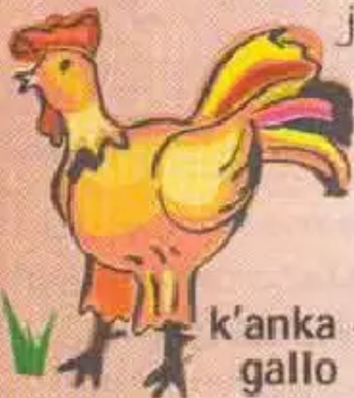
k'anka - gallo