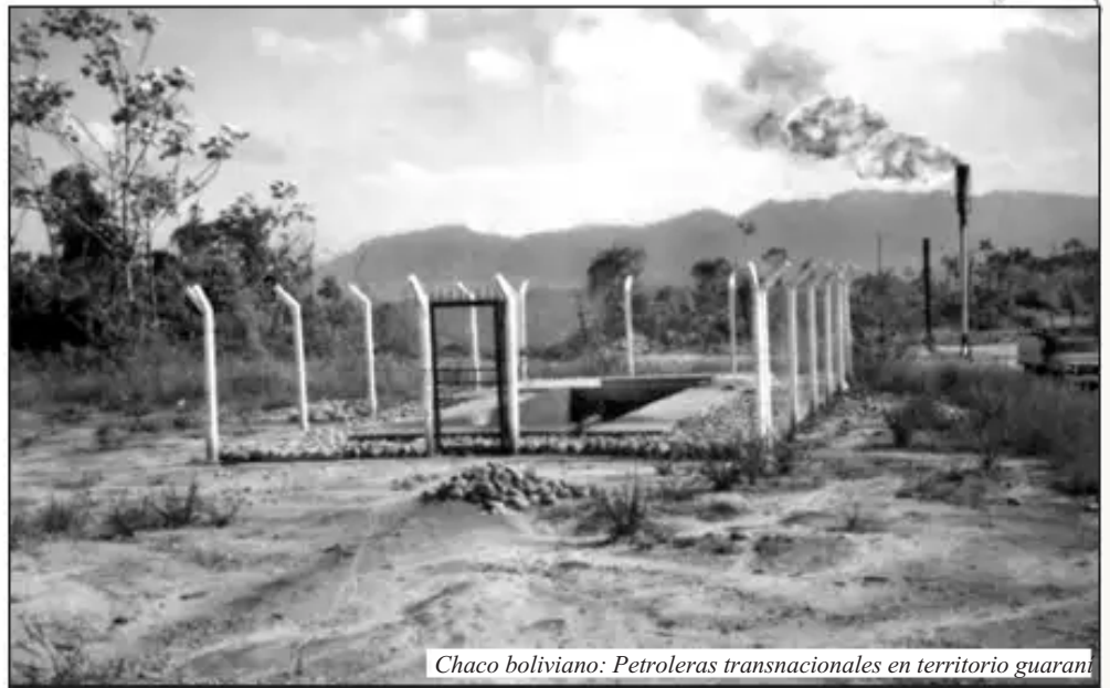
Chaco boliviano: Petroleras transnacionales en territorio guaraní

En asamblea los pueblos indígenas guaraníes, weenhayek y tapietes del Chaco tarijeño, decidieron no permitir el ingreso de ninguna empresa petrolera dada la contaminación de los ríos y quebradas en sus territorios.