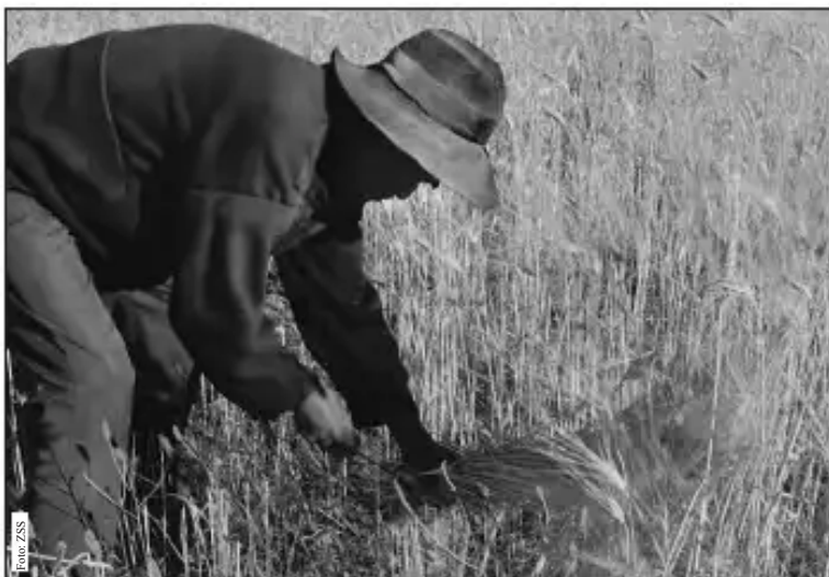
"Trigo ruthuy" - Jatunpampa, Anzaldo (2010)