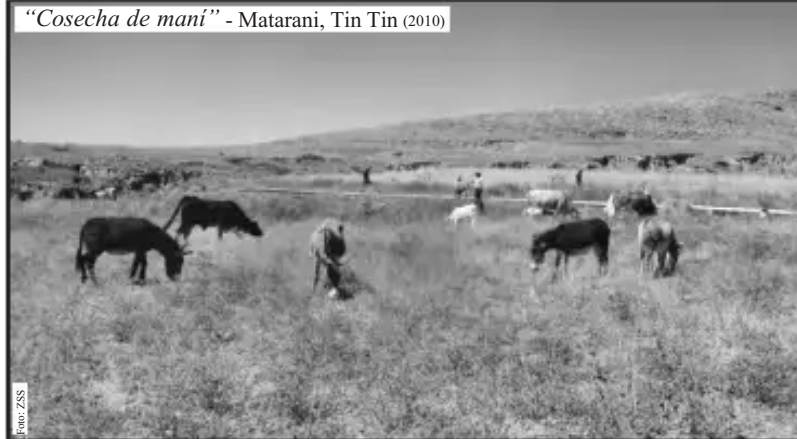
"Cosecha de mani" - Matarani, Tin Tin (2010)

"Allin puquykunaqa, jinapis tarpuykunata unquyk"