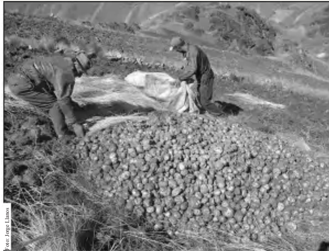
Colquechaka: “Papa puquy maychus chaylla karqa” (Ayopaya, 13 de mayo de 2010-familia Escobar)

“Tiyapuwan suqta yunta puriy, uk hectarea khuskanniyuk, pusaq bolsas jinalla uqharikunqa,