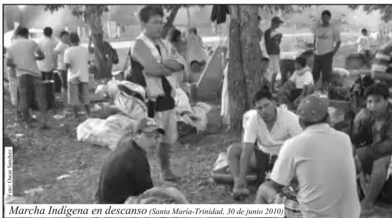
Marcha Indígena en descanso (Santa María-Trinidad, 30 de junio 2010)