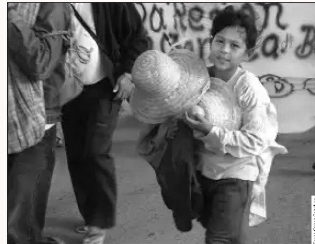
Niña indígena participa en la Marcha Indígena junto a sus padres (Santa María-Trinidad 1 de julio de 2010)

“El diseño inicial (de la carretera Villa Tunari-San Ignacio de Moxos), es un diseño inicial que pasará por el Parque Isiboro Sécore e involucra un riesgo”, reconoció la autoridad. Reveló que el proyecto, que integrará los departamentos de Cochabamba y Beni, no cuenta con ninguna Licencia Ambiental para iniciar los trabajos y hay observaciones. (Erbol, 21 de mayo de 2010).