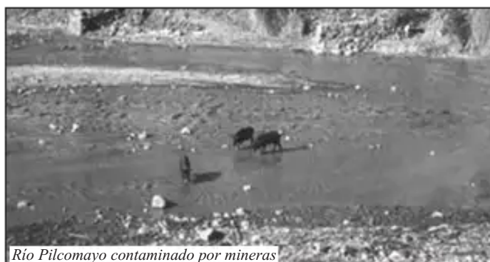
Río Pilcomayo contaminado por mineras

De unas 730.000 hectáreas asignadas por el Estado a las empresas petroleras, 317.218 se encuentran en Territorios de los grupos Étnicos Guaraníes yaku-igua, itika guasu y tentayapi. Unos 80.000 indígenas habitan la región.