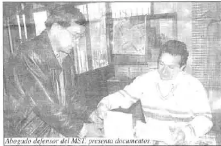
Abogado defensor del MST, presenta documentos.

Pero, los días pasan rápido, ya, nosotros hemos ido cerca a las tierras demandadas, donde cabalmente hemos podido encontrar plantas de marihuana ya también, eso, otra denuncia hemos tenido que hacer, han tenido que bajar los de la FELCN para verificar, hicieron la prueba, resultó que era positivamente marihuana; todo eso hemos aumentado a las denuncias, públicamente hemos presentado en medios de televisión, pero no salió nada a la luz allí en Santa Cruz, como no salió nada a la luz, hemos tenido que ir a la ciudad de La Paz, más de 50 canales han estado, nacionales e internacionales, ahí es donde se a difundido todo. Tenían que hacer investigaciones para juzgar quienes eran esas personas que estaban trabajando ilícitamente ahí adentro.