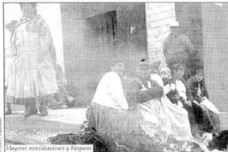
Mujeres movilizando y bloqueando