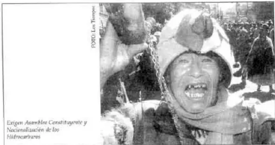
Exigen Asamblea Constituyente y Nacionalización de los Hidrocarburos