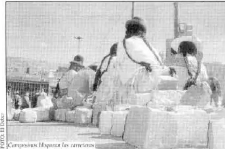
Campesinos bloquean las carreteras