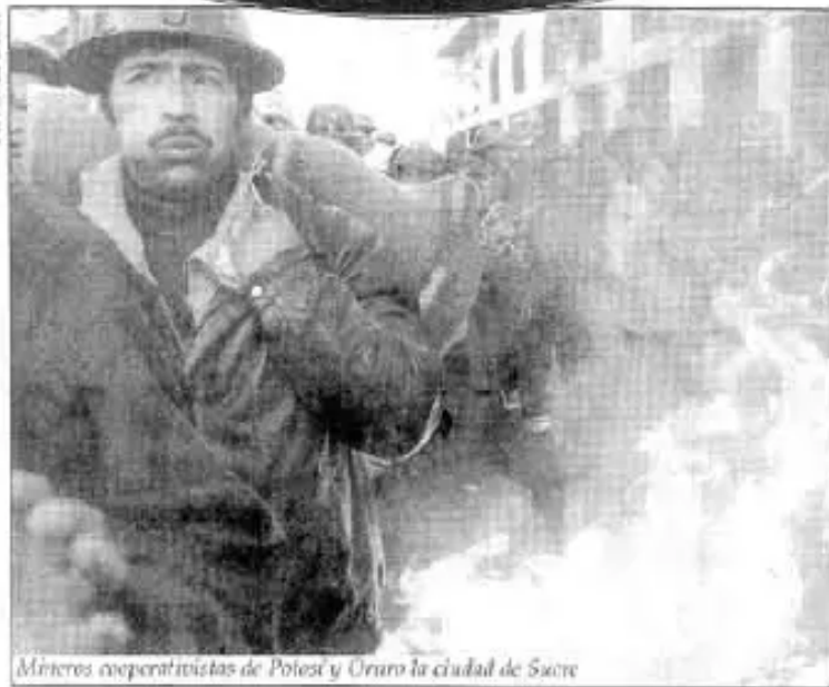
Mineros cooperativistas de Potosí y Oruro en la ciudad de Sucre