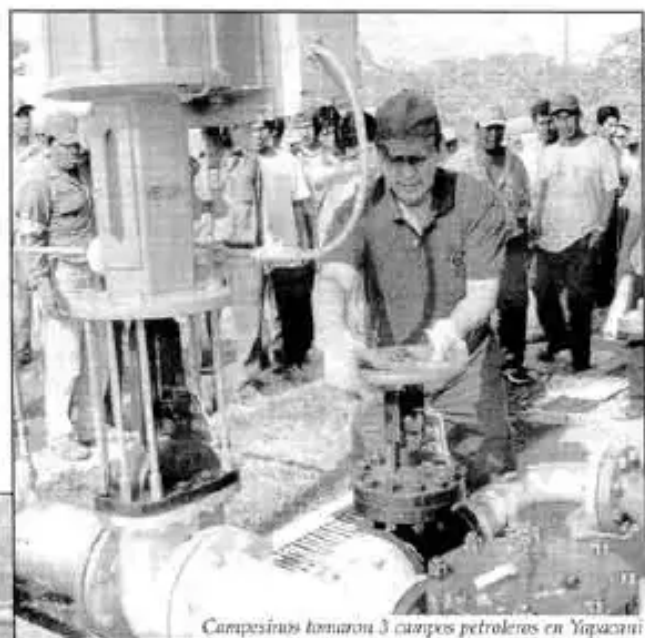
Campeñinos tomaron 3 campos petroleros en Yaqacani

❖ A medio día, AASANA (Aduana aérea) entra en huelga general indefinida en los 27 aeropuertos que controlan, en apoyo a la Nacionalización de los Hidrocarburos, Asamblea Constituyente, Referéndum y la reversión de la administración de los 3 aeropuertos principales privatizados al Estado. El país está aislado.