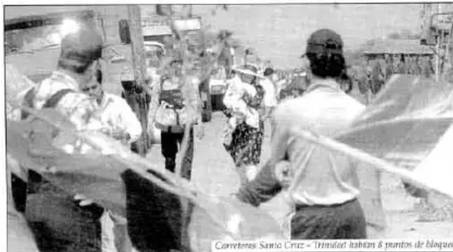
Carreteras: Santa Cruz - Trinidad habitan 8 puntos de bloqueo

La Confederación Unica convocó a una tregua de 10 días, con acciones para seguir exigiendo Asamblea Constituyente. Sin embargo, otros sectores, como los campesinos que tomaron los pozos petroleros en Santa Cruz, dijeron que evalúan todavía la nueva situación. Lo mismo que los dirigentes de El Alto que convocaron a un Ampliado para definir el curso de las nuevas acciones, las demandas estructurales se han congelado.