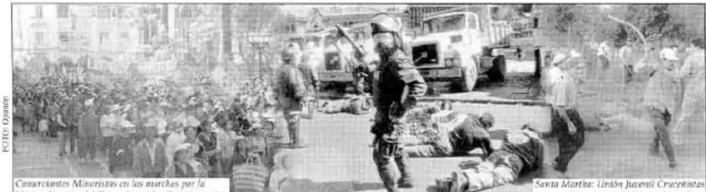
Comarcantes Minoristas en las marchas por la Nacionalización de los Hidrocarburos y Asamblea Constituyente