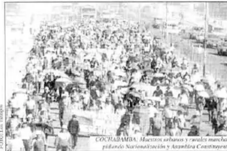
COCHABAMBA: Maestros urbanos y rurales marchan pidiendo Nacionalización y Asamblea Constituyente