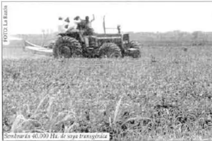
Sembrando 40.000 Ha. de soya transgénica

— Se paró el Proyecto de Semillas, pero dan luz verde a la semilla de la transnacional Monsanto —