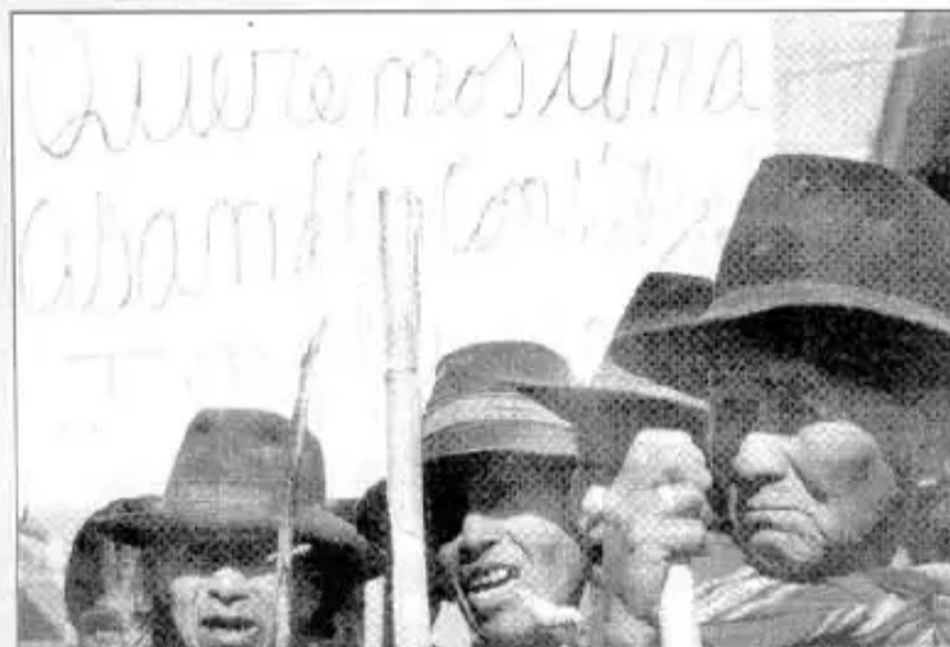
Las movilizaciones de los sectores advirtieron que esperaban más que solo un cambio de presidente

Contra todo un pueblo que se ha expresado por la Constituyente y la Nacionalización, los partidos políticos nuevamente conspiran con el apoyo de las logias cruceñas y las petroleras y con la venia de la Iglesia para impedir que la gente logre lo que quiere.