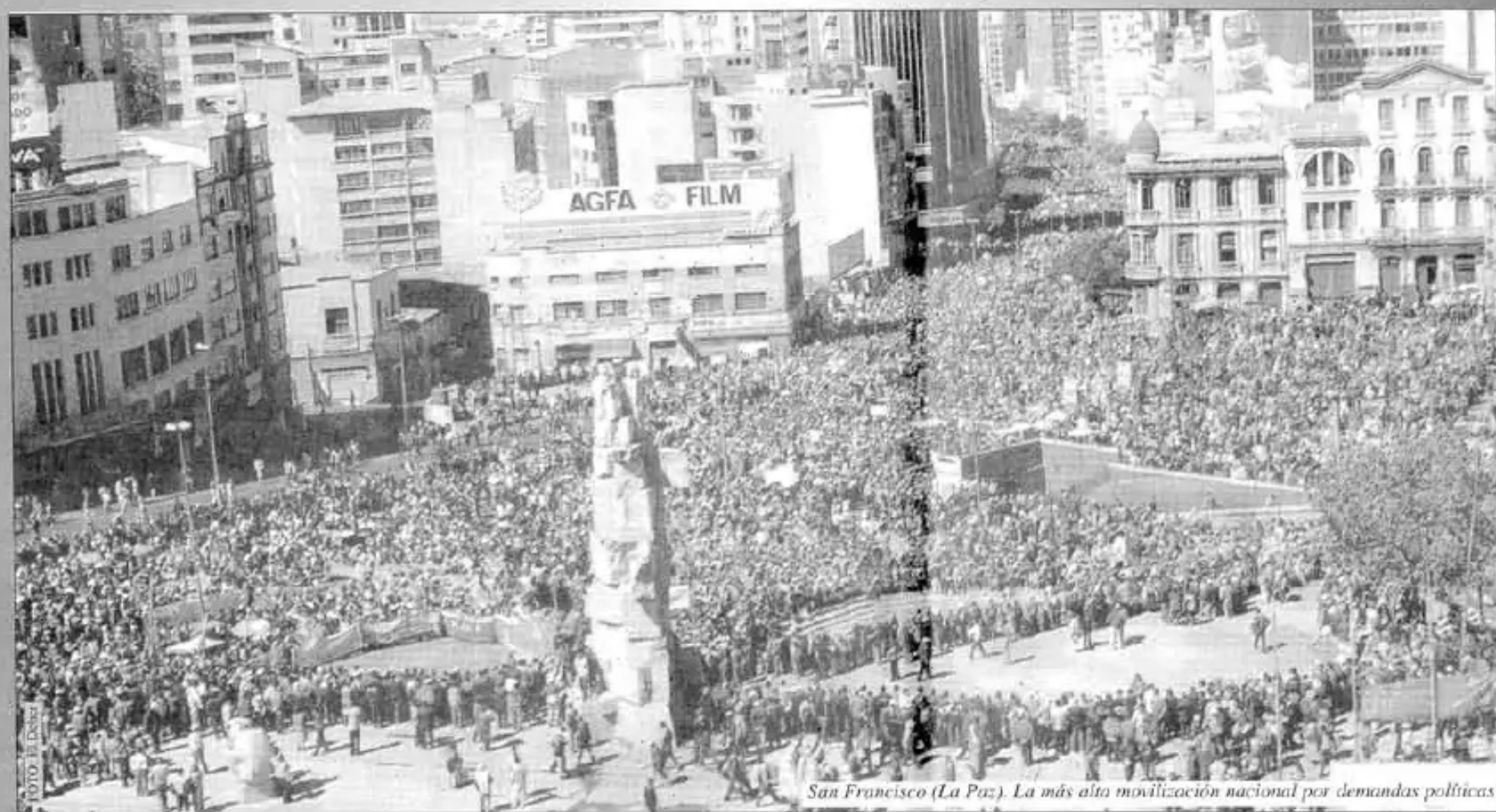
San Francisco (La Paz). La más alta movilización nacional por demandas políticas

... pero la oligarquía y los partidos políticos nuevamente quieren burlar al pueblo con elecciones generales.