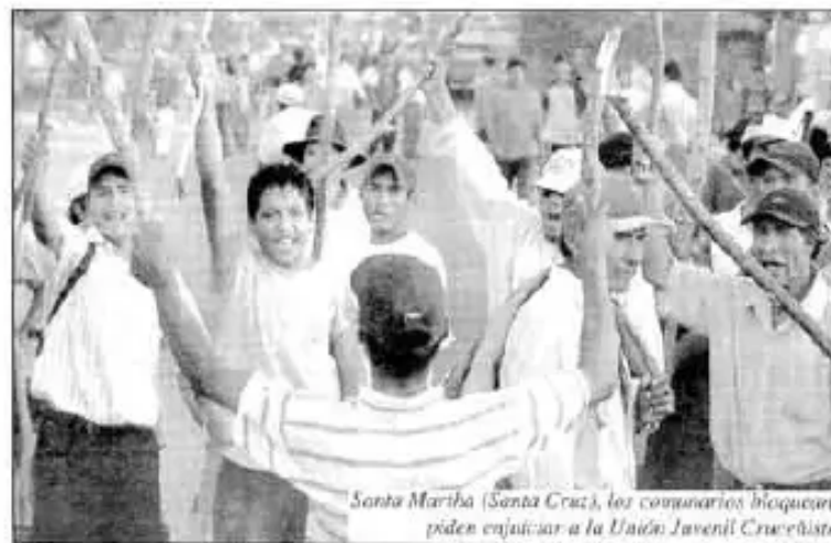
Santa Marita (Santa Cruz), los comunarios bloquean, piden enjuiciar a la Unión Juvenil Cruceñista

❖ Se perfila que se dirige hacia la salida constitucional de nombrar al Dr. Rodríguez, actual Presidente de la Corte Suprema de justicia como Presidente y exigir la inmediata convocatoria a Elecciones Generales.