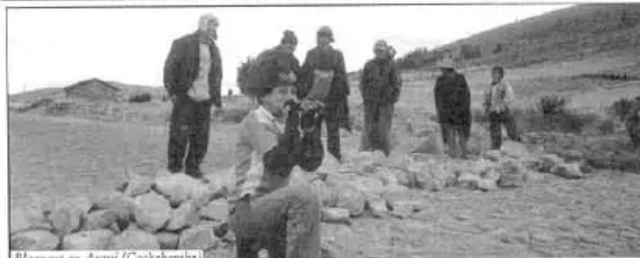
Bloqueos en Arani (Cochabamba)