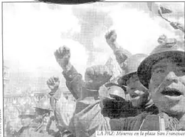
LA PAZ: Mineros en la plaza San Francisco