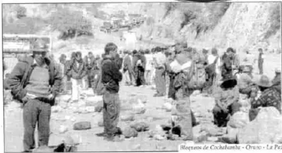
Bloqueos de Cochabamba - Oruro - La Paz