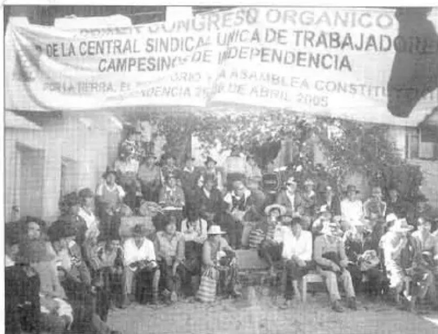
Primer Congreso Orgánico de la Central Sindical Unica de Trabajadores Campesinos Originarios de Independencia (CSUTCOI)