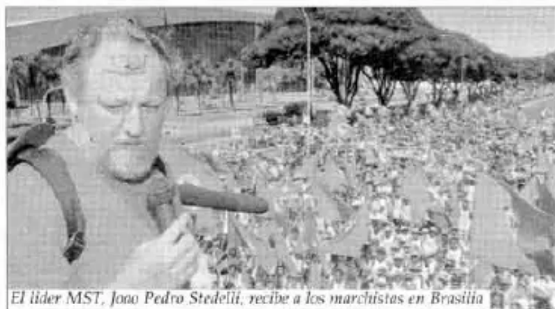
El líder MST, Juan Pedro Stedile, recibe a los marchistas en Brasilia