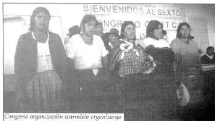
Congreso organización warmista organizarqa