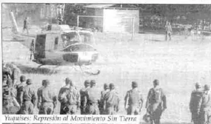
Yuquises: Represión al Movimiento Sin Tierra