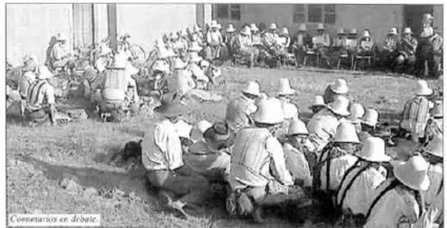
Comentarios en debate.

sin tomar en cuenta la población de las subcentrales sino respetando a las organizaciones.