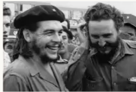
Fidel Castro y el Che