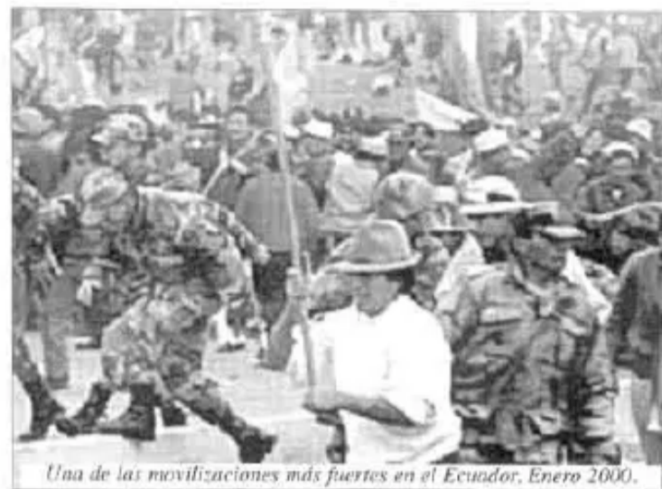
Una de las movilizaciones más fuertes en el Ecuador, Enero 2000.

Un comarero de la provincia Bolívar dijo: "La Dirección Nacional del IPSP-MAS; los diputados, senadores elegidos por las organizaciones están actuando sin consultar a las organizaciones campesinas e indígenas; ellos no han ido a ocupar 'carguitos', han ido a defender los derechos de los campesinos, indígenas y del pueblo trabajador. Además hay arriba se están peleando entre ellos, como los partidos tradicionales. Tienen que consultar a las bases, a las organizaciones; el Instrumento Táctico ha sido organizado por la CSUTCB, CSCB, las Federaciones. Tenemos la "Comisión Disciplinaria" organizado en el Congreso de Oruro, parece que se ha dormido, debería investigar estas situaciones. Yo veo que tenemos que organizar una Comisión Investigadora las Federaciones Unicas, y las Confederaciones, para investigar que está pasando con la Dirección del Instrumento Político, los diputados, senadores.