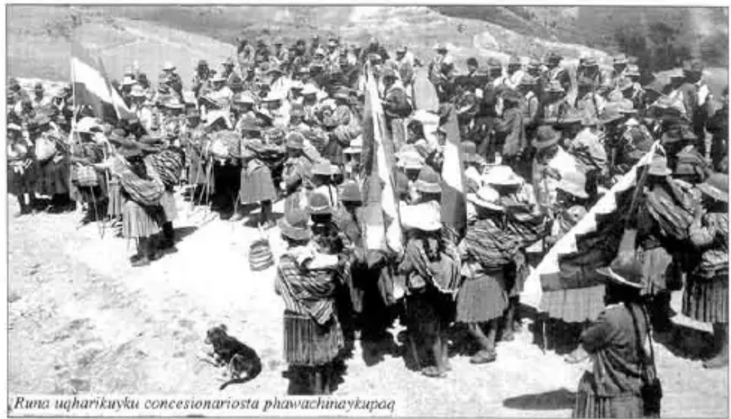
Runa uqharikuyku conasecionariosta phawachunaykupaq

Subcentral K'uti, Subcentral Sanipaya ima pasaq chunka p'unchay kachkaptin abril killamanta ñawpaqman aparqanku uk ampliadata. Sinchimanta qhawarirqanku empresarios conasecionakapuyta munasqankuta urqusninkuta, imaraykuchus sodalita mineralta tarisqanku