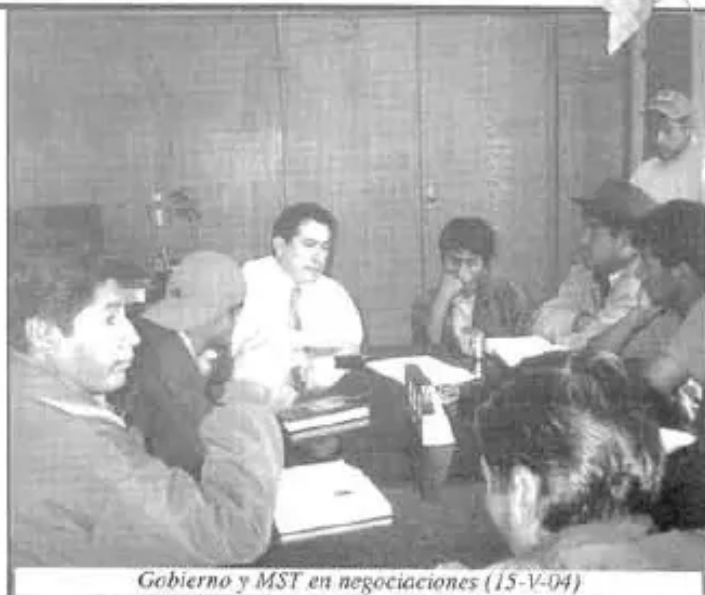
Gobierno y MST en negociaciones (15-V-04)

"Con la marcha hemos fortalecido la unidad del Bloque Oriente, y la unidad de los pueblos quechuas, aymaras, guaraníes, yuracares,