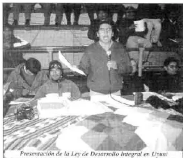
Presentación de la Ley de Desarrollo Integral en Uyuni

Las organizaciones de las 5 provincias del Sudoeste Potosino, a la cabeza de la Federación Regional Única de Trabajadores Campesinos del Altiplano Sud (FRUTCAS), lucharon por la defensa de sus Recursos Naturales, contra la venta y exportación de las aguas fósiles (subterráneas) a Chile, después de más de 3 años lograron hacer aprobar la "Ley de Desarrollo Integral del Sudoeste Potosino, que prohíbe la venta y exportación de aguas"