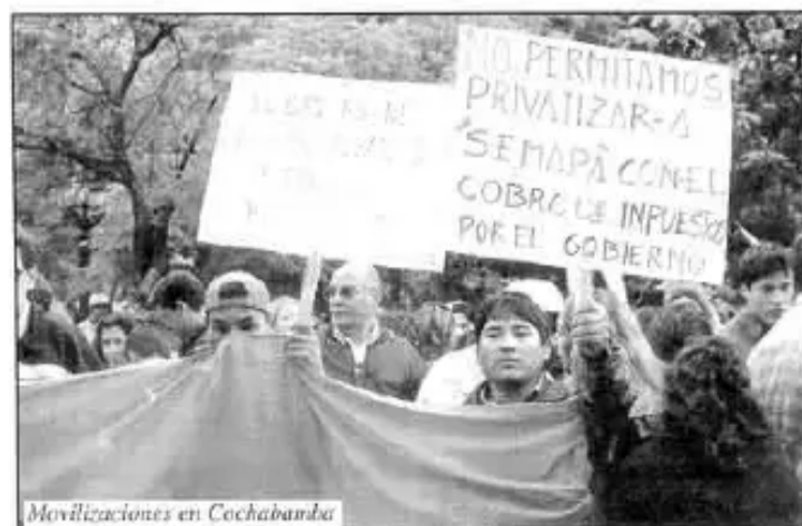
Movilizaciones en Cochabamba