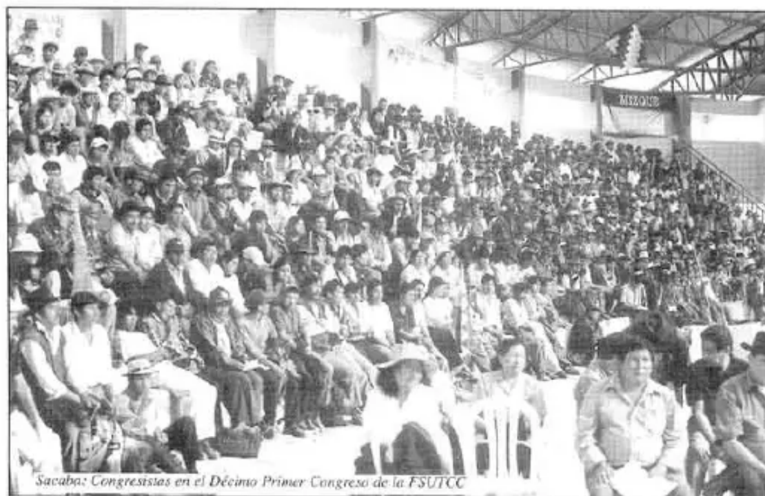
Sacaba: Congressistas en el Décimo Primer Congreso de la FSUTCC

• Rechazo a la reducción forzosa definitiva, puesto que solamente siembran hambre y luto los soldados encargados de la erradicación, que retornen a sus unidades correspondientes.