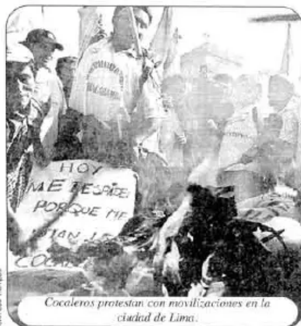
Cocaleros protestan con movilizaciones en la ciudad de Lima.

Miles de campesinos (18 de mayo) peruanos realizaron una marcha en el centro de Lima para exigir el cese de la erradicación de cocales. A los campesinos cocaleros que llegaron a Lima ya hace dos semanas procedentes de la región de Tingo María, se sumaron movimientos nacionalistas y gremialistas locales.