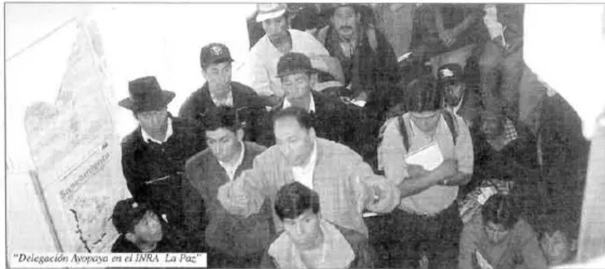
"Delegación Ayopaya en el INRA La Paz"

Phichqantin Centrales Regionales (Calientes, Icari, Altamachi, Choro, Cocapata, Colorados) Ampliadota pasaq suqta p'unchay abril killa Choritopi ruwarqanku. Tarikurqanku dirigentes Federación warmismanta, Central provincial Ayopaya, Diputados, senadores Instrumento politicomanta ima.