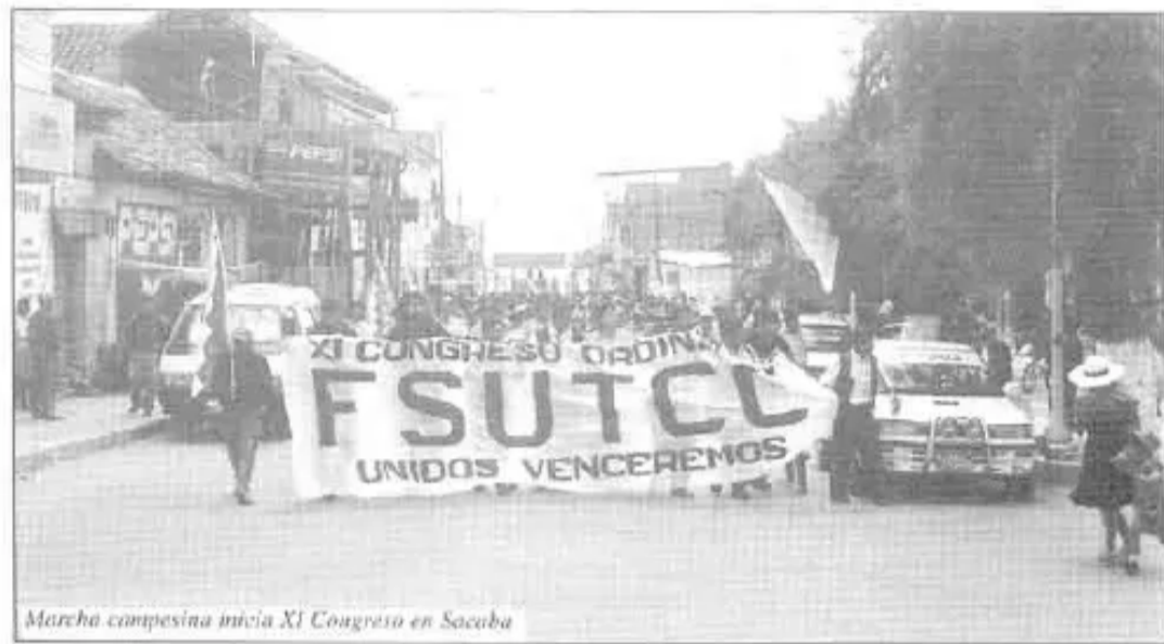
Marcha campesina inicia XI Congreso en Sacaba

• Impulsar y reforzar el IPSP-MAS desde nuestras comunidades, Subcentrales, Centrales Regionales, Central Provincial, Federaciones Departamentales y Nacionales y otros gremios sociales del país, para que no se debilite y