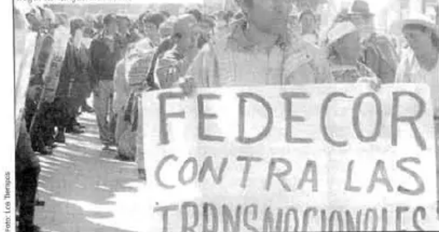
Regantes exigen anulación de incremento ilegal de tarifas eléctricas

Presidente nichkan ‘respetakunqa contratos transnacionaleswan’ jina kaptinqa imapaq ruwakuchkan referendumb?, chayqa niyta munan dueños empresas transnacionalesllapuni kanqanku.