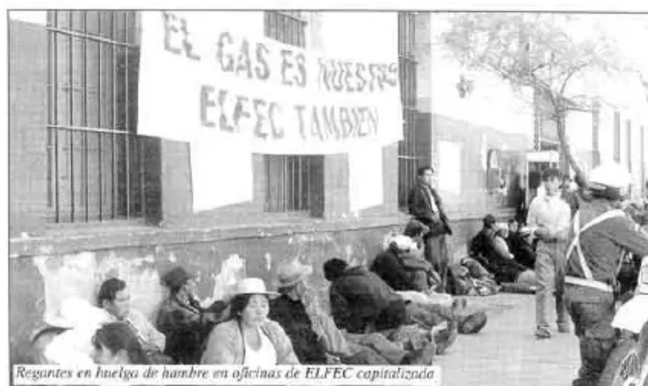
Regantes en huelga de hambre en oficinas de ELFEC capitalizada

1) ELFEC debe cumplir el convenio firmado con los Regantes el 16/02/04, que fija como tarifa de 20 centavos por KWH para pozos de riego y agua potable.