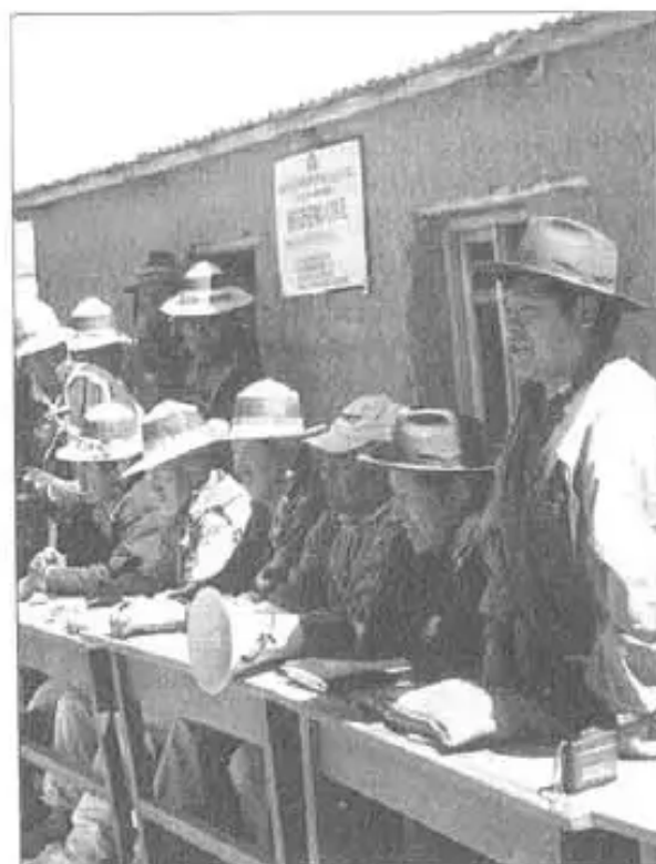
Ch'uñu Ch'uñuni: "Organizasqa jallp'a jap'ik rina"

"Ni familiaspis mana rinkuchu. Mana kaymanta ni mayqin compañero kay phisqa watapi rinkuchu, ni mayqin basemanta risqanku kanchu, nitaq ni mayqin ni pi saneamiento