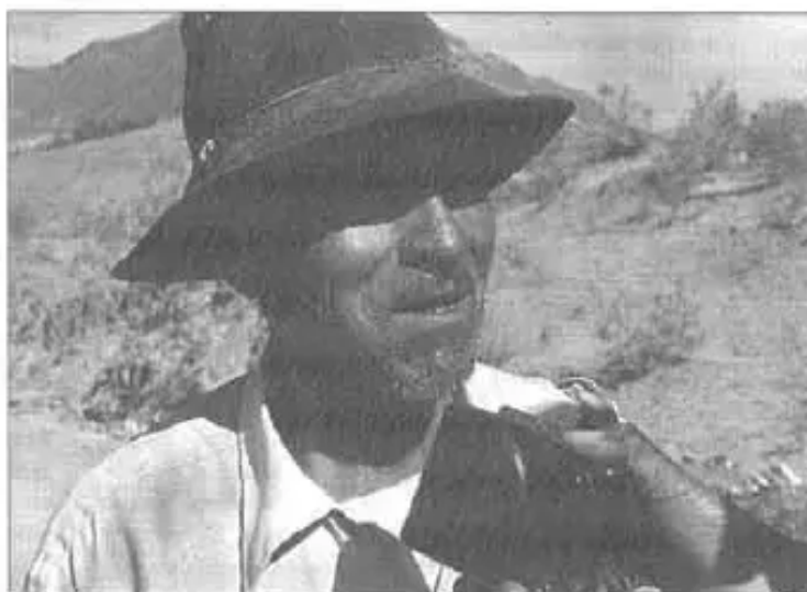
“Latifundio jallp'asta mana kacharichiyta atichkaykuchuqa”

“Chay jallp'amanta saneamientoman yaykunapaqqa, sumaq umacharikuna, mana qaqaman, mana larq'aman urmaykusanapaq, jallp'aqa mana pantanapaqchu. Ley INRAqa saruwasun deltodota, chayta jatuchaq terratenientes churawanchiq”.