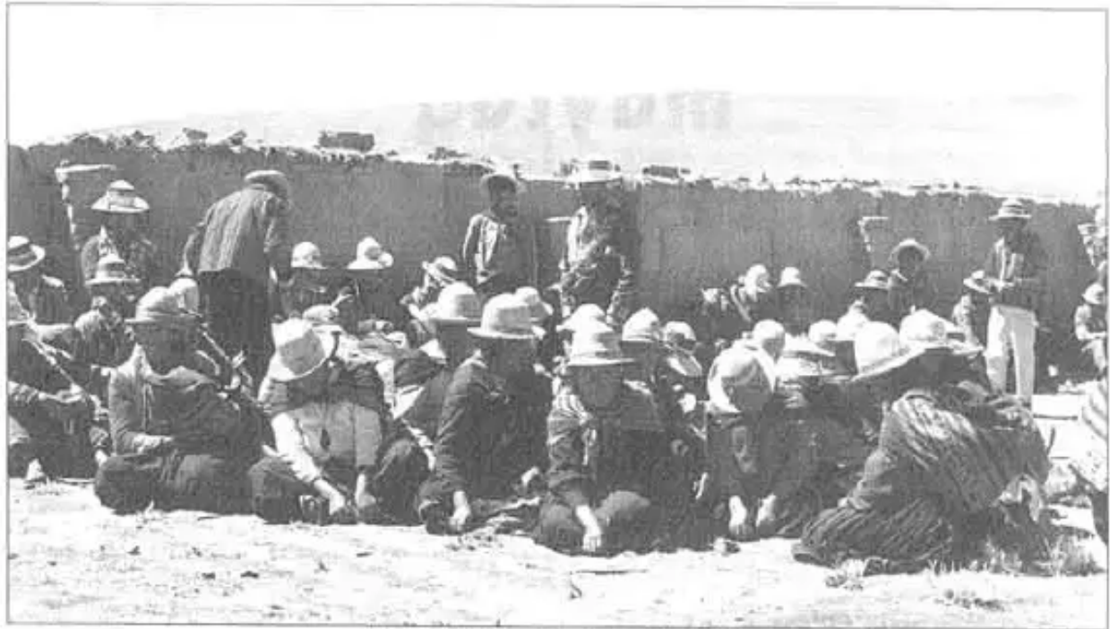
"Tapacaripi jallp'asnyku q'ala chhokasllaña"

"Los procesos de saneamiento non han avanzado casi nada, en regiones tan conflictivas como el