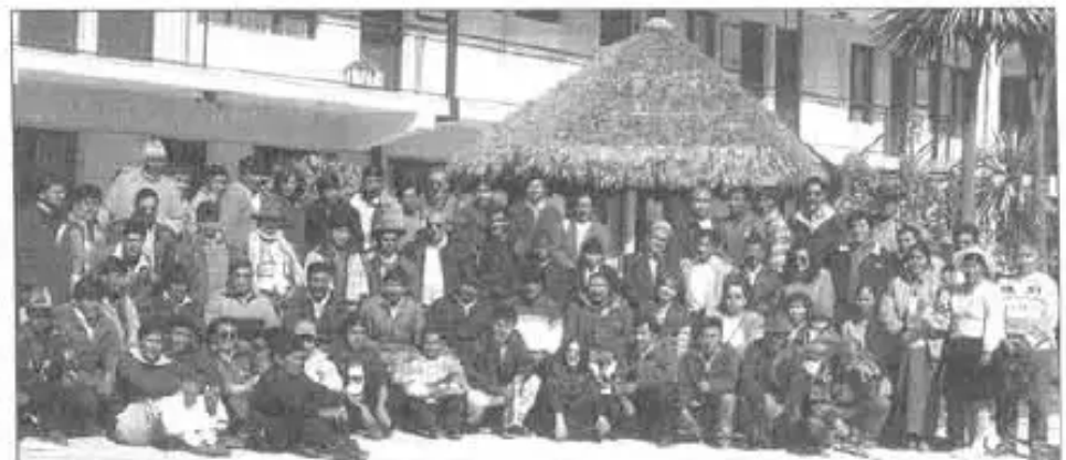
Primer Encuentro de la Mesa Técnica de Tierra-Cochabamba.

El INRA, a través de su Director Nacional, René Salomón, se compromete a ser propiciador de esta cumbre nacional, para perfeccionar la Ley con las modificaciones propuestas, Reinstitucionalización del INRA y también de la judicatura agraria. No es problema de la norma legal, sino es también un problema de la implementación de esa norma y de quienes aplican estas normas.