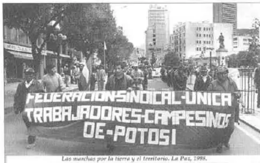
Las marchas por la tierra y el territorio. La Paz, 1998.

Eso yo les pido que difundan a sus bases, tengan bien claro que ni el INRA nacional, ni la departamental va imponer nada, si es que hay una comunidad que no quiere hacer TCO, y vamos a sacarlo su título como estaba".