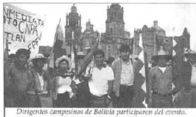
Dirigentes campesinos de Bolivia participaron del evento.

La Coordinadora Latinoamericana de Organizaciones del Campo (CLOC) que congrega a varias organizaciones campesinas e indígenas de Latino América, realizó su III Congreso, del 8 al 11 de agosto en la ciudad de México. Discutieron temas como el de la reforma agraria, migración, género y otros.