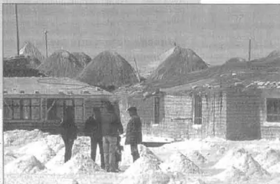
Hoteles en el Salar, cuestionados por comunarios originarios.

Los Nor Lipeños dijeron "No permitiremos más desmembraciones a nuestro territorio" "Si no se solucionan nuestros problemas volveremos a los bloqueos en defensa de nuestra tierra y territorio. Continuamos en estado de emergencia" concluyeron.