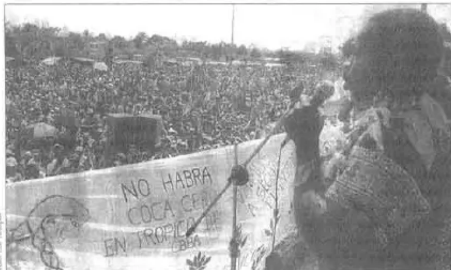
"Los Pueblos seguiremos defendiendo nuestros derechos y la vida"

cocaleros", que la coca sea parte de este universo", "su causa es nuestra causa, su lucha es nuestra lucha", "coca no es cocaína", "Coca sí, Coca Cola no", "El pueblo unido jamás será vencido", fueron los pronunciamientos de más de una decena de personas que tomaron la palabra en la concentración. La lucha contra el neoliberalismo, modelo al que se atribuye la "desdicha" de los pueblos de todo el mundo, fue también la consigna trasladada al trópico Cochabambino.