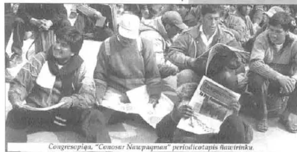
Congresopiqa, "Conosur Nawpaqman" periodicotapis ñawirinku.