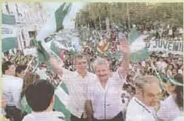
SANTA CRUZ: Derechamanta kaqkuna autonomía departamentalwan saruyta munachawanchik