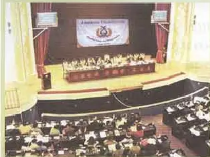
SUCRE: Kay chiqapi constituyentes llank'anku