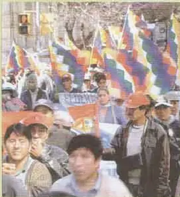
“Organizaciones uk runa jinalla sayaykuna, Pacto de Unidad propuestata jark'anapaq”