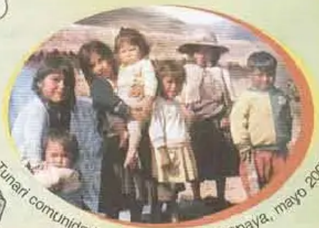
Tunari comunidadmanta, provincia Ayopaya, mayo 2007