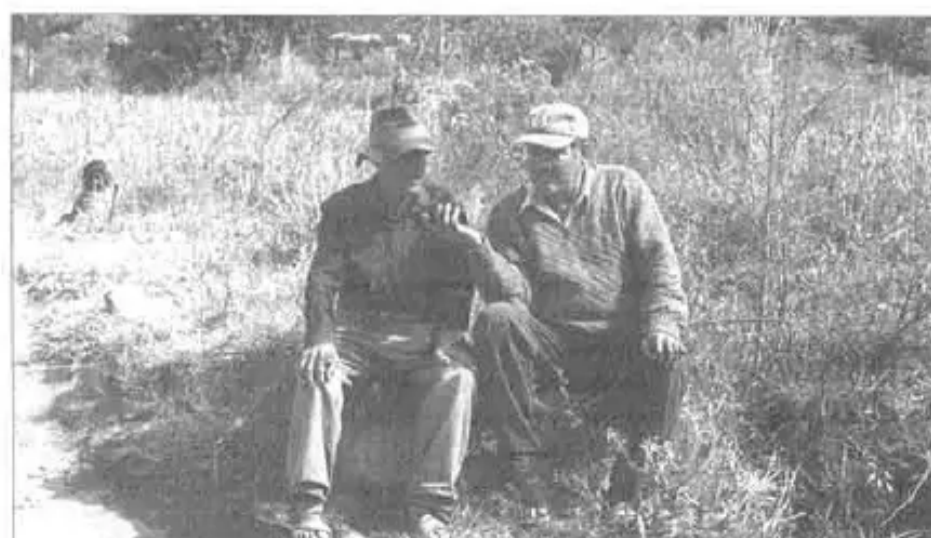
Periódico Conosur Nawpaqman comunarioswan parlan (Tukma - Mizque)