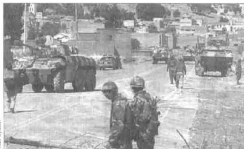
Ejército se desplaza para reprimir

Aymara, negociaciones de facilitadores y, finalmente, apareció la disposición al diálogo.