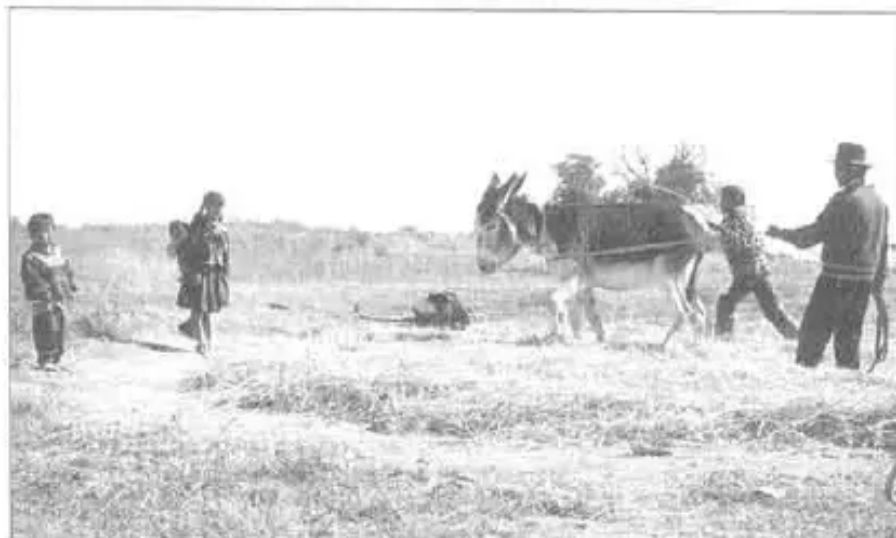
"Ñawpaq tarpusqasta uqharichikayku" - Calera (Mizque)