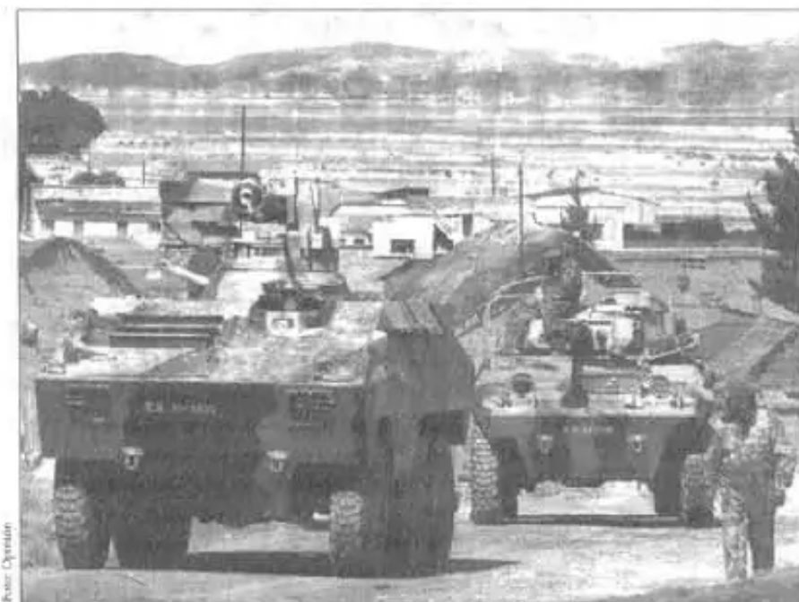
Tanques de guerra contra el pueblo aymara

Achakachi, 7 de julio del 2001 Firmado: Consejo Supremo de Mallkas y Amawt'as de Jach'a Umasuyu.