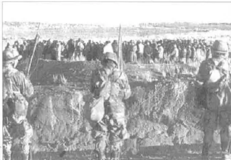
Originarios aymaras en Asamblea