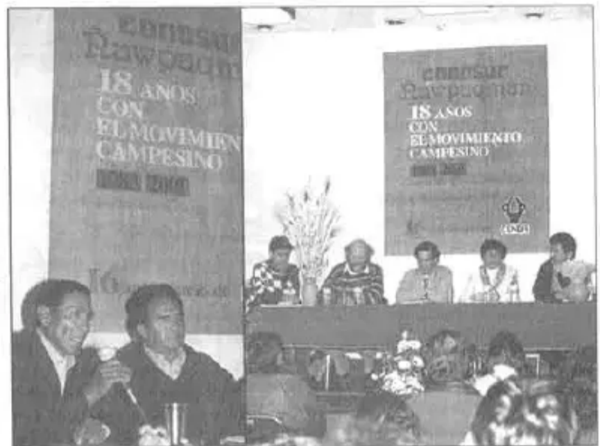
Der.: autores originarios de "Los Lipez, sangre y oro". Izq.: Expositores evento

"En los años 90, 9), frente a esta situación, empieza a levantarse lo que es la independencia política de las organizaciones campesinas, independencia frente al estado, a los partidos políticos y a los nuevos patrones". Actualmente el Periódico Conosur Ñawpaqman continúa el apoyo a esa corriente crítica e