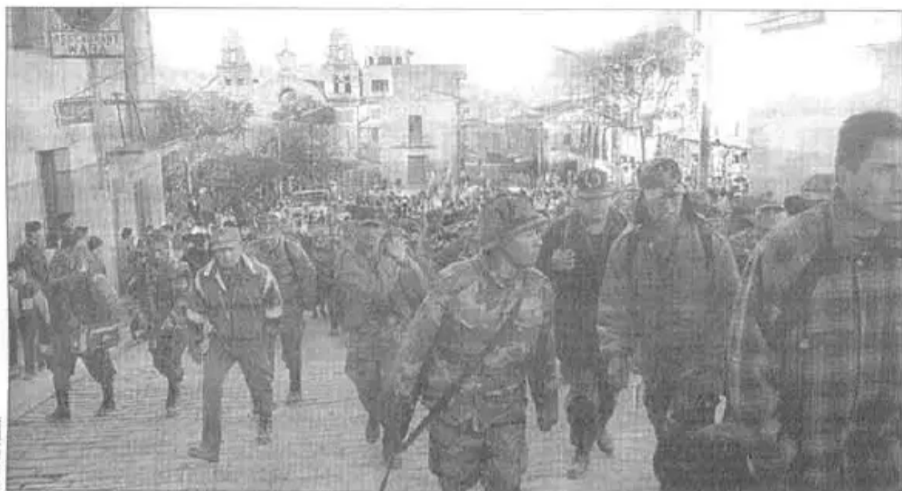
Campesinos y pueblo expulsan a militares y policías de Yungas de La Paz