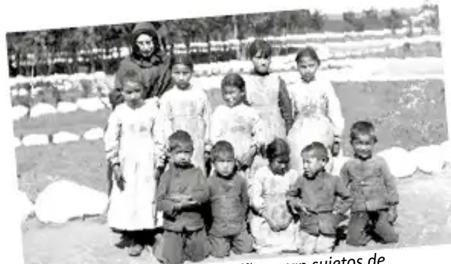
Para los investigadores, los niños eran sujetos de investigación ideales.

Esto es ¡Genocidio cultural! contra los niños, niñas indígenas.