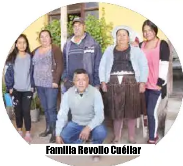
Familia Revollo Cuéllar

“Tatakuna, mamakuna wawasman yachachina tiyan qhichwa parlayta”.