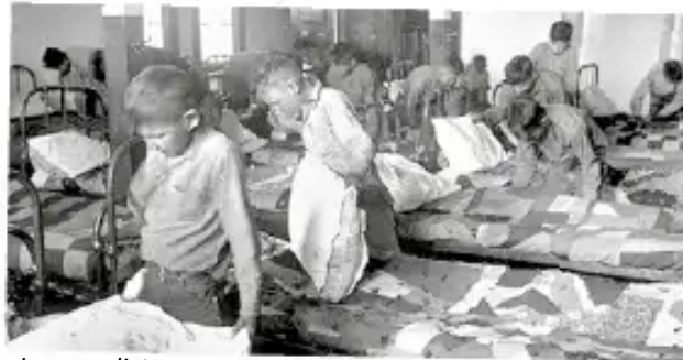
Las condiciones en que vivían estos niños eran atroces.

La Comisión para la Verdad y Reconciliación (CVR) dijo que los niños habían muerto mientras estaban en internados. Sus cuerpos rara vez regresaban a casa y muchos fueron enterrados en tumbas sin nombres.