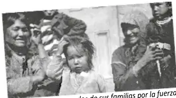
Los niños eran separados de sus familias por la fuerza.

Han calculado que 6000 niños y niñas murieron en los internados. La Iglesia católica tenía 130 internados para niños indígenas, financiados por el gobierno de Canadá. A estos niños no se les permitía hablar su idioma ni practicar su cultura, eran maltratados y sufrían abusos.