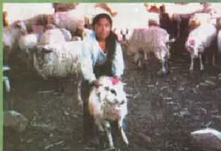
"Koy jina k'achituta uwlfayta k'achanchayku"