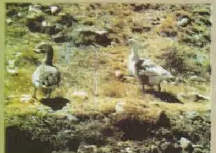
“Vacas chiqapi Phña gansostapis uywallaykupuni”