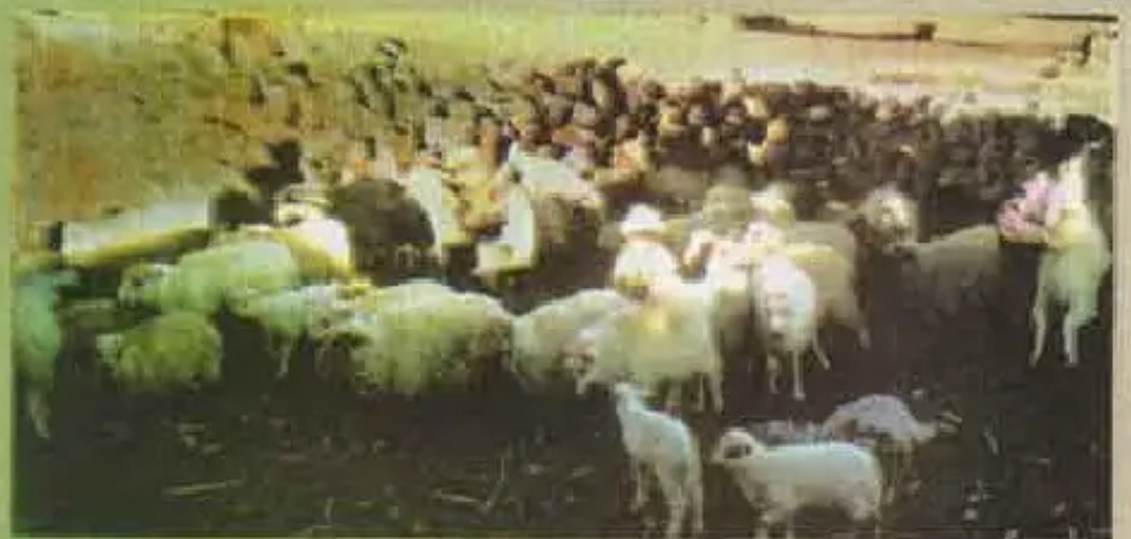
“Uwifoto corralman puñunankupaq qhathykuchkayku” - Vacas

Uwijaq aychanqa mikhunapaq, chaymanta chay millmanwan phulluta ruwarikunchis chay sirven q’uñisitu puñunanchispaq chay uwija phulluqa q’uñisitupuni. Warak’atapis mamay uwija millmitamanta ruwapuwan.