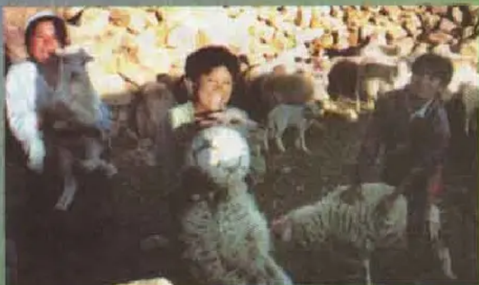
"Wawraqa uywawan khuchka campopiqa kawsayku" - Ch'ullwamayu, Voces

"Chaymanta yakuwan qhallinakurqayku, chaymanta uywasniykuta quchaman qhatirqayku, yakuta tomachimurqayku"