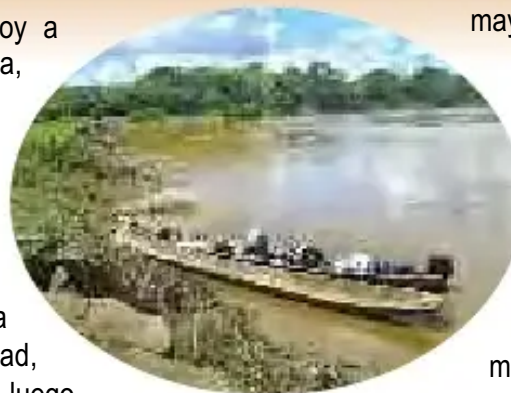
Transporte en canoa, TIPNIS (Carlos Callapa)

“Llegamos a nuestra comunidad por Trinidad, arribando el Isiboro Sécore, luego apartamos al río Ichoa, luego apartamos al río Chivinista, apartamos al río Moze y llegamos al rancho, a media pampa. Ahí hay ganadería, produce todo. San Antonio es un pueblito, una pampa. El viaje es todo por agua, desde el puerto de Trinidad hasta llegar a la casa tardamos unos 4 días mínimo. En San Antonio vivimos unas 36 personas, puro