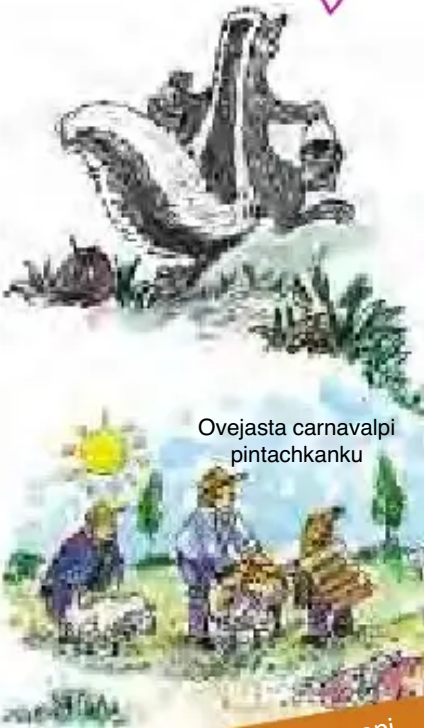
Ovejasta carnabalpi pintachkanku