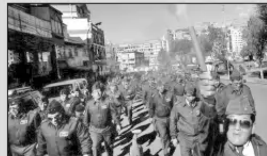
Uniformados marchan en La Paz.

Los efectivos de las Fuerzas Armadas de la Nación acatan órdenes, respetan una doctrina militar y dependen de una disciplina vertical; sin embargo, entre el 3 y el 21 de abril, cientos de suboficiales y sargentos, junto a sus esposas y representantes de otros movimientos sociales, fueron protagonistas de marchas callejeras hasta obligar a sus superiores a debatir su Pliego de Peticiones.