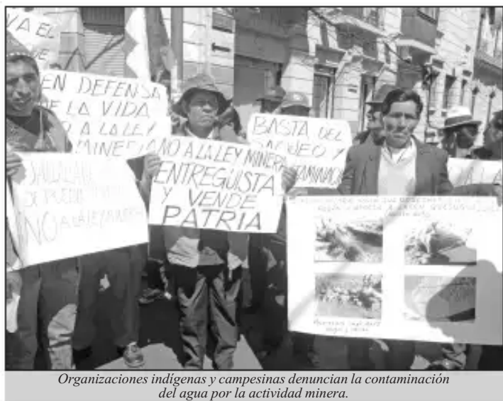
Organizaciones indígenas y campesinas denuncian la contaminación del agua por la actividad minera.

• 28 de mayo de 2014: El Vicepresidente Álvaro García Linera promulgó la Ley N° 535 de Minería y Metalurgia en Oruro, dejando de lado los reclamos de las comunidades afectadas por la contaminación de la minería y a espaldas del pueblo boliviano.