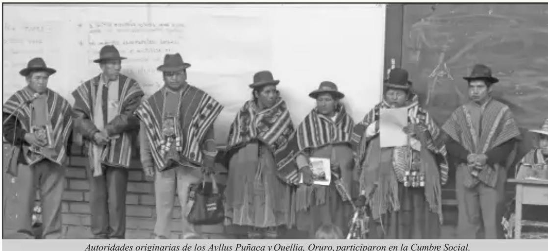
Autoridades originarias de los Ayllus Puñaca y Quellia, Oruro, participaron en la Cumbre Social.

Por considerar que varios de sus artículos son contrarios a los derechos colectivos, al derecho a la protesta, al derecho humano al agua y a la Madre Tierras, más de 800 representantes, entre mujeres y hombres de organizaciones indígenas, originarias y campesinas de Tierras Altas y Tierras Bajas, colectivos urbanos, comunidades afectadas por la minería, universitarios e instituciones, se reunieron en dos Cumbres Sociales sobre la propuesta de Ley los días 8 y 9 de mayo en La Paz y en torno a la Ley Minera los días 5 y 6 de junio en Santa Cruz.