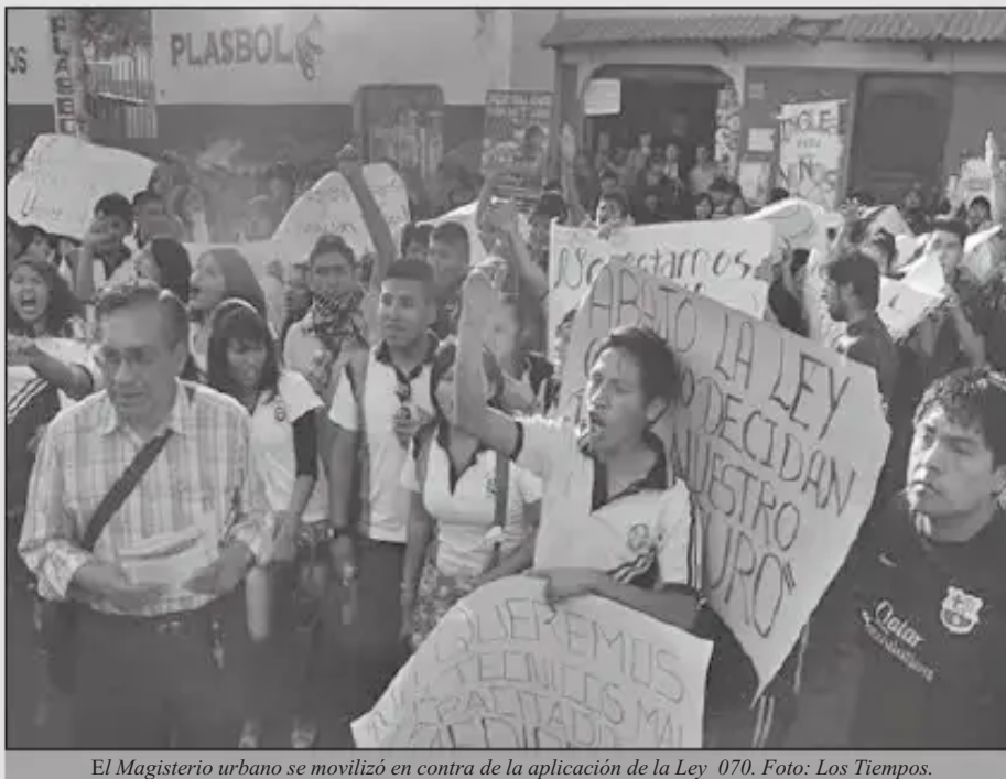
El Magisterio urbano se movilizó en contra de la aplicación de la Ley 070.

Mientras las federaciones de maestros urbanos de cinco departamentos rechazan la imposición de la nueva ley, el sector del magisterio rural, los colegios privados y de convenio aceptaron la flexibilización en su aplicación.