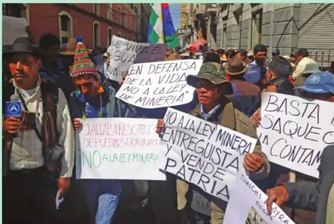
Sectores sociales se movilizan en contra de la nueva Ley Minera en la ciudad de La Paz.

La Ley 535 de Minería y Metalurgia promulgada el 28 de mayo del presente año, atenta contra la Constitución Política del Estado (CPE) y los derechos colectivos de los pueblos indígenas, según las organizaciones sociales de Tierras Altas y Tierras Bajas.