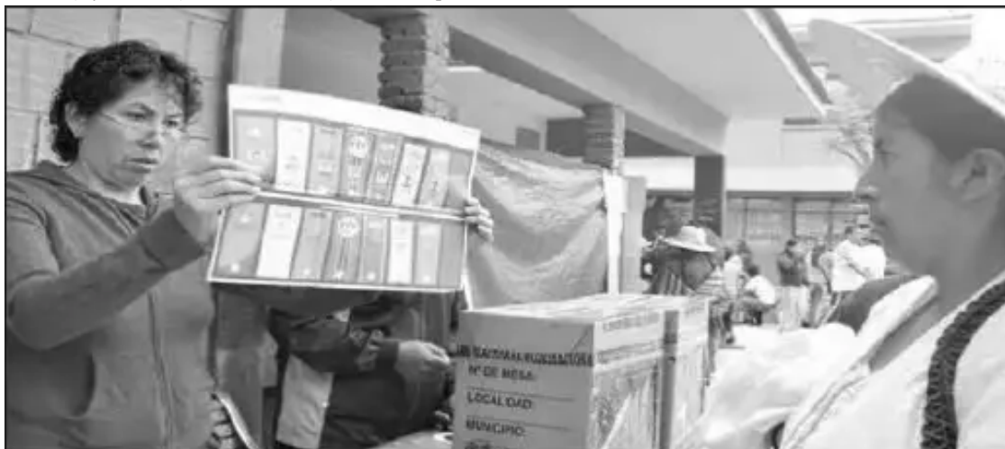
Mujer del campo sufraga en las anteriores elecciones.

En el país hay unos 10 mil militares de bajo rango, de un total de 40 mil miembros de las Fuerzas Armadas.