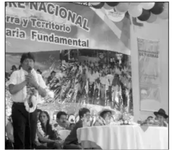
Qallariypi: Autoridades gobiernomanta cumbrepi chukurichkanku, Santa Cruz llaqtapi.

Posteriormente, la comisión Tierra Territorio de la CSUTCB, dio informe de las 3 precumbres realizadas el año 2013 en los 9 departamentos, para que dichas conclusiones sean tomadas en cuenta.