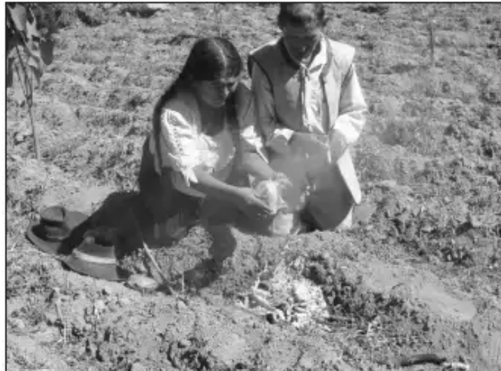
La q'uwa para la siembra es una de las prácticas culturales del Pueblo Indígena Originario Pabellón.

Ambos pueblos originarios del departamento de Cochabamba manejan sus tierras y recursos naturales de acuerdo a normas y procedimientos propios, desde antes de la llegada de los españoles; mantienen y comparten tradiciones culturales, creencias, autoridades y formas de organización propias desde tiempos ancestrales. Estas formas de vida, están reconocidas y protegidas por los artículos 2, 30 y 403 de la Constitución Política del Estado Plurinacional de Bolivia.