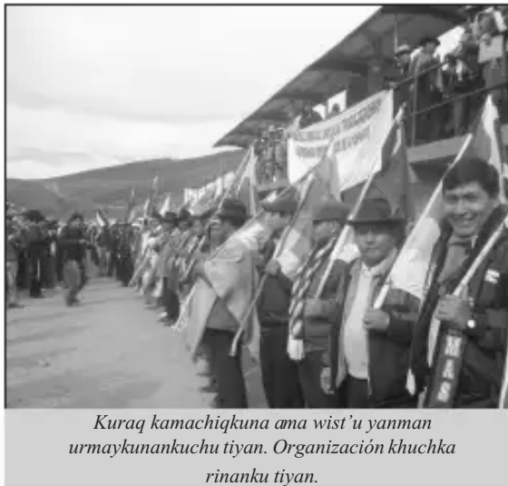
Kuraq kamachiqkuna ama wist’u yanman urmaykunankuchu tiyan. Organización khuchka rinanku tiyan.

Musuq directoriopi 32 miembros kanku. Paykuna orgánicamente basespaq kamachisqanman jina Federacionta ñawpaqman apanqanku 2014, 2016 kama. Chunka qanchiqniyuy congreso Tarata llajtapi ruwakunanpaq qhipanku.