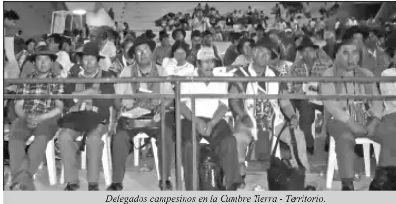
Delegados campesinos en la Cumbre Tierra - Territorio.

Presidente Evo Morales cuestionó el autogobierno: "Hermanas y hermanos si hay un debate sobre tierra y territorio yo comparto perfectamente, pero me preocupa un subtítulo de la convocatoria. Comparto todas las mesas para debatir, pero la mesa 6 dice Gestión Territorial Recursos Naturales y Autogobierno, si dicen autogobierno, entonces yo no soy parte de este movimiento, así se entiende, pero además de eso Gestión Territorial Recursos Naturales y Autogobierno, qué