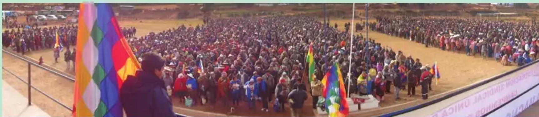
Phichqa waranqa aswan congresistas Bolívar llaqtapi organizacionta thaskichirqanku, Cochabamba.