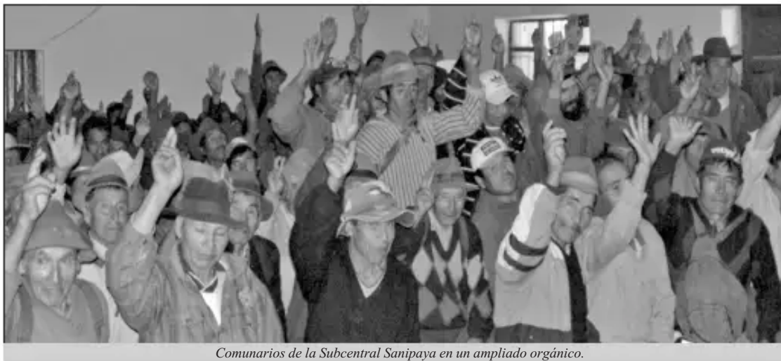
Comunarios de la Subcentral Sanipaya en un ampliado orgánico.

El 16 de abril de 2014, comunarios de la Subcentral de Sanipaya en un ampliado orgánico decidieron por unanimidad modificar el proceso de saneamiento de propiedad comunaria a saneamiento de Tierras Comunitarias de Origen (TCO).