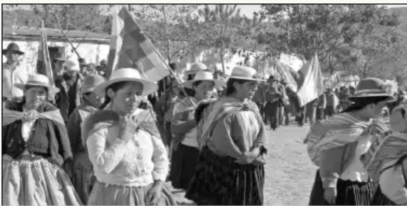
Organización de mujeres de Ayopaya, 2005.