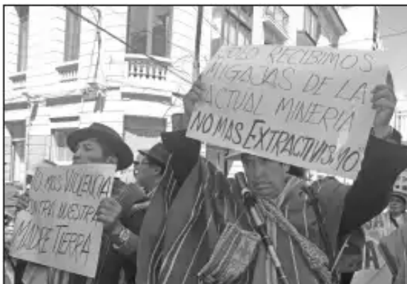
Comunidades afectadas por la minería exigen respeto a sus derechos.

Cualquier acción, movilización o bloqueo que se organice para impedir el inicio o para suspender actividades de explotación minera (art. 99. II; art. 100) será reprimida con el auxilio de la fuerza pública (art. 100); los dirigentes, responsables de convocar a la movilizaciones en defensa de su territorio y de sus fuentes de agua, deberán resarcir daños y perjuicios al titular de derechos mineros, además serán pasibles a la responsabilidad penal correspondiente, es decir, que les pueden enviar a la cárcel (art.101 num. III).