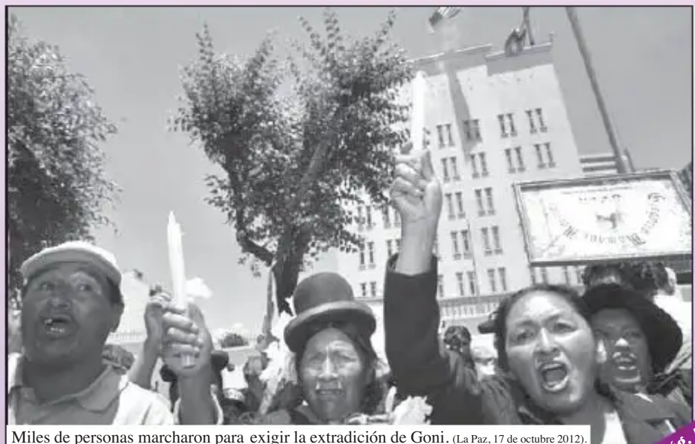
Miles de personas marcharon para exigir la extradición de Goni. (La Paz, 17 de octubre 2012).