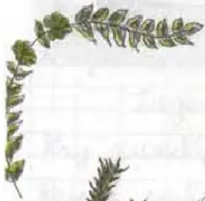
Iyigi Horno Juk'uta Chumpo