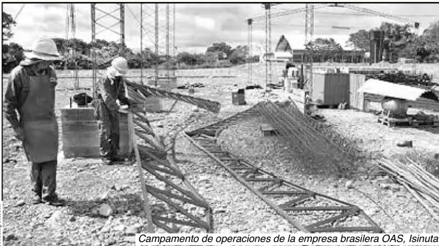
Campamento de operaciones de la empresa brasilera OAS, Isinuta