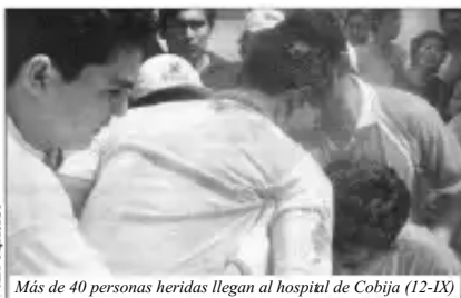
Más de 40 personas heridas llegan al hospital de Cobija (12-IX)

“Venían de todos lados armados, y nosotros nos bajábamos del carro como pudimos y corrimos” “Esos niños suplicaban que no les maten a sus madres...”