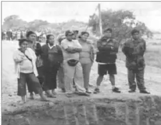
Zanja cavada por los matones de la prefectura en Tres Barracas Pando (11-IX)

“Nos han perseguido por el bosque como a perros, como a animales”.