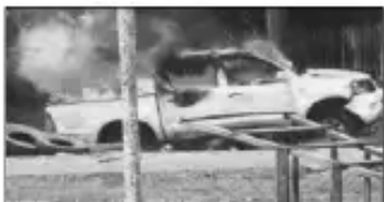
Camioneta en llamas-Filadelfia-Pando (11-IX, 4:30 de la madrugada)

“La gente se ha desparramado, estábamos indefensos, se tiraban al río y ahí en el río, increíble, con metrallas acibillaban a las personas que cruzaban. Tiraban bombas a las cabezas de las mujeres y hombres que cruzaban. Esos hechos queremos denunciar y queremos que se haga justicia para nuestra gente campesina, nos sentimos mal porque nunca antes nos había sucedido esto”.