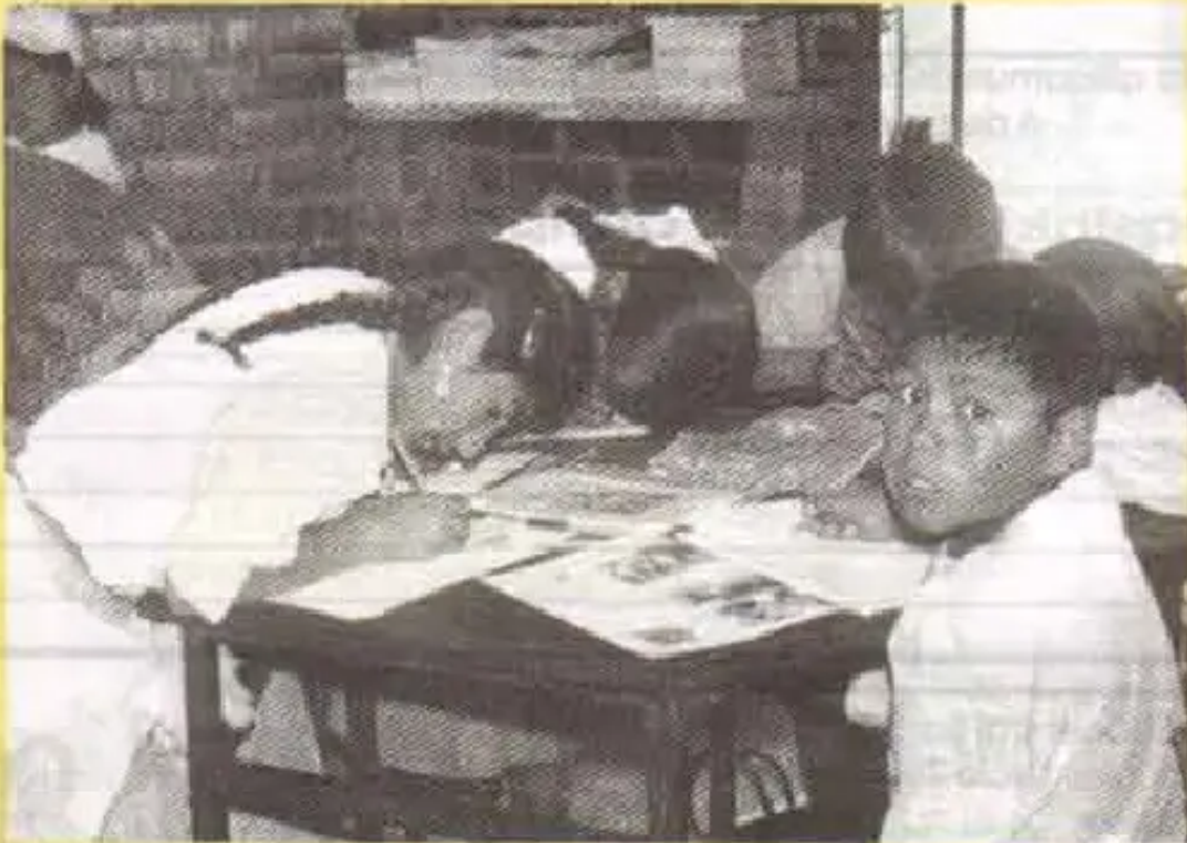
Wawakuna escuela Raqaypanpamanta