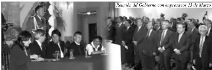
Reunión del Gobierno con empresarios 23 de Marzo