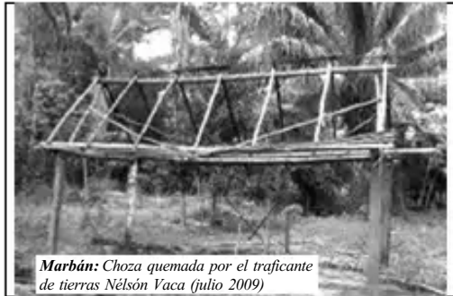
Marbán: Chozas quemadas por el traficante de tierras Nélsón Vaca (julio 2009)