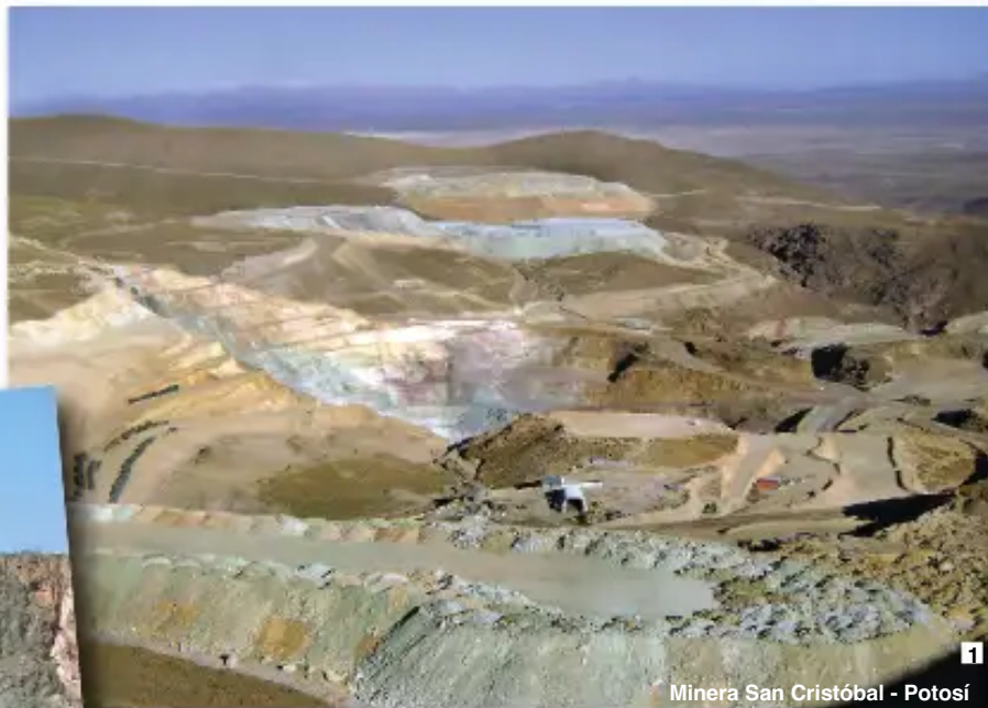
Minera San Cristóbal - Potosí

La Minera San Cristóbal consume 50 millones de litros de aguas fósiles por día!! (aguas milenarias), según el estudio técnico científico del hidrogeólogo Robert Moran.