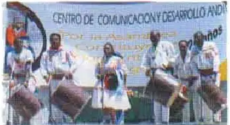
Key fotopi Saya A'tro boliviana takirichkanku.