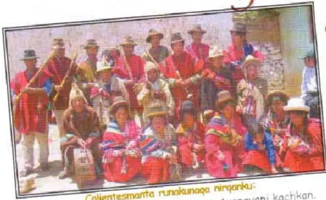
Calientesmanta runakunaqa nirqanku:

"Llaqtaykuqa sinchi chiri, Calientesqa Ayopayapi kachikan. Chaypiqa papalla puqun, chaymanta ch'uñuta, tuntata ima ruwayku. Nuqaykuqa qhichwata, aymarata, castellanota ima parlayku".