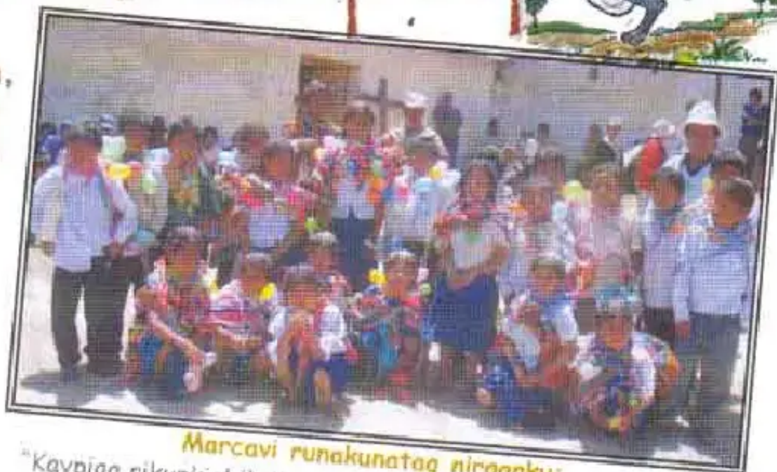
Marcavi runakunataq nirqanku:

nka kimsayuqmanta, chunka octubre killapi 2005 watapi. ntesmanta, Marcavimantawan anta riqsinachikurqanku.