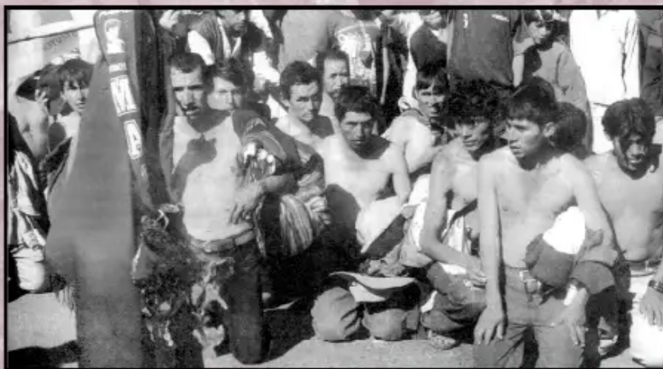
Humillación a campesinos. Sucre 24 de mayo 2008

Dijo el Ampliado de emergencia de la CSUTCB en Sucre.