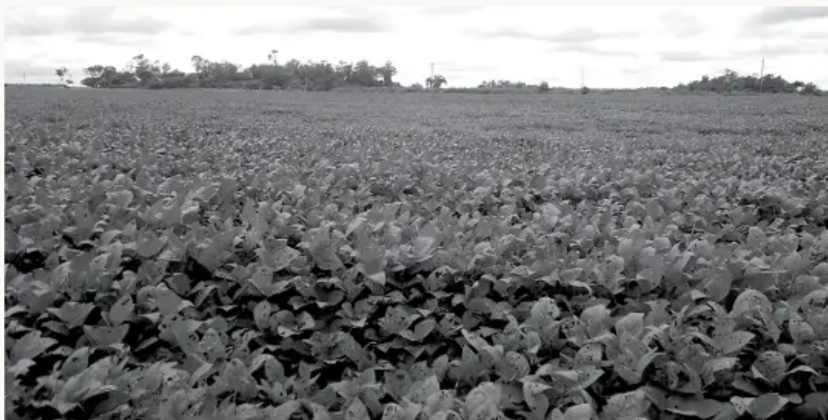
Monocultivo de soya en la Amazonía

Además los efectos residuales de estos productos ponen en riesgo la salud humana y ambiental por contacto directo pero también por la contaminación de las fuentes de agua (no se consideraron acciones de mitigación en las áreas de fumigación).