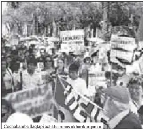
Cochabamba llaqtapi achkha runas ukharikurqanku.

Tukuy runakuna phutiywan rikurqanku imaynatachus marchapi kaqkunata policías maqaspa karqanku, tiyakuqkuna Bolivia llaqtapi, qutus, universidadpi yachaqaqkuna, yachachiqkuna, llank'aqkuna, amas de casa, choferes, qhuyapi llank'aqkuna, jallp'a patapi tiyakuqkuna gobiernop ruwachisqanta saqrata qhawarqanku. Uqharikurqanku, bloqueos nisqata ruwarqanku, yarqayman huelgaman yarkurqanku,