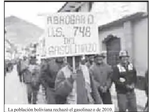
La población boliviana rechazó el gasolinazo de 2010.

Por otra parte, la distribución de estos millonarios recursos entre el Estado y las petroleras se sustentaba en la decisión pública de las autoridades gubernamentales para elevar de 27 a 59 dólares el precio interno del barril de petróleo pagado a las transnacionales.