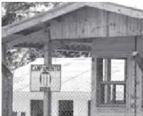
Frontis del campamento de OAS en Isinuta, Chapare.

La construcción de la carretera Villa Tunari - San Ignacio de Moxos fue adjudicada a la empresa brasileña OAS, bajo la modalidad "llave en mano" por un precio total de 415 millones de dólares. El 80% del total de este monto es financiado por un crédito brasileño. Esta adjudicación tiene muchas observaciones.