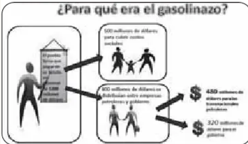
Ilustración en base al estudio: "Gasolinazo: Subvención popular al Estado y a las Petroleras - CEDLA 2011"