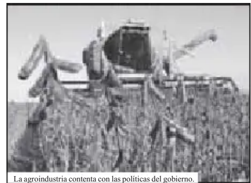
La agroindustria contenta con las políticas del gobierno.

La nueva Ley de Bancos tendrá un trato especial para créditos productivos, afirmó el ministro de Economía