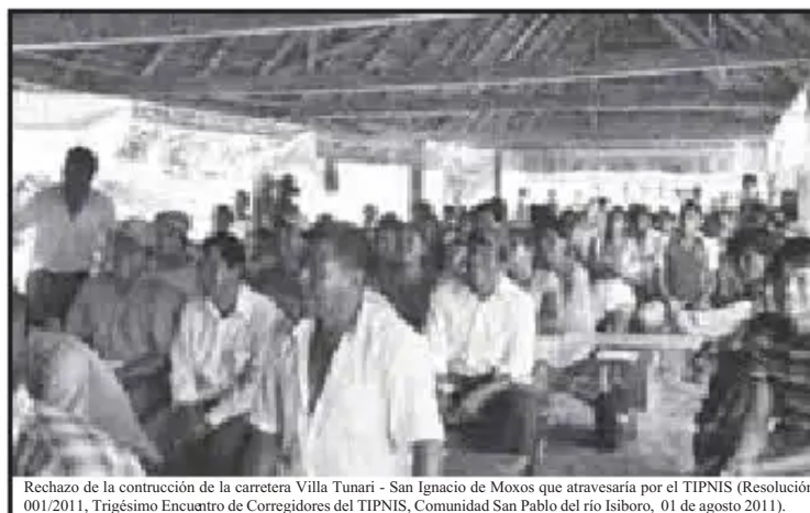
Rechazo de la construcción de la carretera Villa Tunari - San Ignacio de Moxos que atravesaría por el TIPNIS (Resolución 001/2011, Trigésimo Encuentro de Corregidores del TIPNIS, Comunidad San Pablo del río Isiboro, 01 de agosto 2011).

La Declaración de las Naciones Unidas sobre los Derechos de los Pueblos Indígenas, ratificado en Bolivia mediante Ley Nº 3760 del 7 de noviembre de 2007, claramente menciona en su Art. 32, numeral 2: “Los Estados celebrarán consultas y cooperarán de buena fe con los pueblos indígenas interesados por conducto de sus propias instituciones representativas, afin de obtener su consentimiento libre e informado antes de aprobar cualquier proyecto que afecte a sus tierras o territorios y otros recursos, particularmente en relación con el desarrollo, la utilización o la explotación de recursos minerales, hídricos o de otro tipo”.