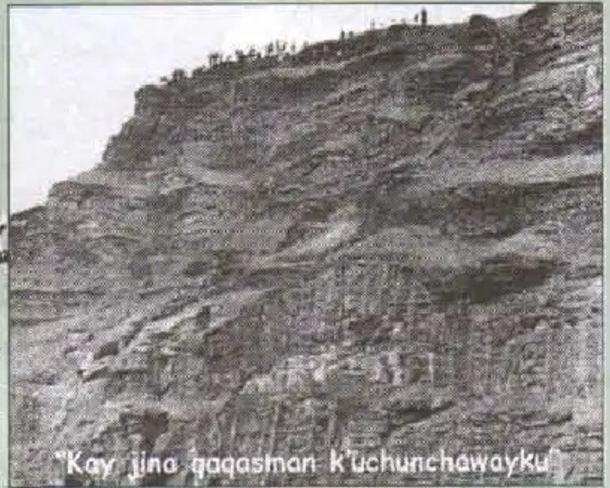
"Kay jina qaqasman k'uchunchawayku"

Imapaqtaq tatakunanchik thaskirqanku, chayta yachayta munaspa qhatikurqani. Chaypi uyarirqani achka ch'aqwaykunata: