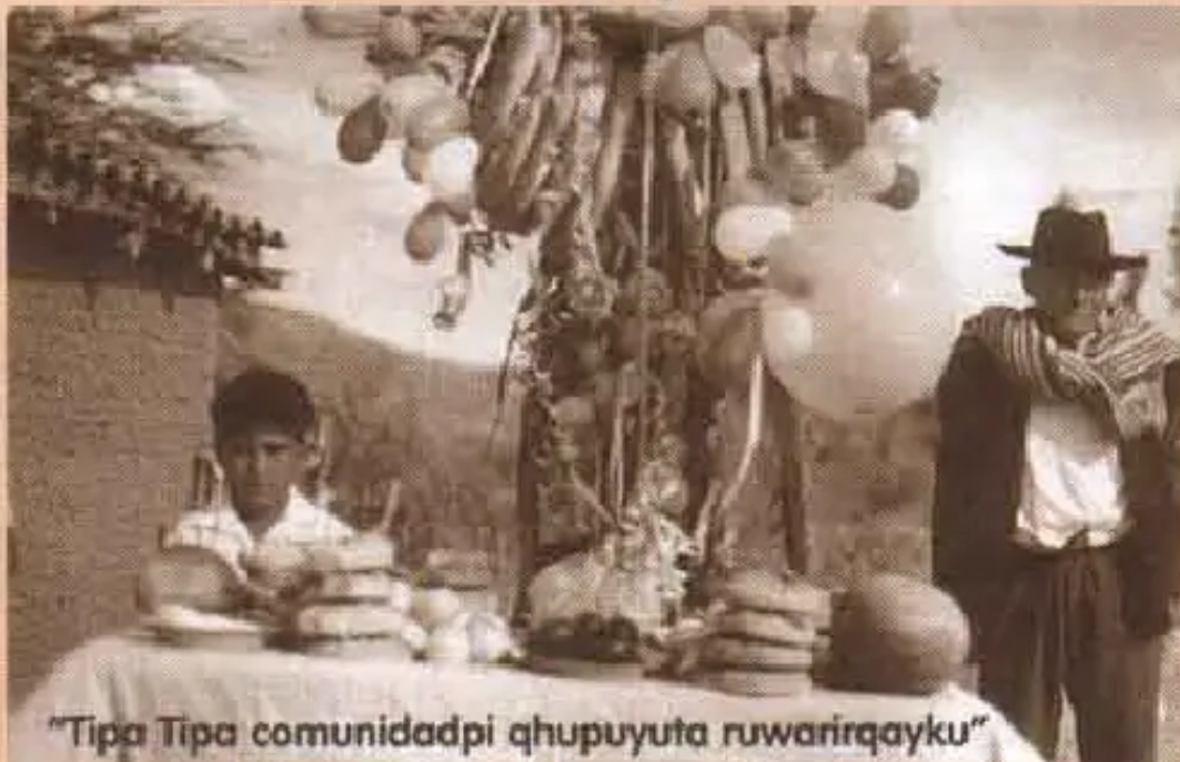
"Tipa Tipa comunidadpi qhupuyuta ruwarirqayku"

Al año vamos hacer qhupuyus, a mi me gusta cantar y bailar. Las coplas nos tenemos que inventar, no tenemos que copiarnos de la radio, porque es una vergüenza".