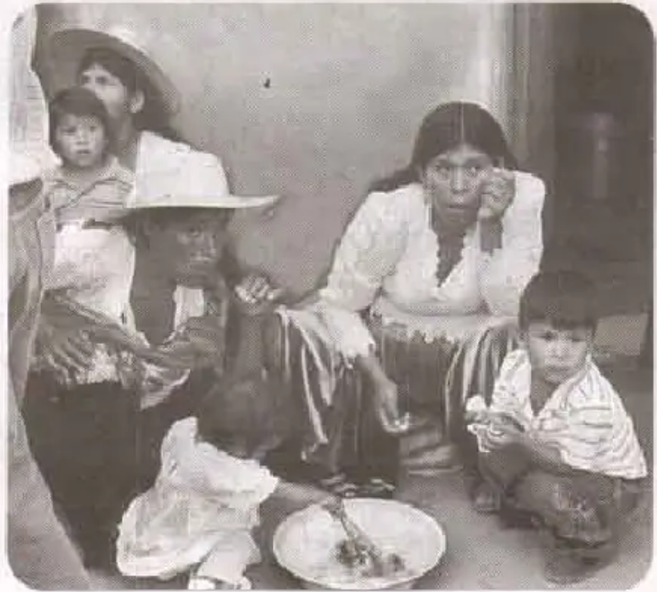
Khurumayu-Mizque chiqapi, t'impu mikhunata mikhurikuchkanku

Willariwanchik: Fernando Sanchez, Cristhian Ovando-Mizque