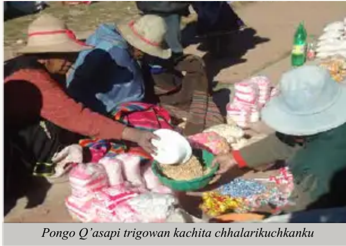
Pongo Q'asapi trigowan kachita chhalarikuchkanku

Chhalakuqa achkha chiqakunapi ruwakun, cosecha pisiyaptin pisillataq. Kaymanta runa masiwan parlarirqayku: