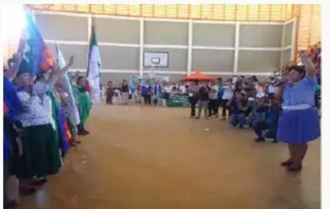
Pando: Mama Isabel Confederación Nacional de Mujeres “Bartolina Sisa” juramentachichkan congresalistasta.