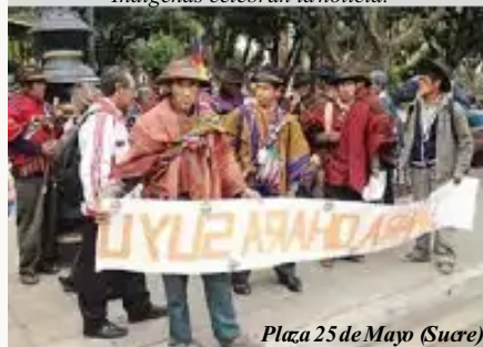
Plaza 25 de Mayo (Sucre)

Pueblos indígenas ya no necesitan Personería Jurídica para el ejercicio pleno de sus derechos. El Tribunal Constitucional Plurinacional (TCP) declaró inconstitucional ese requisito. Un grupo de autoridades indígenas celebraron la noticia.