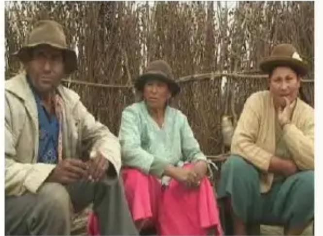
Tatan, maman orgullosos wawankumanta kanku

“Kunitan mana facilchu orgánico, político llank’ana, mana kanchu ñawpata jina, congresosqa debatinapaq kaq, analizanapaq kaq, contra Estado kanapaq. Resolucionespis respetanapaq kaq, kunan mana kanchu, analizana tema coyuntura actual mana nipi ni imata ninchu, nuqapis qhawallani”.