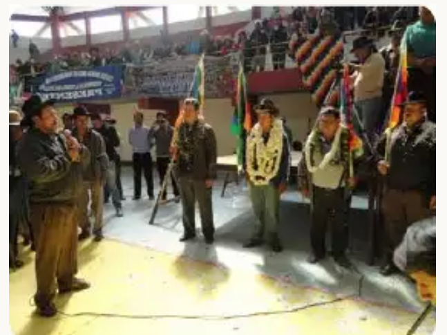
Nuevo Comité Ejecutivo de la FSUTCC (2016-2018)

El próximo XVIII Congreso Ordinario de la FSUTCC se realizará en la provincia Arani, Normal “Ismael Montes” de Vacas.