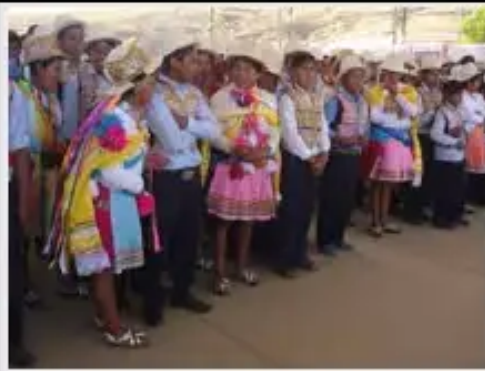
Artículo 2 Constitucionmanta junt'akun

La Central Regional Sindical Única de Campesinos Indígenas de Raqaypampa (CRSUCIR) es el primer pueblo indígena quechua que consolida la autonomía indígena en base al reconocimiento de su territorio vía TCO. Su preexistencia, autogobierno y libre determinación es reconocida y se consolida al constituirse como primera Unidad Territorial Indígena, que se desprende del Municipio de Mizque, departamento de Cochabamba.