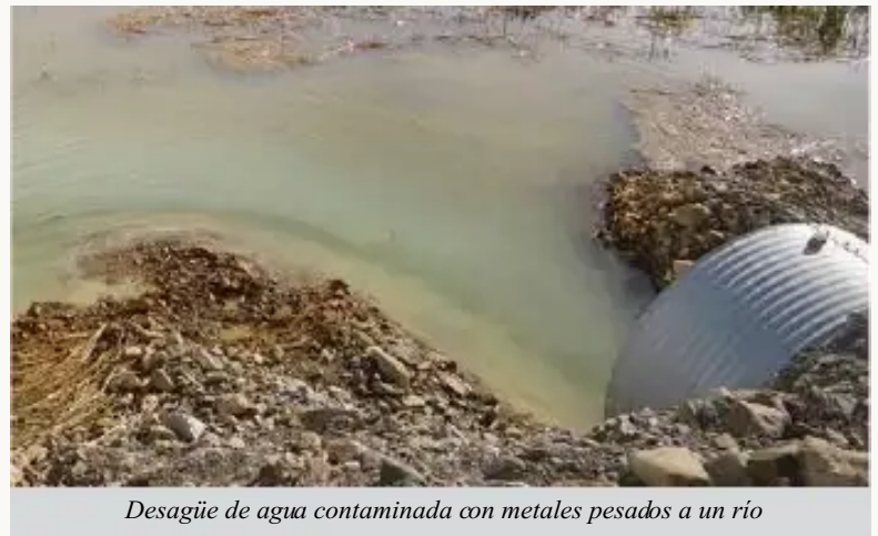
Desagüe de agua contaminada con metales pesados a un río

La vida de las poblaciones ha sido fuertemente afectada por la contaminación, los jóvenes han migrado a las ciudades y los que viven de la agricultura y pecuaria son afectados por la contaminación del agua.