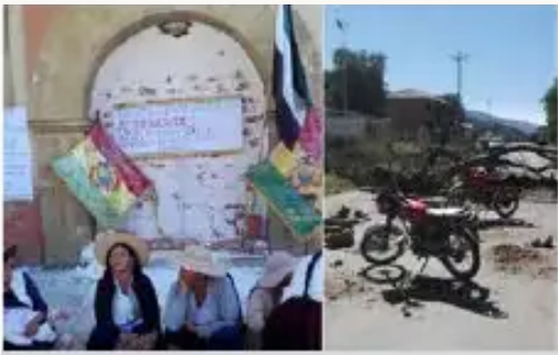
Juntas vecinales tapiaron la alcaldía de Mizque.

El pueblo de Mizque fue paralizado por cuatro días, las siete juntas vecinales junto al Comité Cívico se movilizaron por el pliego petitorio de 13 puntos que no fue solucionado por las autoridades desde el 2013. Luego de un cabildo abierto se decide iniciar con medidas de presión en contra de la alcaldía de Mizque, iniciando el bloqueo de caminos, cerrando todas las entradas y salidas del pueblo (ocho puntos de bloqueo), el bloqueo de caminos se mantuvo por cuatro días (22, 23, 24, 25 de junio) los más perjudicados resultaron los viajeros que transitan por la ruta Cochabamba-Sucre.