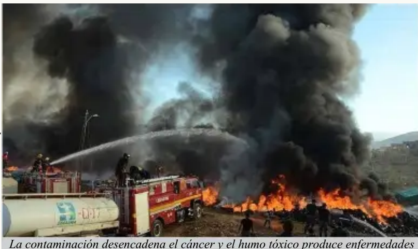
La contaminación desencadena el cáncer y el humo tóxico produce enfermedades

El incumplimiento de la normativa nacional en materia ambiental, la falta de interés y voluntad política de las autoridades nacionales, departamentales y municipales y el interés económico y político, han sido priorizados antes de pensar y generar una adecuada gestión ambiental ya sea en materia hídrica, protección de ecosistemas o tratamiento de residuos sólidos. El análisis de los mismos demuestra que falta aún mucho por trabajar para que en nuestro país se logre una adecuada gestión ambiental.