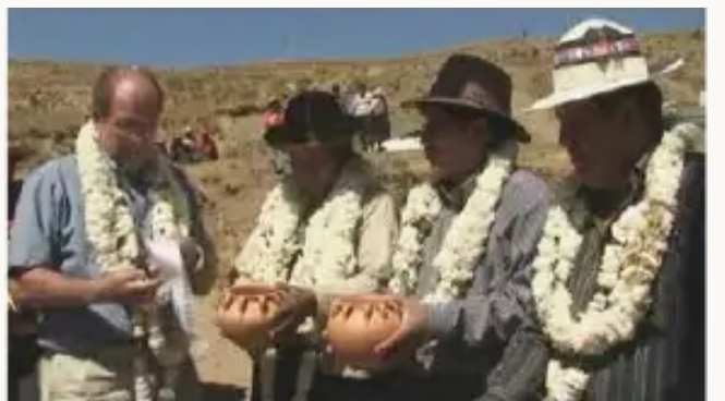
Pongo Q’asapi Colegio Internado warmispaq inaugurachkusan