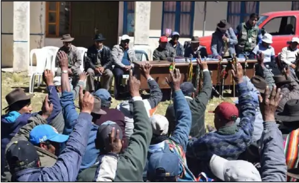
Ampliado Ordinario Central Regional Indígena Originaria Quechua Aymara de Altamachi (27 de abril de 2016)

Comunidades de base de la Central Regional Indígena Originaria Campesina Quechua Aymara de Altamachi (provincia Ayopaya), ratifican y exigen titularse como Tierra Comunitaria de Origen (TCO), su territorio es de 272.009 hectáreas, es la segunda TCO más grande del Municipio de Cocapata, provincia Ayopaya. La TCO - CSUTCOA fue la primera en titularse con una extensión de 250.000 hectáreas, siendo los dueños de ese territorio las comunidades de las Centrales Regionales Sequerancho y Colorado y comunidades de la Subcentral de Chillavi y Totorani, donde se respetan las normas y procedimientos propios de las comunidades.