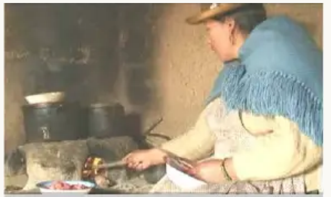
Mama Isabel was inpi wayk’urichkan