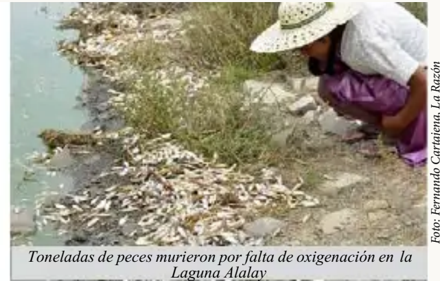
Toneladas de peces murieron por falta de oxigenación en la Laguna Alalay

Delgadillo indica que había un presupuesto de 12 a 13 millones de bolivianos, la Alcaldía recortó a 7 millones bolivianos. “Ahora que habido la muerte de los peces, recién se están preocupando, si esa preocupación fuera permanente no hubiera este desastre” manifestó el profesional.